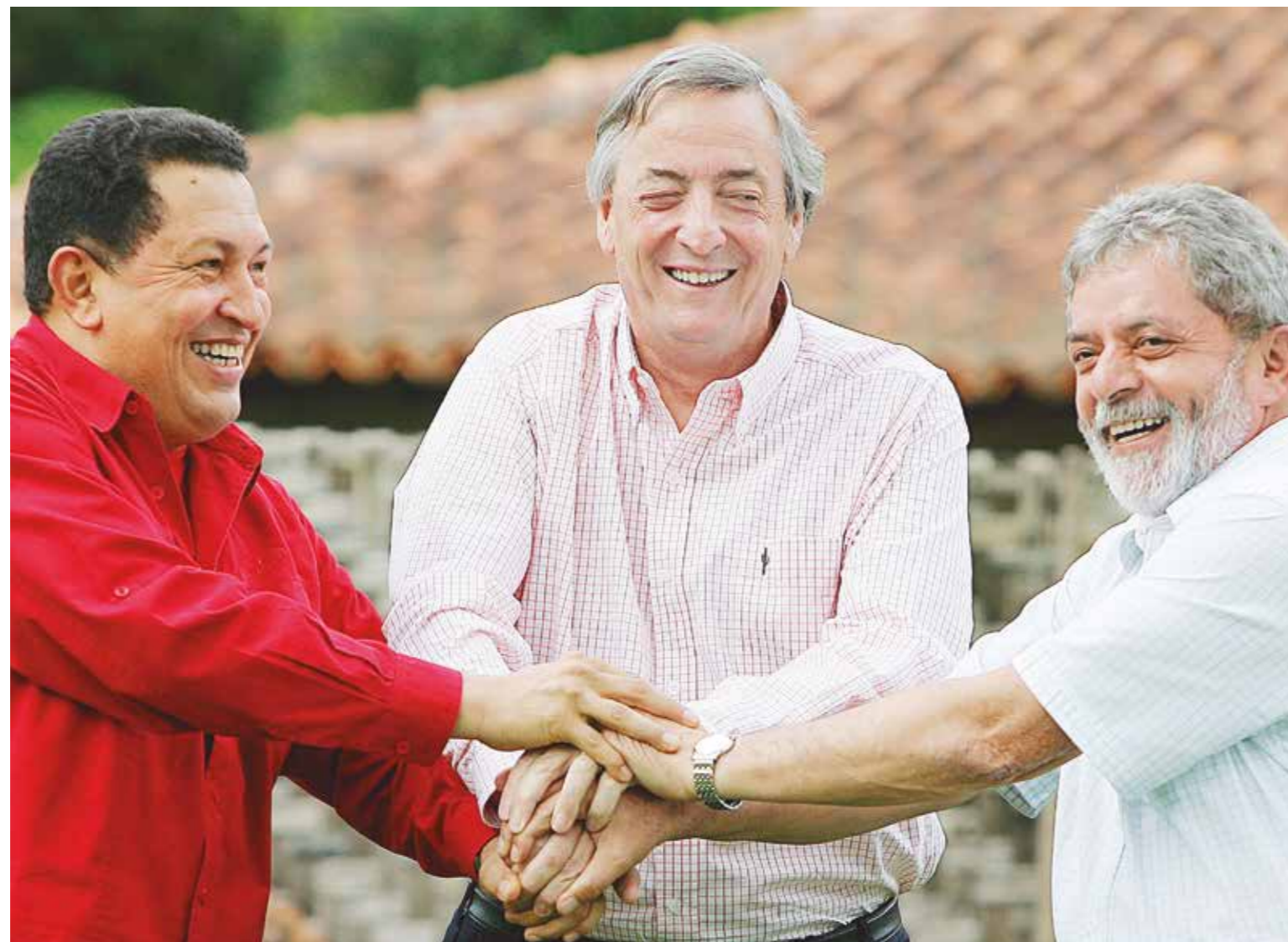
Con el impulso del huracán bolivariano surgieron líderes y gobiernos antiimperialistas que enterraron al ALCA

En la II Cumbre de las Américas, celebrada en Santiago de Chile, en abril de 1988, la agenda estuvo marcada por los avances de cada país para amoldar sus economías al Área de Libre Comercio. Parecía no existir ninguna alternativa, las naciones latinoamericanas estaban condenadas a colocar su producción y recursos al servicio de las trasnacionales estadounidenses.