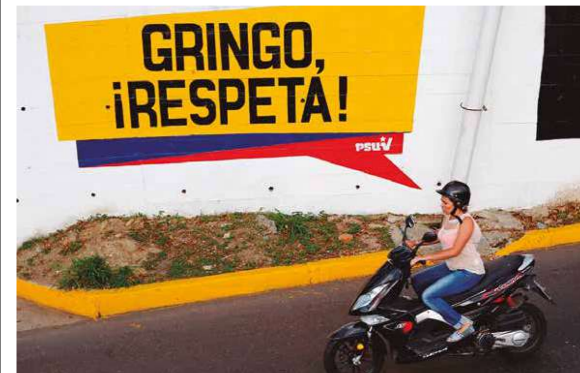
Estamos en un tiempo de deficiones sobre cuál de las dos Américas será la próxima protagonista de la historia.

Existen los que miran hacia fuera y los que lo hacen hacia dentro para pensar en América Latina