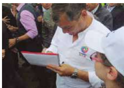
Presidente de Ecuador, Rafael Correa