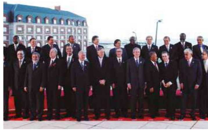
IV Cumbre de las Américas, Mar del Plata, Argentina, 2005

Además de los gobiernos progresistas que acuden, más de 2 mil representantes de los movimientos sociales estarán en paralelo en la Cumbre de los Pueblos, y se encargarán de recordarle al imperialismo, que no estamos dispuestos a retroceder porque no tenemos elección. Es la vida, la felicidad y la Paz que defendemos con Bolívar y Chávez al frente, o es la barbarie, la guerra y la explotación capitalista que nos ofrece el Norte. •