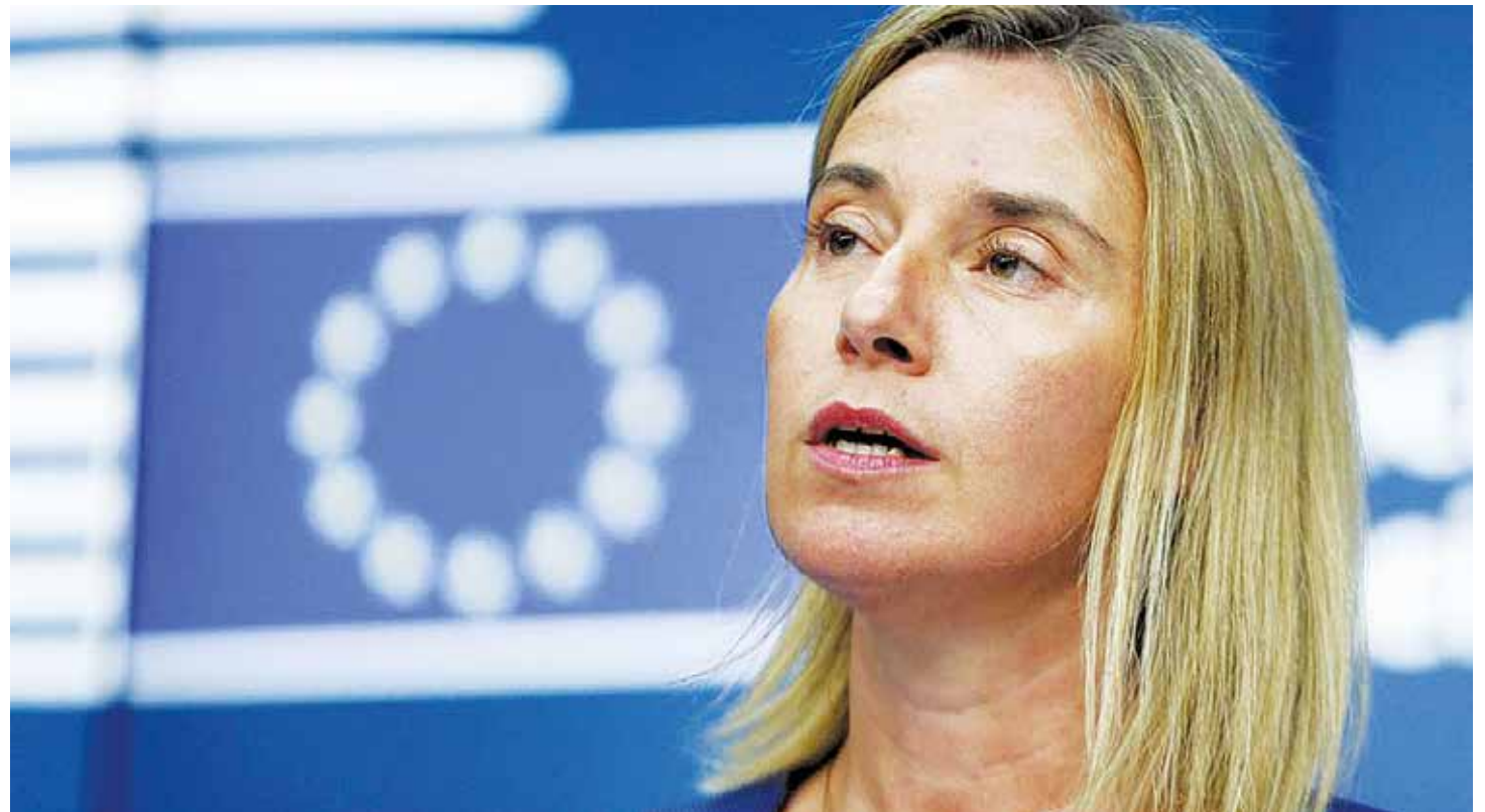
La jefa de la UE tiene una cruzada contra la Revolución Bolivariana.

Pero, en Venezuela, desde el 8 de octubre partidos y organizaciones políticas que promuevan el odio y el fascismo, serán inhabilitados. Y, en