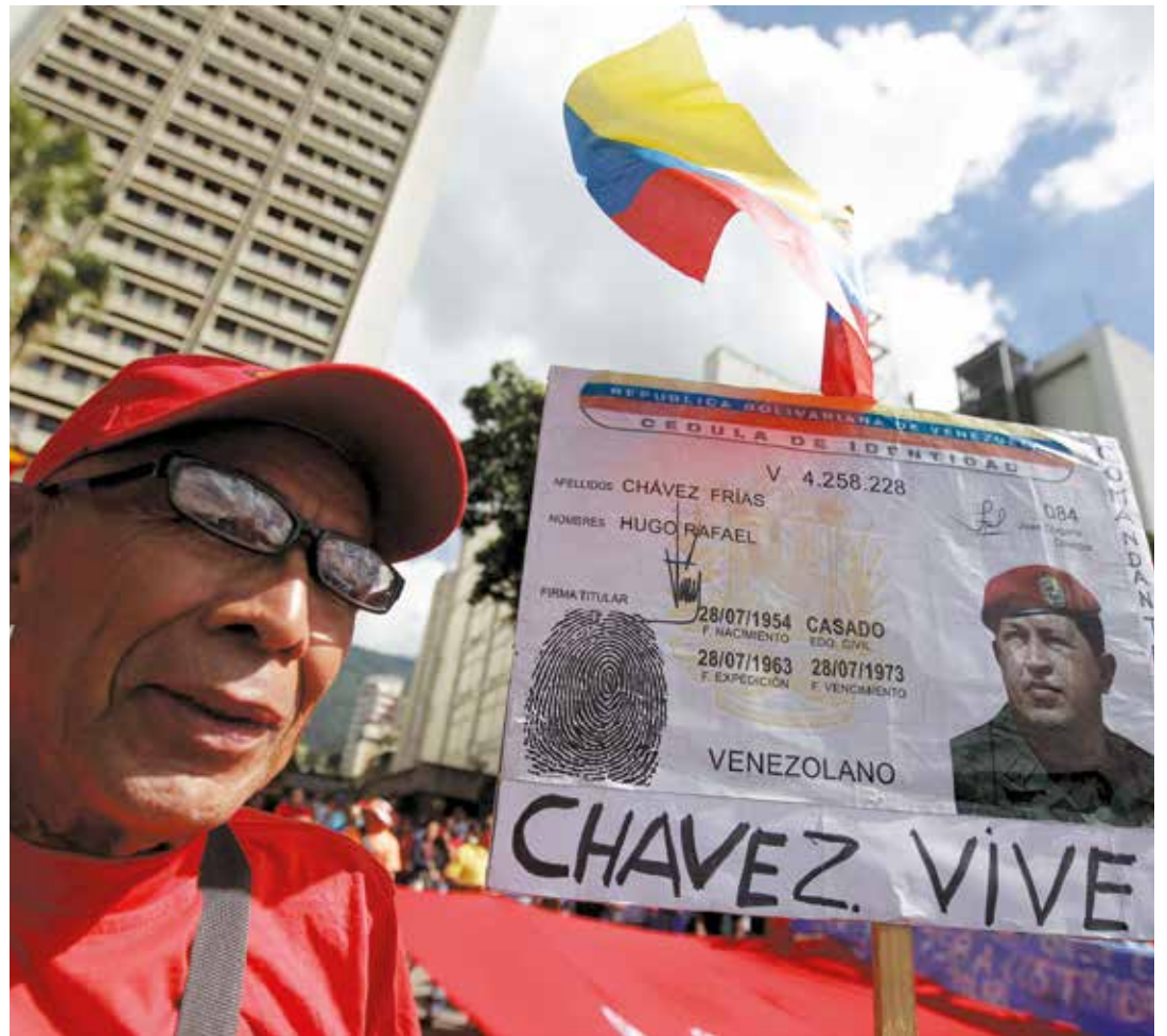
Las fuerzas chavistas están organizadas en las calles para garantizar el triunfo electoral.

El 13 de noviembre se realizó la reunión entre la Comisión del Gobierno Bolivariano y los tenedores de bonos para negociar la reestructuración de la deuda, la Unión Europea anuncia que posiblemente imponga sanciones a Venezuela