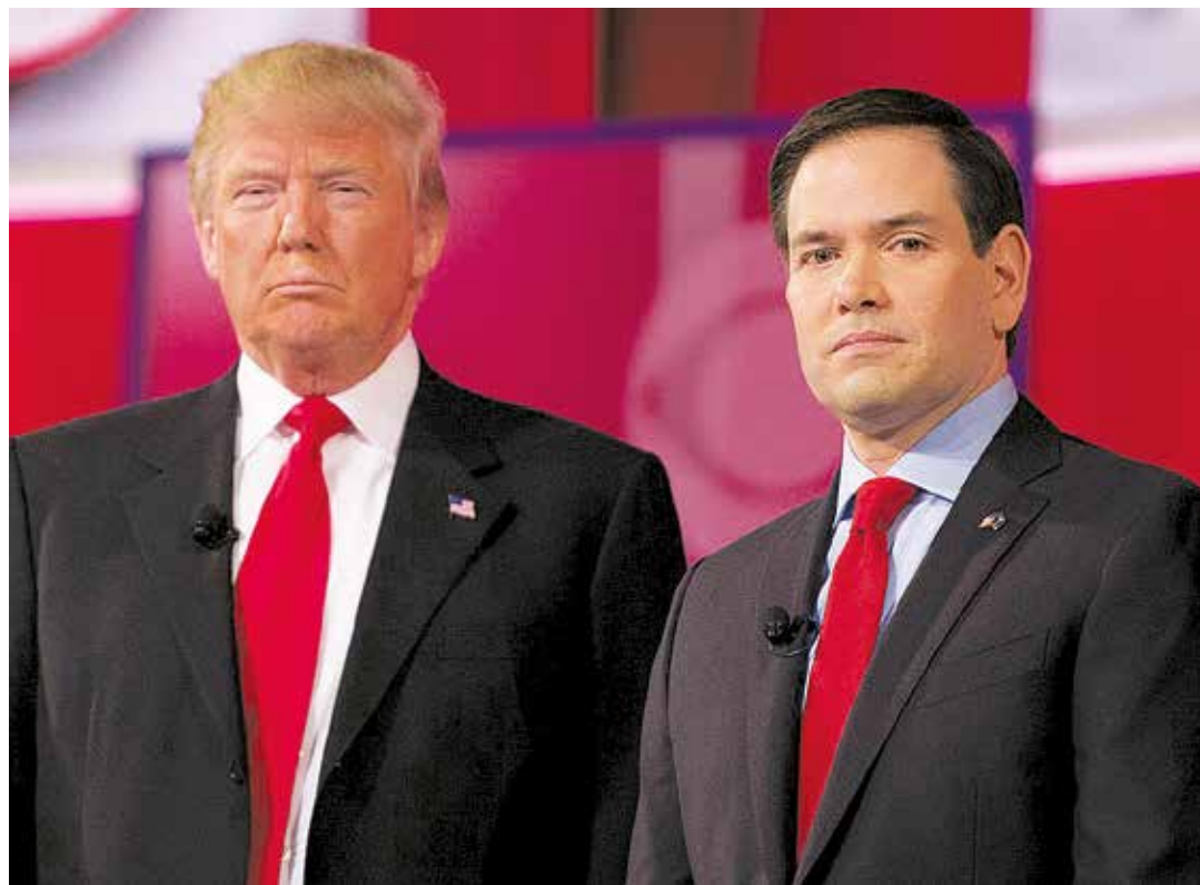
Trump y Rubio desmantelan las medidas distensivas Obama.

De la misma manera que Trump se desliga del acuerdo con Irán aunque este lo cumpla escrupulosamente, el Departamento de Estado ex-