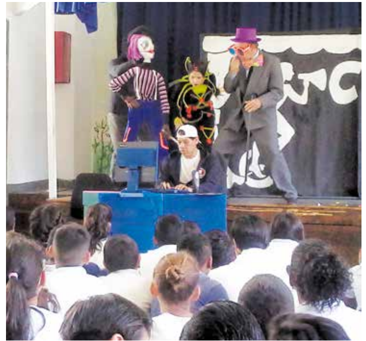
Teatro para tomar conciencia.

Precisamente de eso le hablamos a las y los cursantes