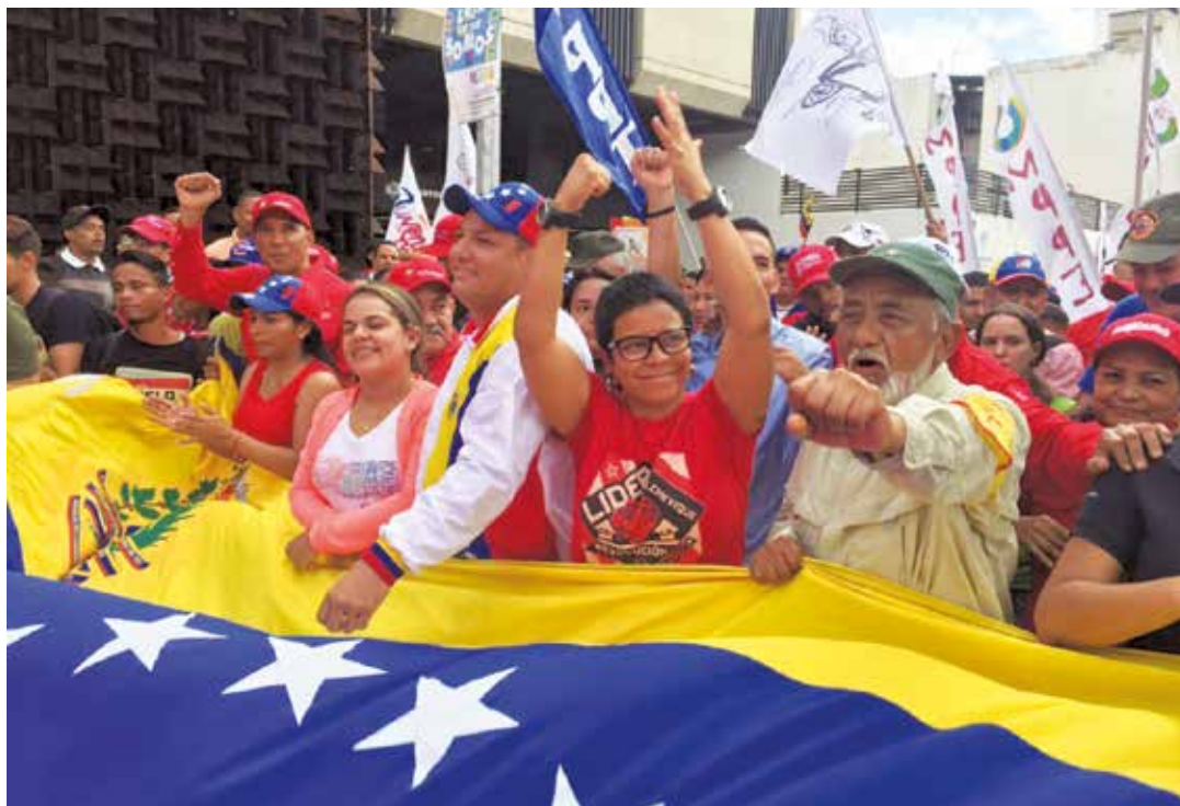
Todos a respaldar a la candidata.

Del mismo modo, a comienzos del siglo XIX, Caracas fue pionera en la lucha anticolonial suramericana. Fue acá donde se inició en 1810 la epopeya de la independencia hispanoamericana. En efecto, el 19 de abril de ese año fue un acto de soberanía y resistencia, primero contra el ejército francés que invadió España en 1808 y, simultáneamente, un primer paso hacia la independencia continental del imperio español. El hecho tuvo resonancia en el mundo entero. En Londres los periódicos anunciaron que “los habitantes de Caracas se han declarado independientes a consecuencia de la disolución de la Junta Suprema y de la entrada de los franceses a Sevilla”. De modo que podemos afirmar que a inicios del siglo XIX Caracas fue el epicentro