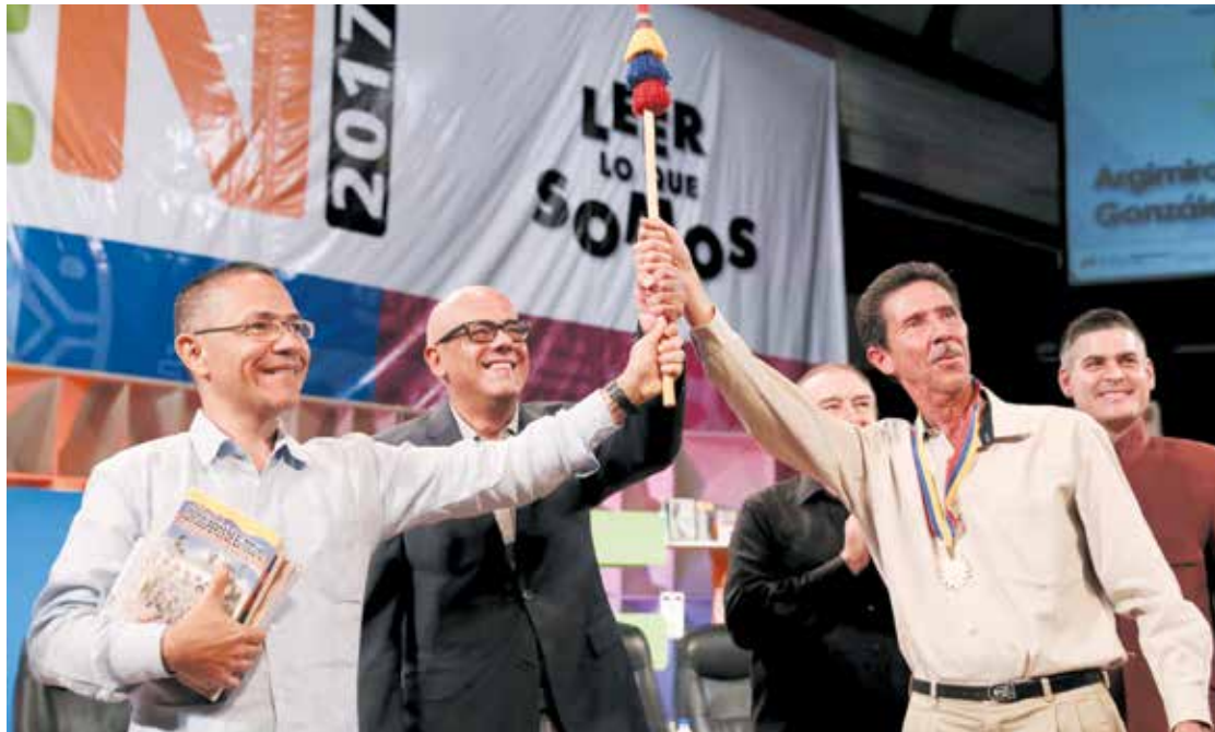
Se inaugura la feria.

El libro como el instrumento para pensar y construir un mundo mejor