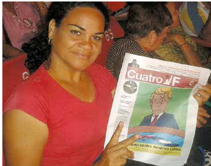
Creando conciencia.

¡Feliz cumpleaños Cuatro F! ¡Que cumplas muchos más!... •