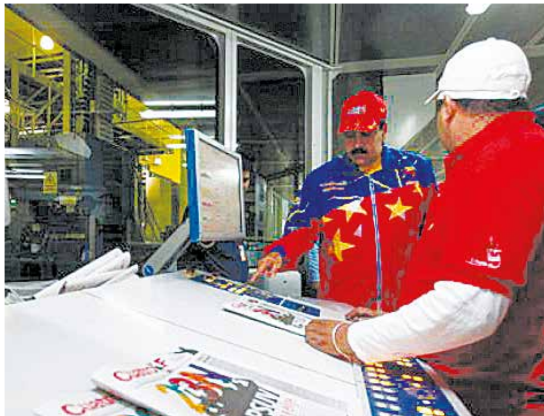
Presidente Maduro en el Complejo Editorial Alfredo Maneiro.

papel, el presidente dijo “acabamos de imprimir los primeros números de este periódico que hará historia en la construcción de la libertad, de la democracia, independencia y del socialismo venezolano. Hay una gran emoción porque estamos cumpliendo con el legado de libertad de pensamiento, de expresión, construcción de la conciencia crítica, socialista y revolucionaria de nuestro pueblo (...) Ahora el periódico de la Revolución se va a recorrer la Patria”, por lo que llamó a todas la UBCH, a los CLP, al pueblo, a convertirse en pregoneros y pregoneras. Pidió que fuese llevado casa por casa, para que se convirtiera en un gran instrumento de organización social.