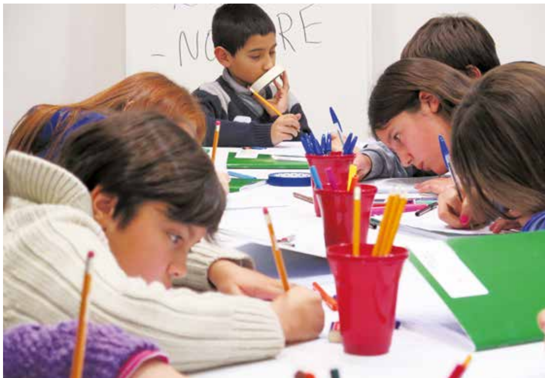
Los libros ayudan a entender el mundo.

ejemplo de cómo constituir el gobierno apropiado a las naciones hispanoamericanas”.