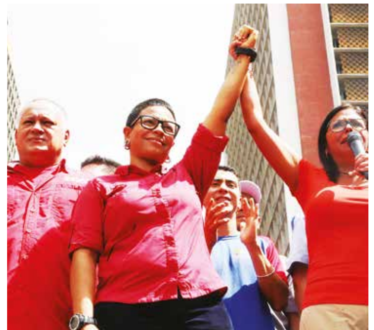
La candidata se desplegará por todas las parroquias.

“Hemos visto todo el trabajo que el pueblo de Caracas hace para que los CLAP cumplan con la tarea que nos instruyó el Presidente, Maduro. Nos he-