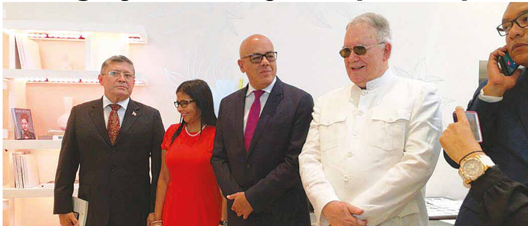
Con las conversaciones se busca frenar la guerra económica.