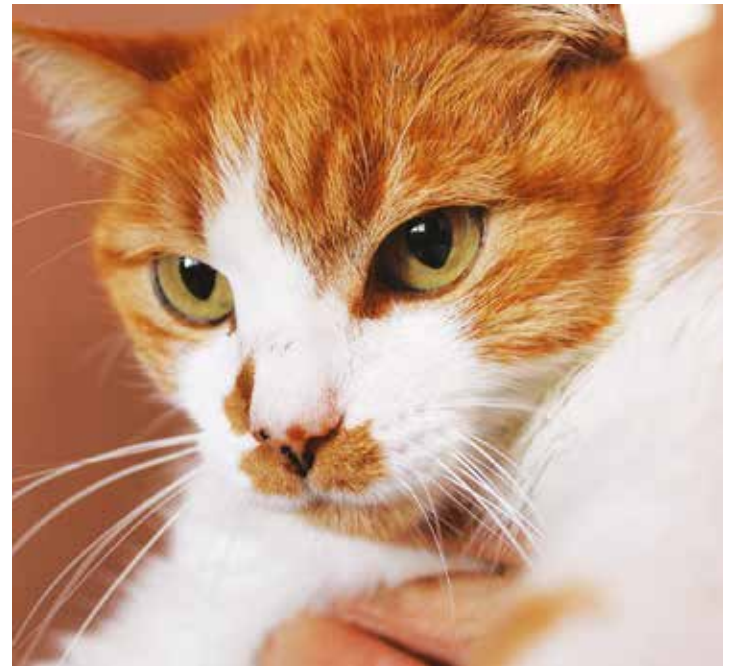
El crimen de Kitty sigue impune.

Ante estas sanciones es necesario construir propuestas donde la vida de un ser vivo, sea respetada y que los castigos estén en concordancia con el daño causado al animal.