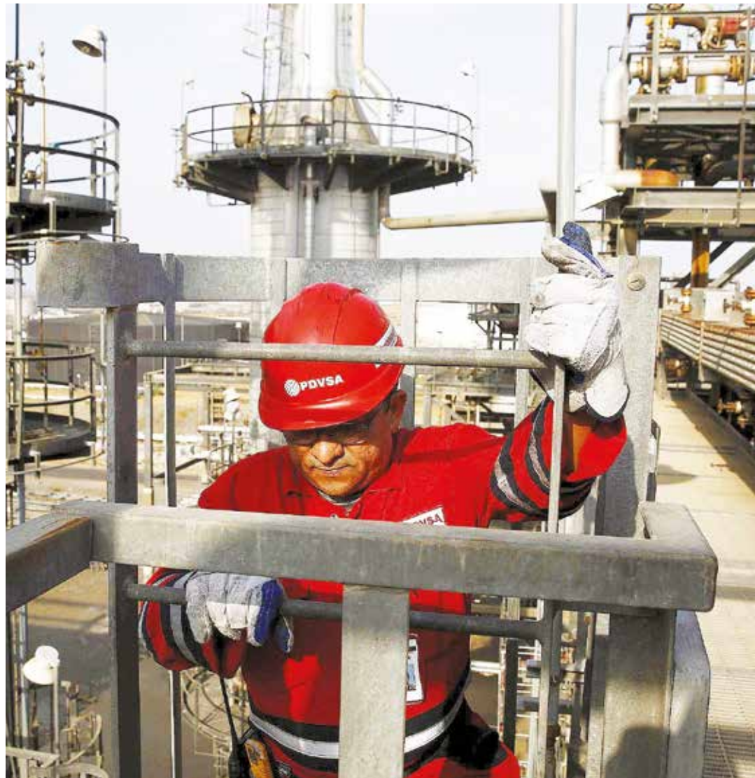
El alza en los precios del crudo fortalece posición de Venezuela.