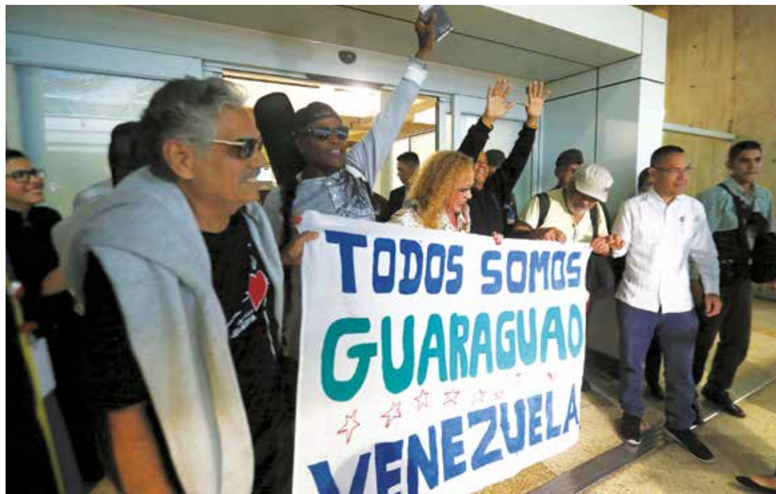
Siguen produciendo miedo en la oligarquía

El único delito fue llevar un cuatro, una guitarra, llevar un canto, llevar una verdad a través del canto