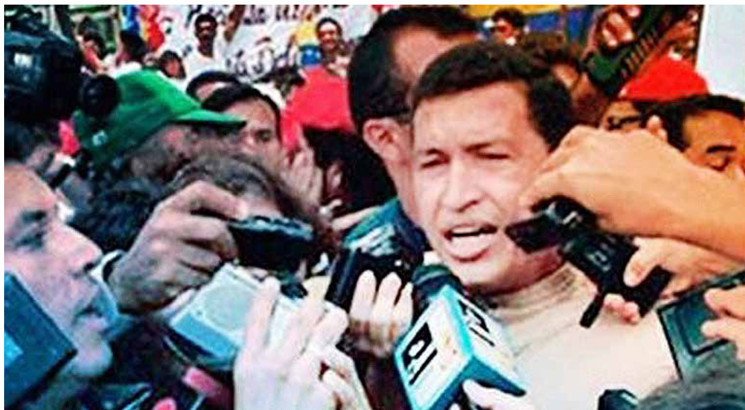
Adán Chávez Frias

I Las bolivarianas y los bolivarianos de estos tiempos damos la bienvenida al mes de junio; mes de conmemoración del Bicentenario de la gloriosa Batalla de Carabobo y, por tanto, de reafirmación de nuestros más profundos sentimientos patrióticos, como siempre lo hizo el Comandante Hugo Chávez, desde la génesis misma de la Revolución Bolivariana; tal y como lo hemos analizado en anteriores entregas de este seriado, al cual damos continuidad el día de hoy.