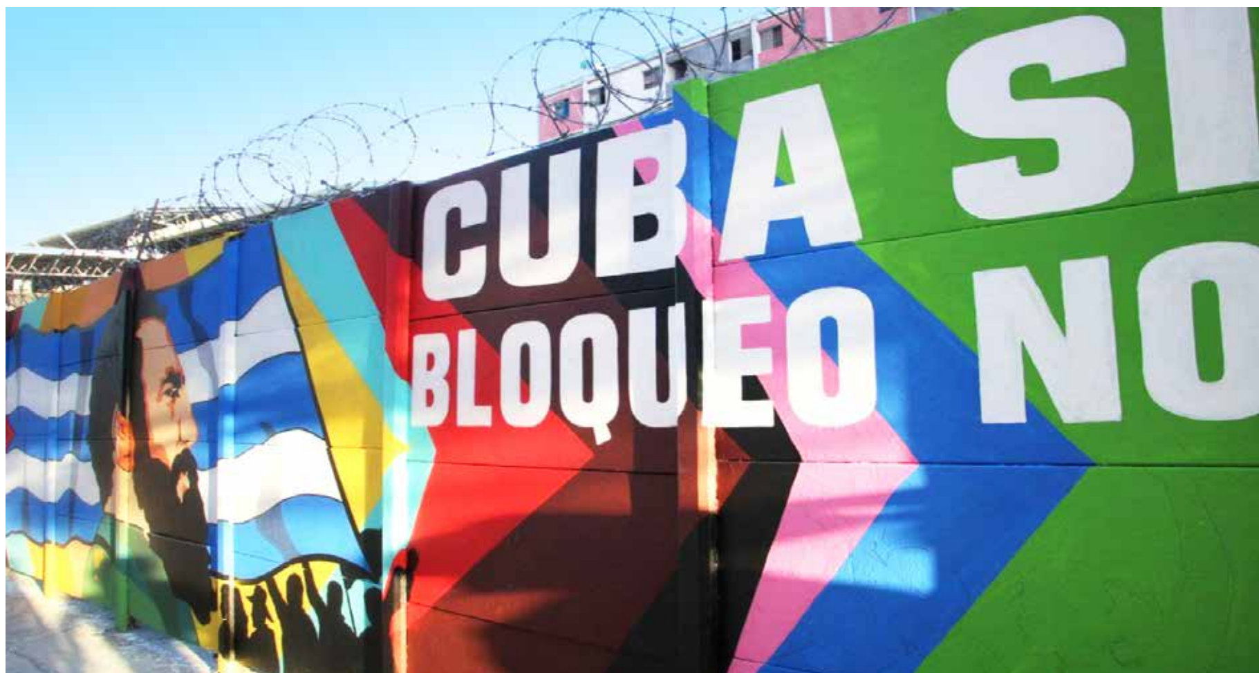
Mural del FFM. Jornada Revoluciones en Solidaridad con Cuba. Av. Lecuna, Caracas. Venezuela