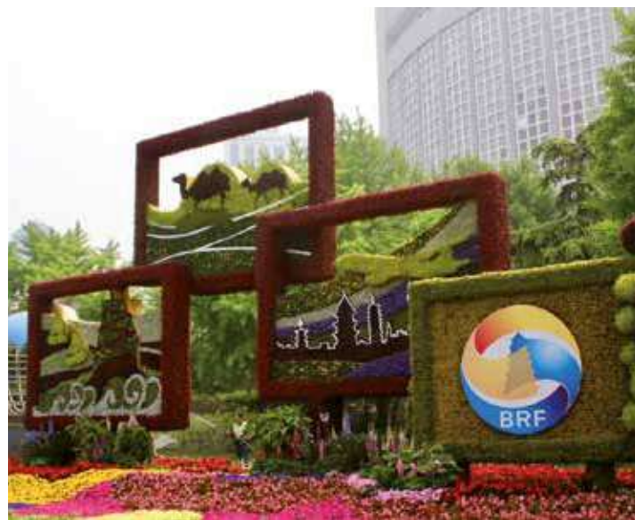
En la actualidad 19 Estados del subcontinente se han vinculado a la iniciativa china de la Franja y Ruta de la Seda.

Por Yolaidy Martínez Corresponsal /Beijing