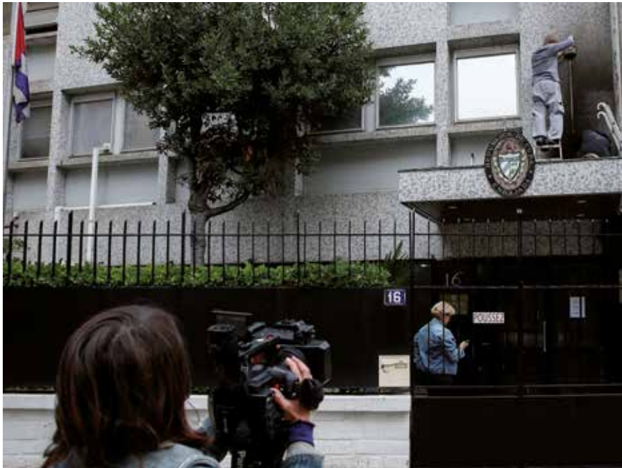
El asedio a las sedes diplomáticas y la proliferación de falsas noticias forman parte de las campañas agresivas contra el pueblo cubano.