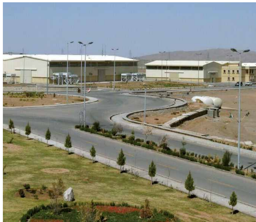
Autoridades israelíes han confesado su colaboración con la CIA para obstaculizar el programa pacífico de desarrollo nuclear iraní.

Cuando el jefe del Mossad lo revela, destruye la reputación de que tal entidad es una de las mejores del mundo y, en realidad, constituye solo una pandilla que actúa como una organización criminal subcontratada, subrayó Melman.