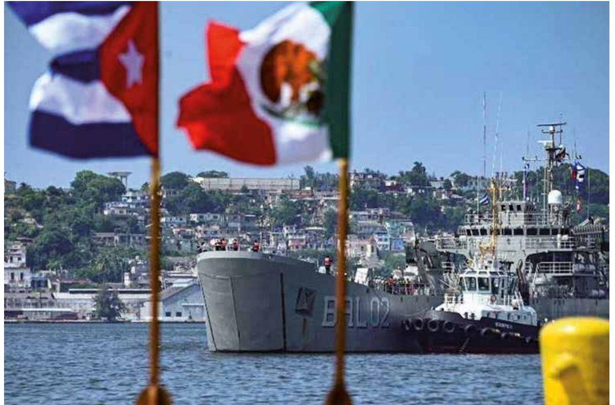
Por vía marítima y aérea está llegando a la mayor de las Antillas la ayuda para hacer frente al bloqueo incrementado y a la intensificación de la pandemia.

La guerra mediática en el exterior -bien divorciada de la realidad en toda Cuba- se incrementa peligrosamente con intensas gestiones para sumar a Europa y otras agrupaciones regionales en la sucia cruzada, que