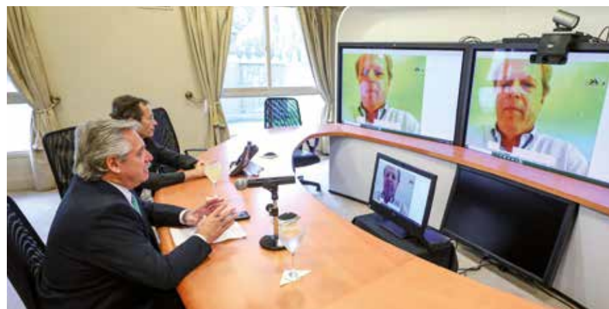
El presidente Alberto Fernández intervino en el foro virtual.

Asimismo, elevó la propuesta de un Modelo Solidario de Desarrollo "que contribuya a reducir la desigualdad social en todas sus asimetrías".