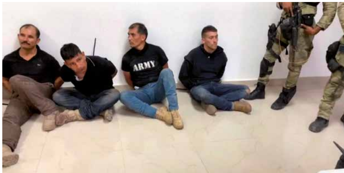
La presencia de mercenarios en la Operación Gedeón contra Venezuela y en el magnicidio de Haití denuncia a las autoridades colombianas.

Asimismo, un reportaje publicado por el diario local El País , en 2015, advirtió que hace décadas centenares de militares colombianos son contratados por compañías privadas, a su vez concertadas por el Gobierno estadounidense para organizar grupos de mercenarios, quienes prestan servicios de seguridad a funcionarios, bases militares, consulados, o cualquier lugar donde ondee la bandera norteamericana, añadió la publicación.