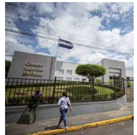
El Consejo Supremo Electoral confirmó la masiva respuesta popular.

Unos 4,7 millones de nicaragüenses están convocados a las urnas el primer domingo de noviembre, tal como establece la Constitución Política, para elegir la fórmula presidencial, 92 diputados a la Asamblea Nacional (legislativo unicameral) y 20 al Parlamento Centroamericano.