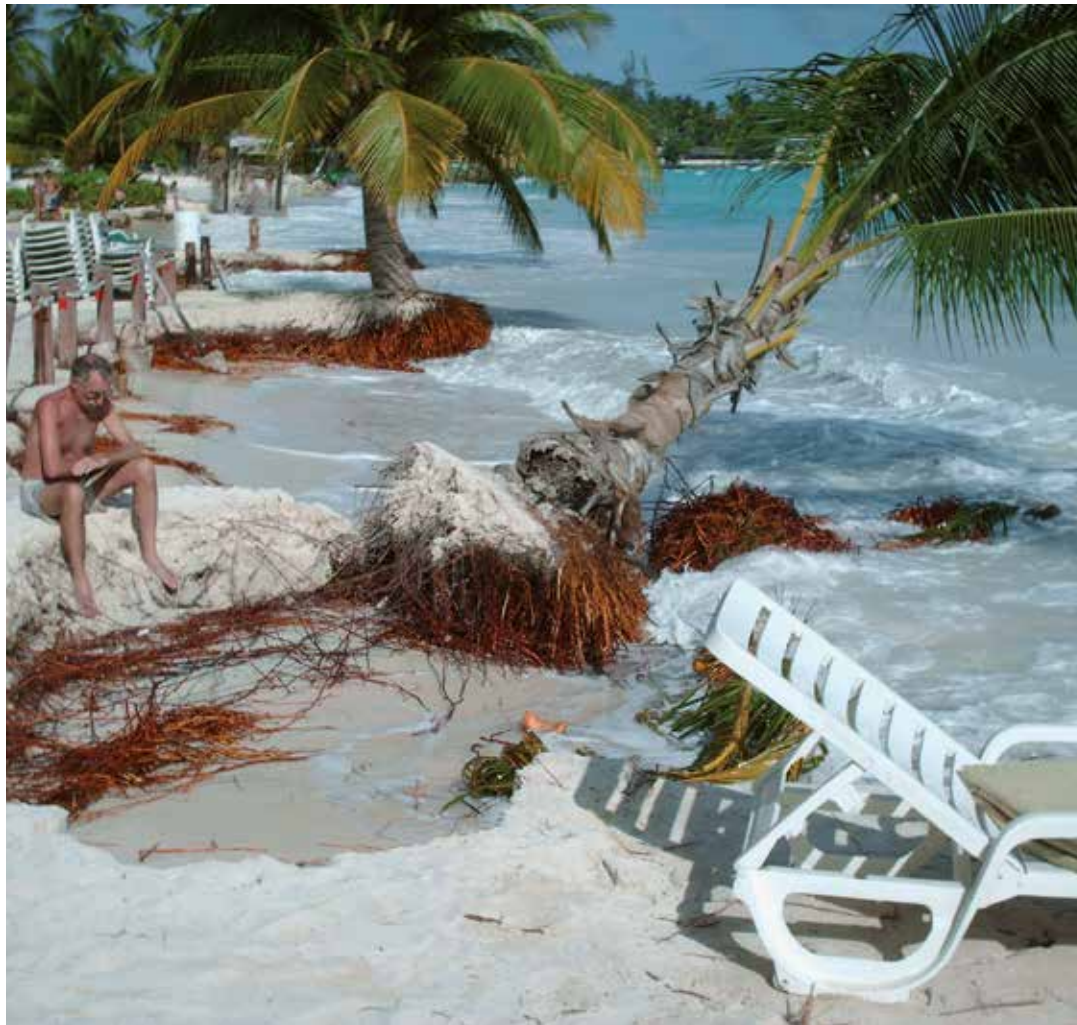
El crecimiento del nivel del mar amenaza a más del 27 por ciento de las poblaciones de Latinoamérica y el Caribe.

El nivel del mar crece en estos momentos por encima del promedio mundial en