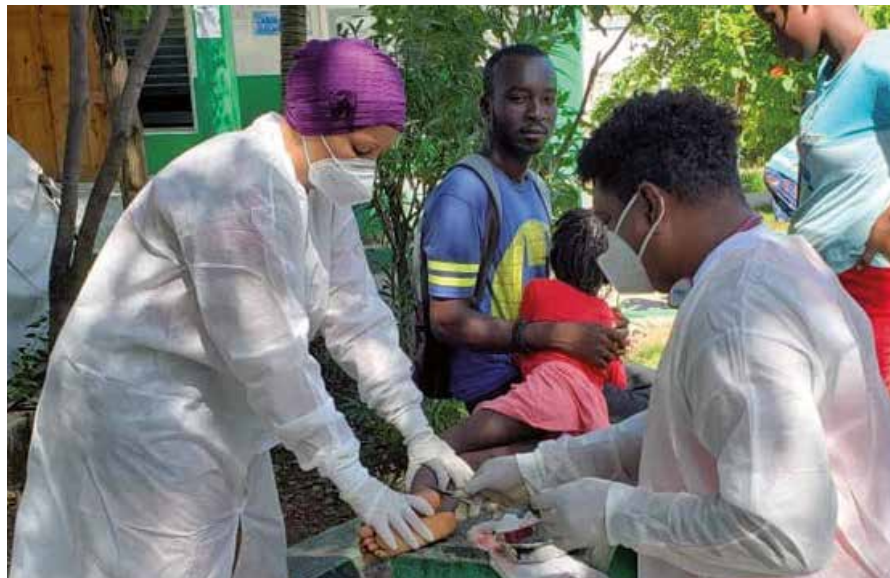
Los colaboradores cubanos de la salud prosiguen sus labores en campaña y en instalaciones sanitarias que resistieron las sacudidas.

"Necesitamos financiamiento de inmediato", manifestó el subdirector de Asuntos Humanitarios de la ONU,