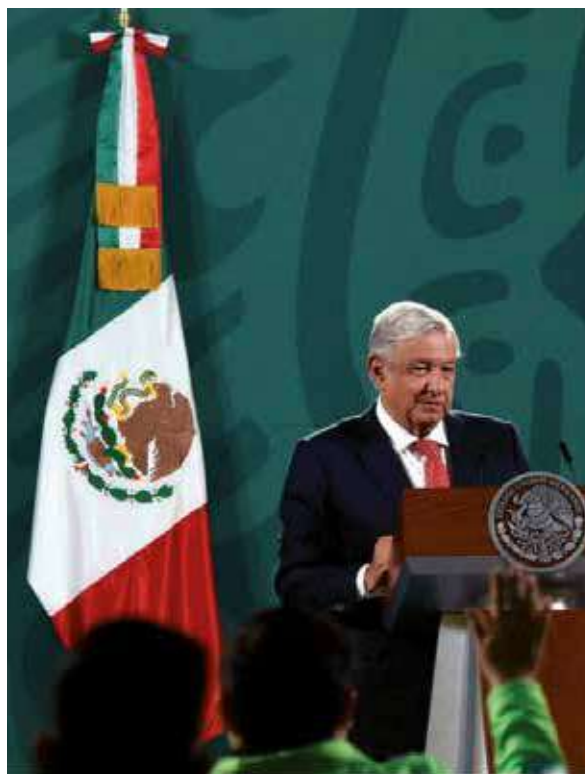
El presidente López Obrador encabeza la propuesta de sustituir la entidad intervencionista.

Por cierto, no es un punto de vista nuevo ni exclusivo. El primero en advertir el carácter mercenario de la OEA al servicio de Estados Unidos fue Cuba, cuyo Canciller de la Dignidad, Raúl Roa, la nombró "ministerio de colonias yanqui", como se le sigue conociendo.