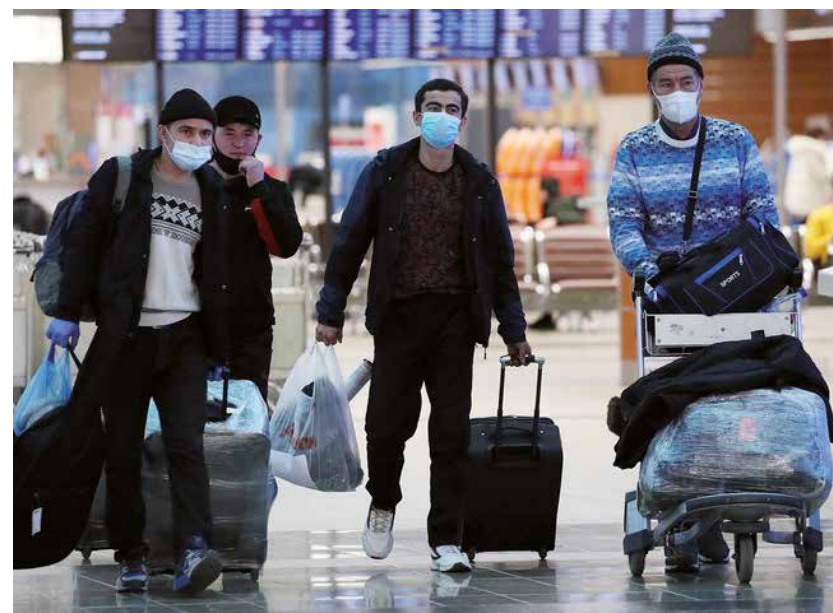
Los mayores migrantes provienen de los países que antes conformaban el conglomerado de la Unión Soviética.

Aclaró que hasta el momento el Estado no toma medidas para reducir el número de inmigrantes.