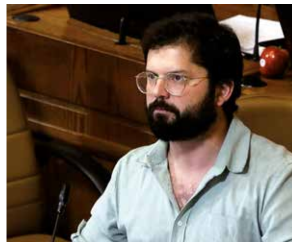
Gabriel Boric, por el bloque Apruebo Dignidad, entre los más sólidos candidatos.

En contra de Sichel y de Provoste también pesan, auguran los entendidos, representar a las fuerzas que se alternaron en el poder durante los