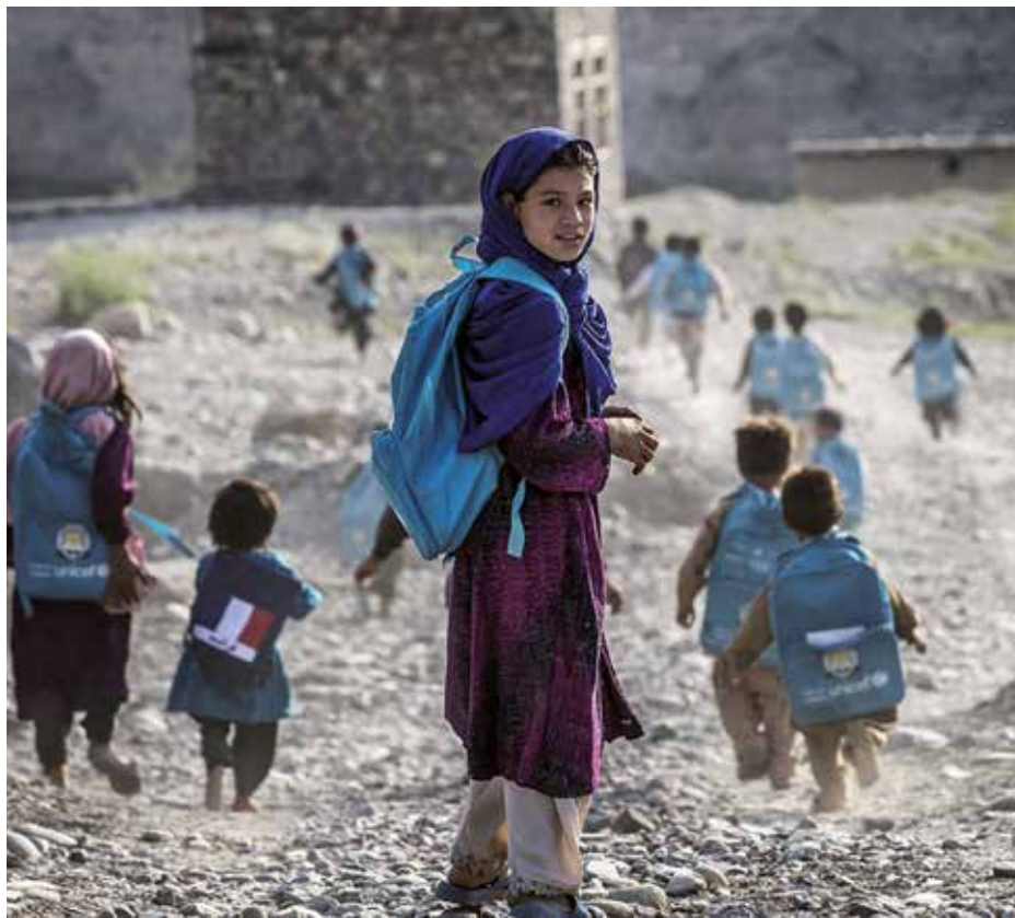
Millones de niños y adultos afganos requieren la solidaridad internacional, según advirtió la ONU.