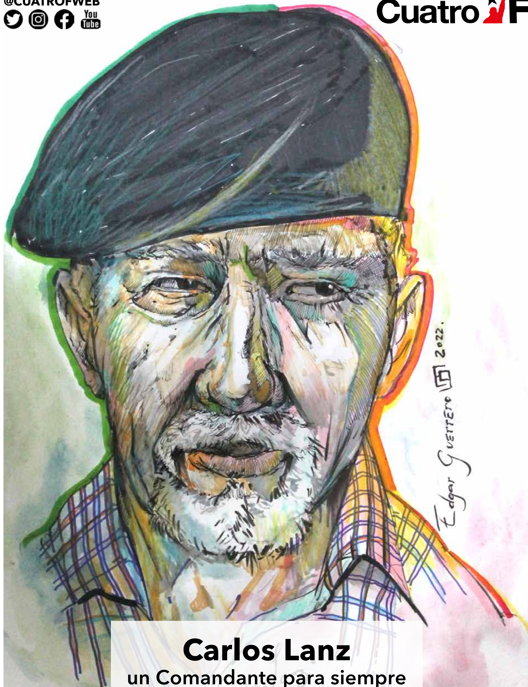
Carlos Lanz un Comandante para siempre