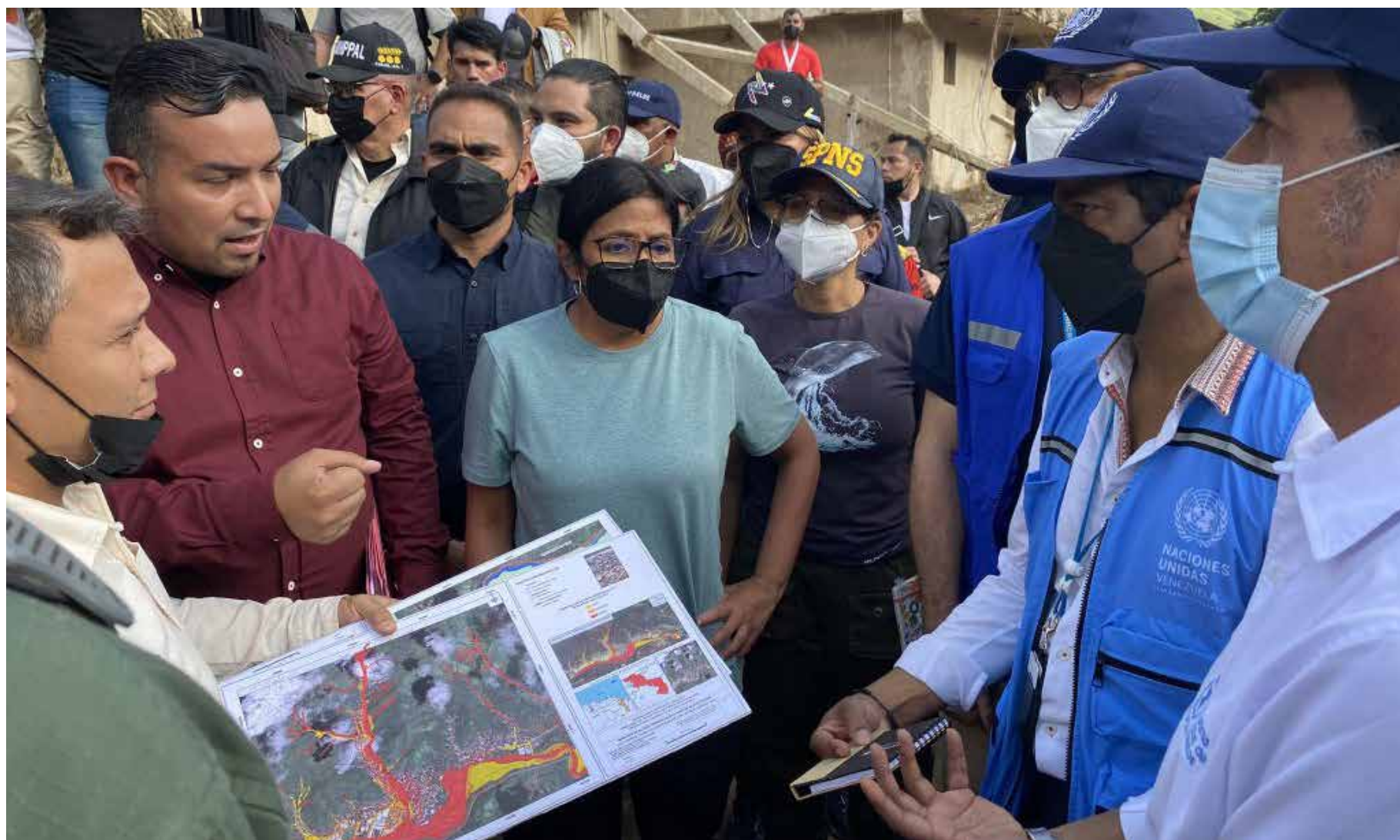
Venezuela y ONU coordinan cooperación humanitaria para afectados de Las Tejerías. En la gráfica Vicepresidenta Rodríguez y sistema de ONU constatan atención en las zonas afectadas.