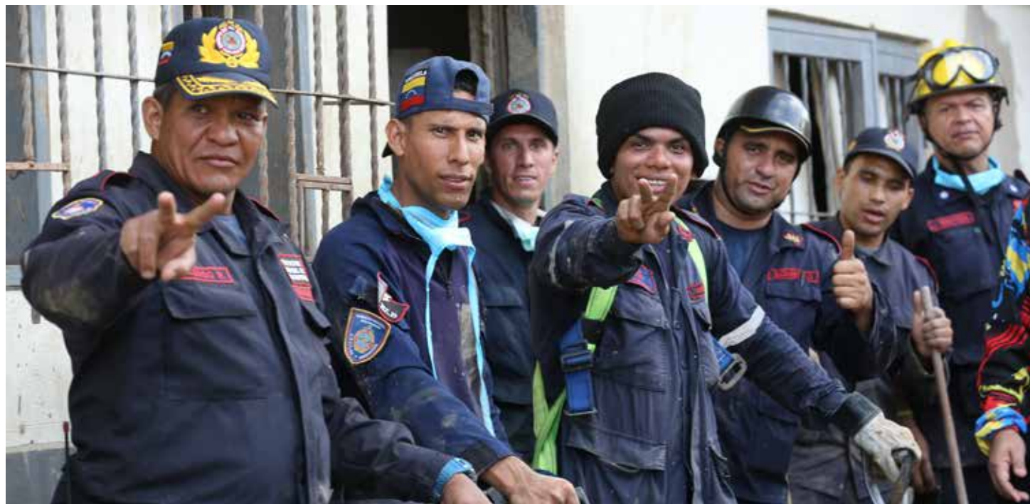
Venezuela felicita labor de cuerpos rescatistas en Las Tejerías

La dictadura mundial ha demostrado poca voluntad para proteger a la Madre Tierra, hoy más que nunca está vigente el llamado "No cambiemos el clima ¡Cambiemos el sistema!"