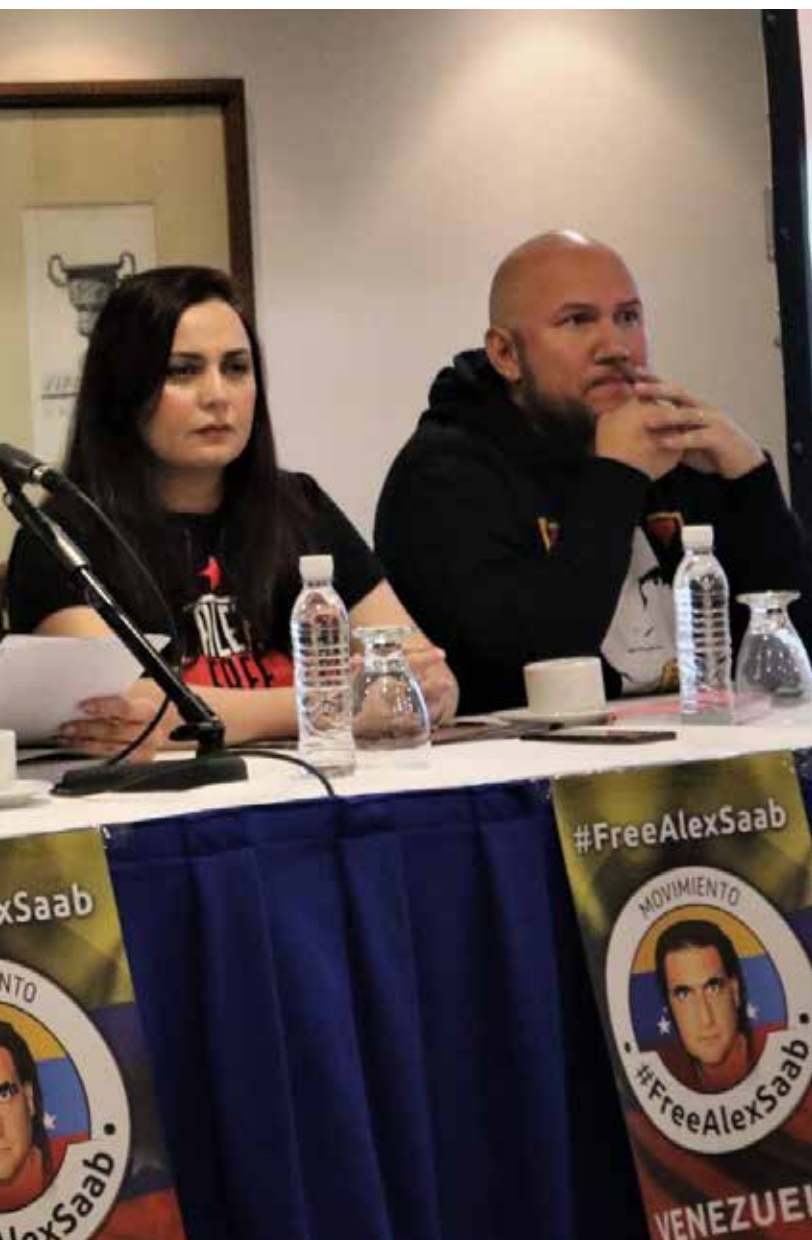
Intercambio entre el diplomático deportado y algunos

do por segunda vez, el 16 de octubre de 2021 y desde ese momento hasta la actualidad no ha recibido ningún tipo de atención médica según las enfermedades de base que se habían reportado, haciendo caso omiso al llamado de los relatores de la ONU.