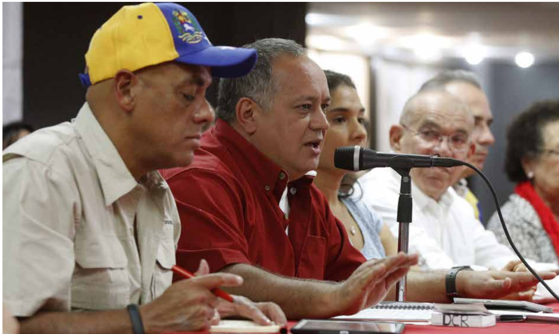
Diosdado Cabello alertó sobre planes de saboteo.