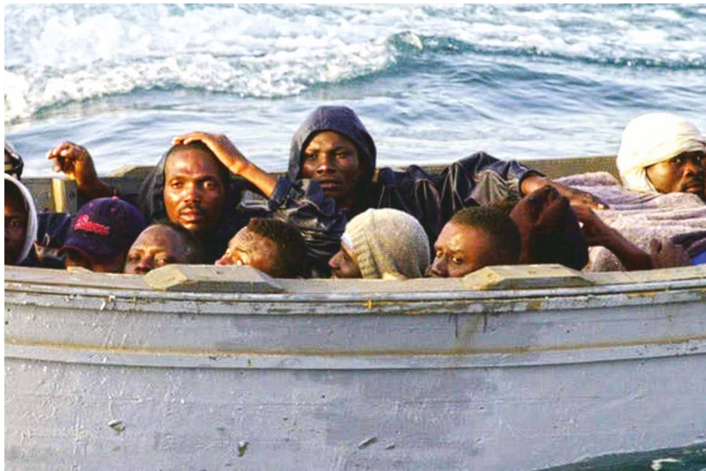
En las fronteras marítimas que separan a Europa de África ocurre una gran crisis humanitaria.

La criminalización de los flujos migratorios y el rechazo de los inmigrantes en general, son las máximas de la política migratoria en la Unión Europea. Resulta escandaloso que los esfuerzos para mitigar esta situación sólo tienen un enfoque policial y de control que se materializan a través de la Agencia Europea para la Gestión de la Cooperación Operativa en las Fronteras Exteriores (Frontex), la cual recibe un presupuesto millonario destinado al equipamiento de fuerzas armadas y equipos de patrullaje fronterizo. En analogía con el muro que separa