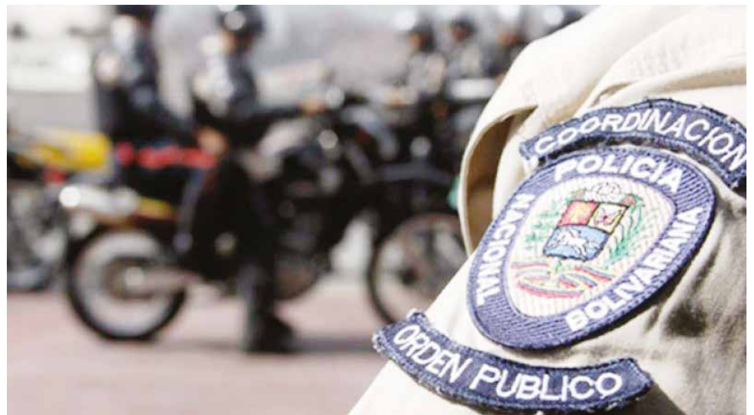
La repentina ola de asesinatos de policías oculta tras de sí, un móvil político. FOTO ARCHIVO

Un elemento no menos grave a considerar, es que en las reseñas periodísticas de estos medios derechistas se deja co-