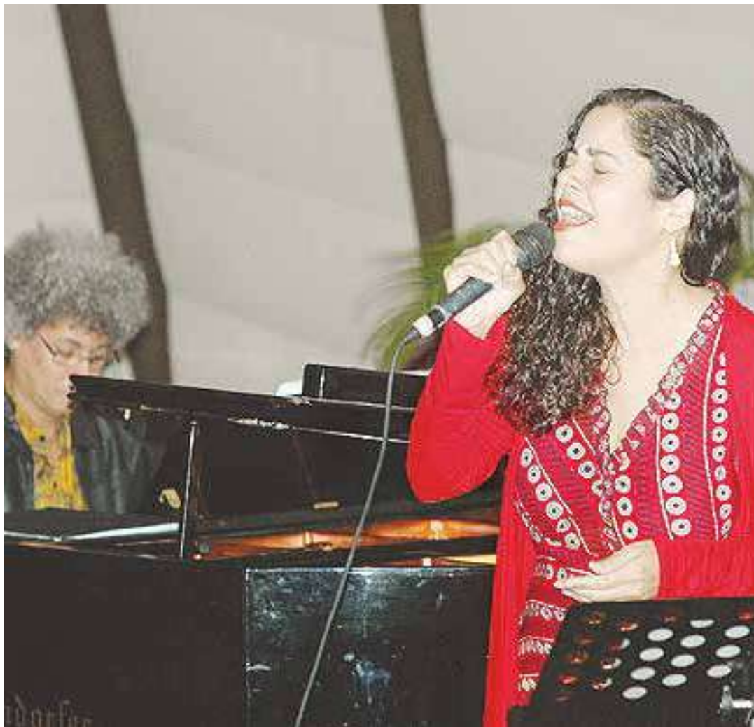
La gente sigue cantando mucho, sigue llevando su serenata.

ocurre por lo general en el entorno familiar: un padre, una madre, que tiene una buena discografía bolerística. ¿Es este el espacio de socialización con el bolero primario para ti?