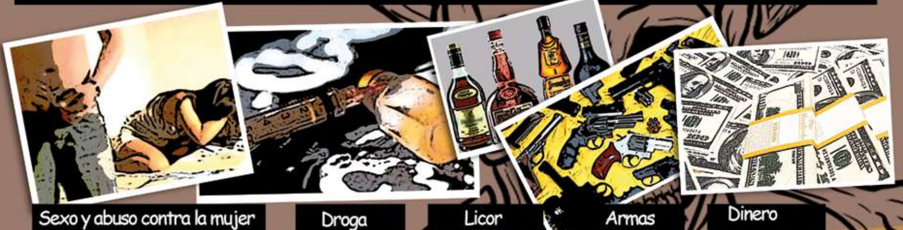
Sexo y abuso contra la mujer

En esas francachelas rodó el vicio y el derrape.