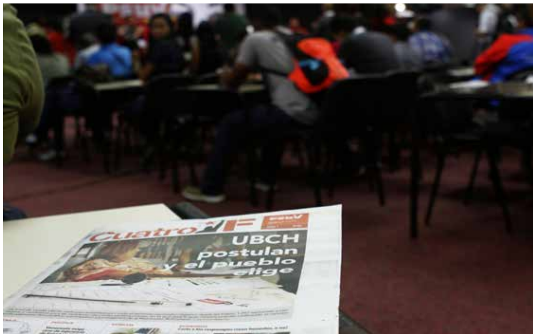
Exitosa jornada de postulación.

mayor de 30 años y una en edad comprendida entre 21 a 30 años) y dos hombres (uno mayor de 30 años y otro entre 21 a 30 años de edad), en cumplimiento con la paridad de candidatas solicitada por el presidente del partido, Nicolás Maduro.