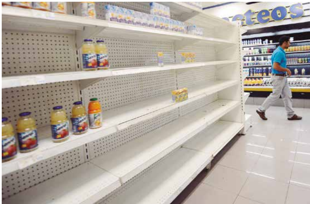
La oligarquía prefiere no producir en su objetivo de derrocar el gobierno.

“ Fedecamáras, Fedegro, Fedenaga y todos sus monstruosos tentáculos, llevan a cabo un paro no declarado. Hay quienes aseguran que prefieren no producir para tumbar al gobierno”