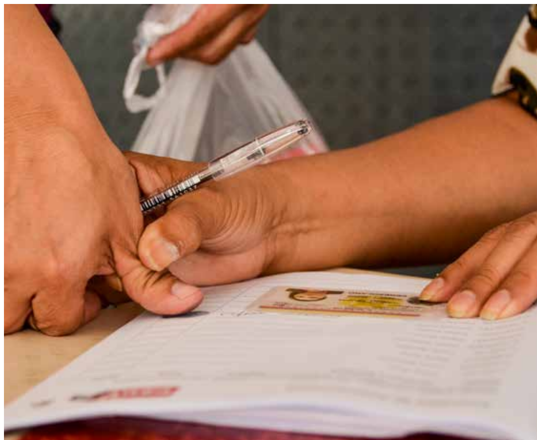
La jornada demostró el ejercicio democrático y protagónico por el pueblo revolucionario y chavista.

MUD elige a dedo candidatos a diputados y cobra 150 mil bolívares para postularse