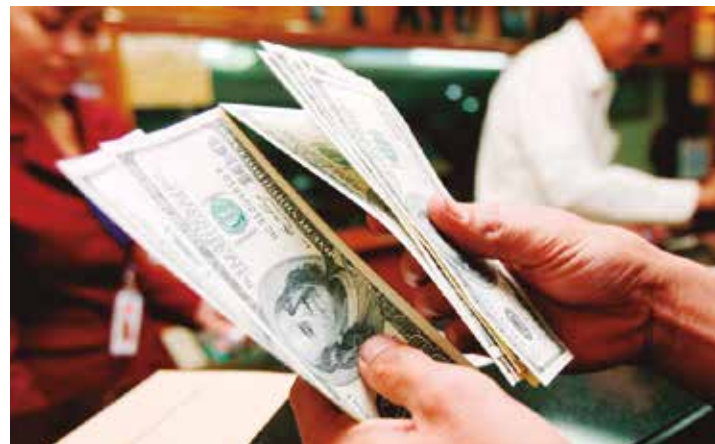
Hay que acabar con el aparato mafioso de captación de la renta.

Maduro en las encrucijadas Nicolás Maduro le tendió la mano a todo lo más "sobresaliente" de la burguesía vene-