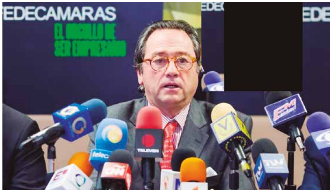
Fedecámaras amenazó con profundizar la escasez.

La guerra económica que inició estando el barril de petróleo a 100 dólares recrudeció ahora en las condiciones del precio internacional del crudo a 40 dólares. Sobre esta circunstancia de urgencia Maduro ha declarado que hay que seguir actuando empleando otros recursos, otras acciones, para revertir el escenario de desgaste y los estragos que la acción criminal de la burguesía está generando.●