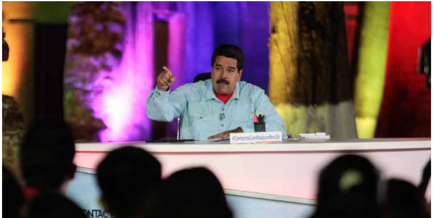
Maduro: Los dólares de la República son del pueblo.