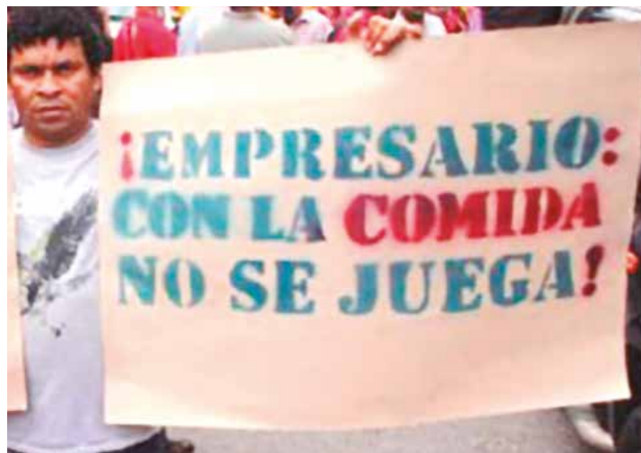
El pueblo se debe sumar al llamado contra la guerra económica.