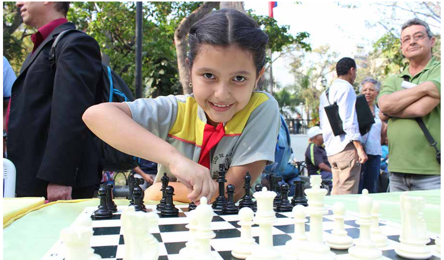
La actividad contó con 200 niñas y niños de las escuelas del Distrito Capital.

En la actividad se toma en cuenta el ajedrez como de-