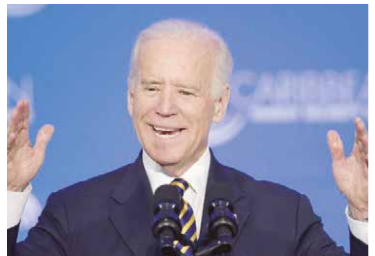
Joe Biden ofreció 20 millones de dólares a los países del Caricom.

Explicó que la estrategia de Obama se enmarcaba en una dinámica global, ya que en el 2014 se había producido un incremento sustancial de las relaciones de América Latina y el Caribe con China, Rusia