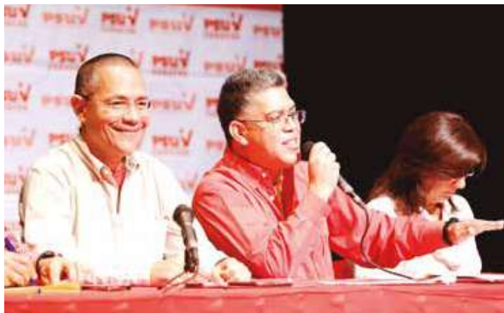
Las UBCh de Caracas, Vargas y Miranda, postularon 195 precandidatos.

Por último, el miembro de la Dirección Nacional del PSUV, Jorge Rodríguez, informó que por órdenes del presidente del PSUV, Nicolás Maduro, desde la militancia se financiará la campaña de todas las candidaturas que van a participar de forma equitativa en la elección del 28 de junio. •