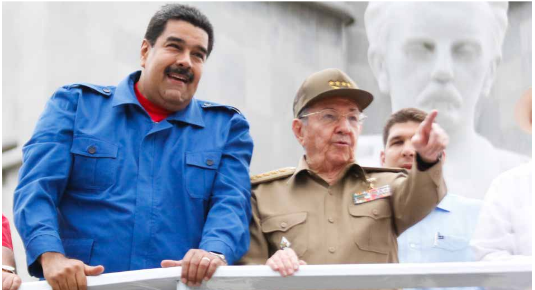
Venezuela y Cuba mantienen una estrecha relación de cooperación y solidaridad mutua.

El hermano pueblo cubano expresó el rechazo a la injerencia externa y las acciones desestabilizadoras