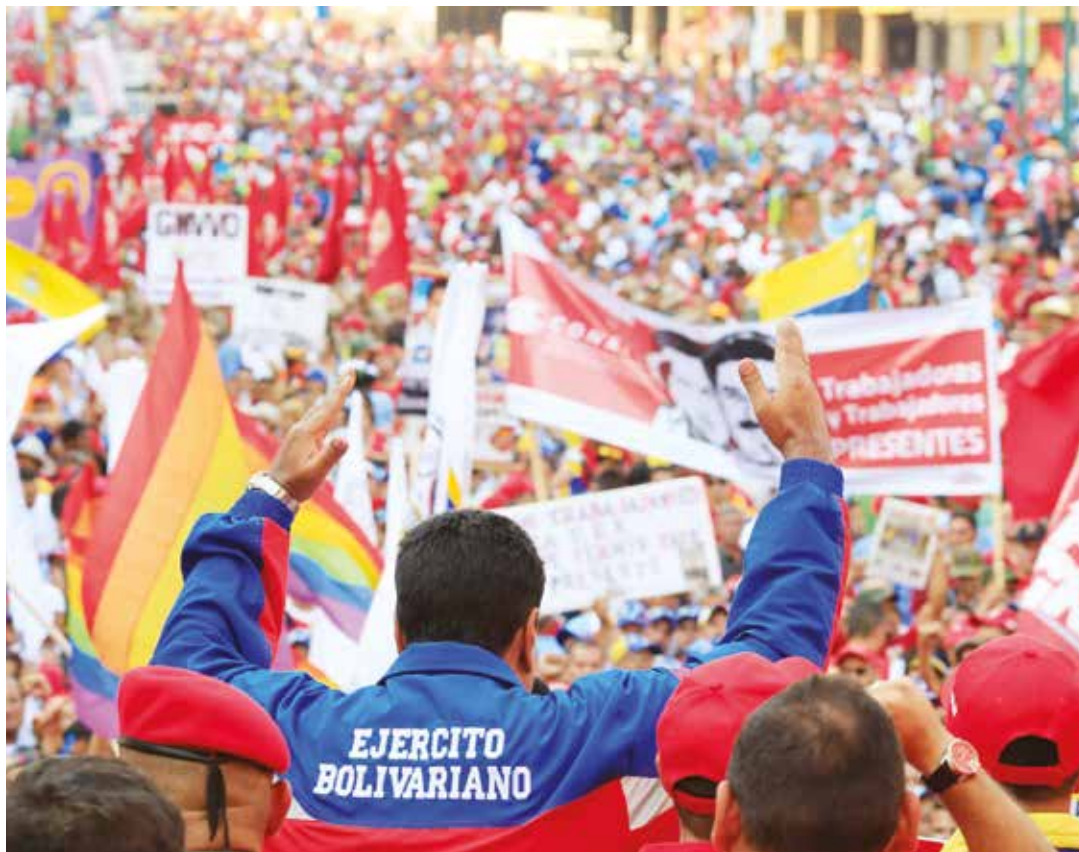
Estamos obligados a concentrar nuestros esfuerzos para vencer la guerra económica.

El presidente destacó el discurso de la líder sindical de la empresa pública Lácteos Los