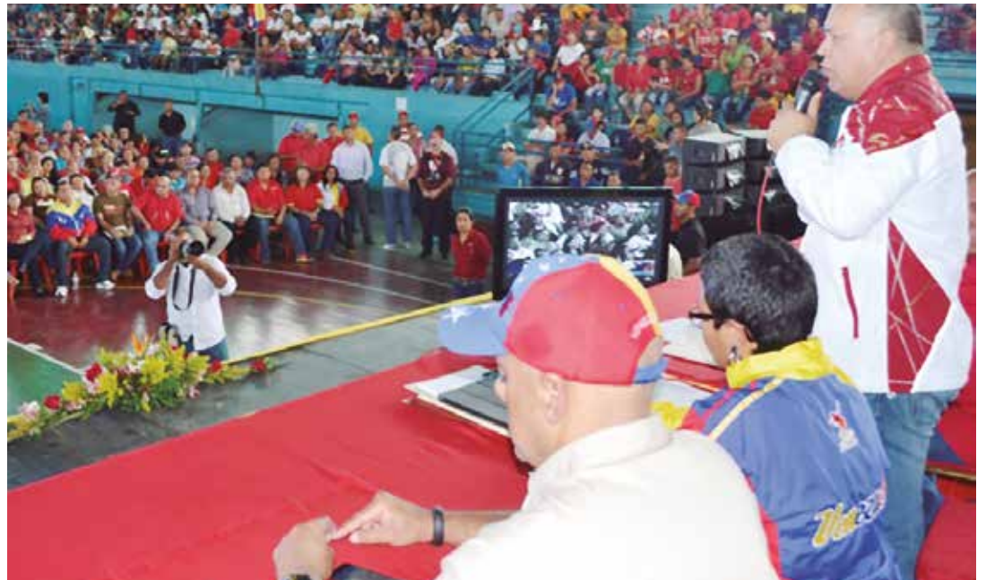
Los socialistas tienen ética y moral para levantar las banderas de la Revolución.

Por otra parte, el dirigente nacional apuntó que la oposición venezolana no tiene manera de ganar una elección electoral, por ello recurren a otros métodos (golpe de Estado) contra el gobierno que preside Nicolás Maduro. Pero "si ellos no descansan, nosotros tampoco debemos