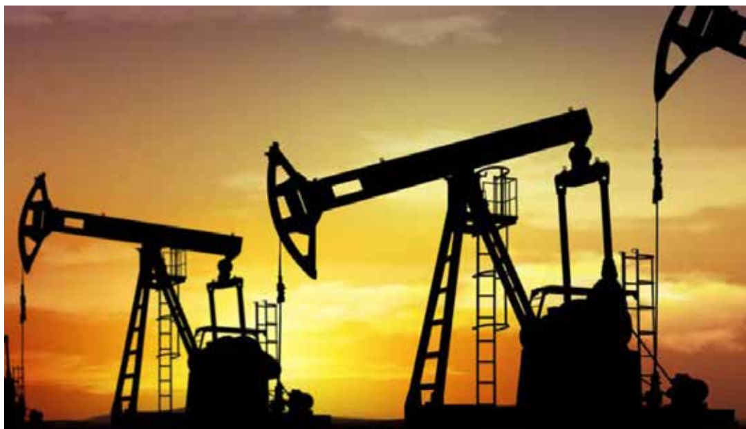
El precio actual está inhibiendo el desarrollo de los nuevos grandes yacimientos.

No hay estimaciones fiables alrededor del precio del crudo, como lo dijo el presidente Maduro en recientes declaraciones: "no está a la vista" la recuperación del precio del petróleo para este año, y es probable que la situación se mantenga así para el 2016. •