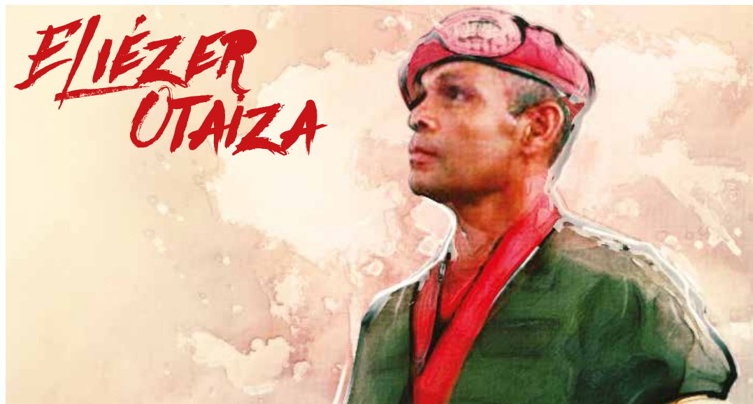
El asesinato de Otaiza fue ejecutado como un falso positivo para ser presentado como un acto delictivo.

Este horrendo crimen ha sido vinculado con el plan de asesinatos selectivos orquestado por la extrema derecha, cuya segunda víctima sería el diputado Robert Serra