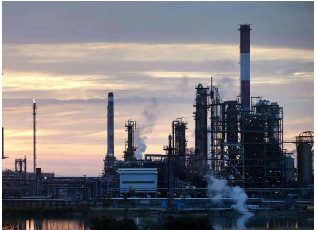
No hay estimaciones fiables alrededor del precio del crudo.

Dicho de otra manera, nos encontramos ante la paradoja de que Irán y EE.UU se encuentran reunidos en una mesa de negociaciones en materia nuclear, mientras se encuentran enfrentados en un "área de influencia en disputa" en Yemen. Dicha si-