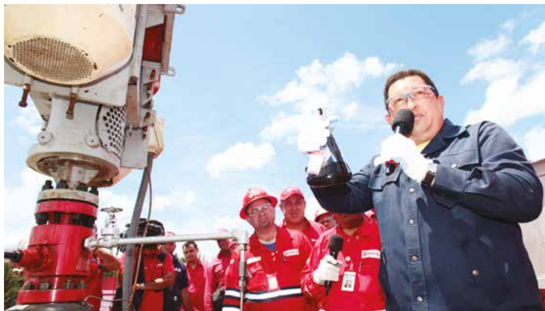
El plan estratégico para el año 2015 busca aumentar gradual y sostenidamente la producción de la Faja.

Durante el año 2014, de acuerdo al Ministerio del Poder Popular de Petróleo y Minería, el precio promedio del crudo venezolano fue 88,4 dólares el barril (en donde contrasta la cifra de 96,14 dólares en el primer trimestre respecto a los 67,69 dólares del último, cuando ya había comenzado la abrupta caída de precios del crudo) mientras que en el primer trimestre del presente año, el precio promedio se ubica en 44,96 dólares el barril (con una cifra mínima de 40,30 durante el mes de enero). La última semana del mes de abril, el precio había repuntado hasta los 52,61 dólares, en un aparente efecto de estabilización, especialmente debido a la compleja situación internacional y el declive del número de taladros activos en los Estados Unidos, entre otros factores señalados por