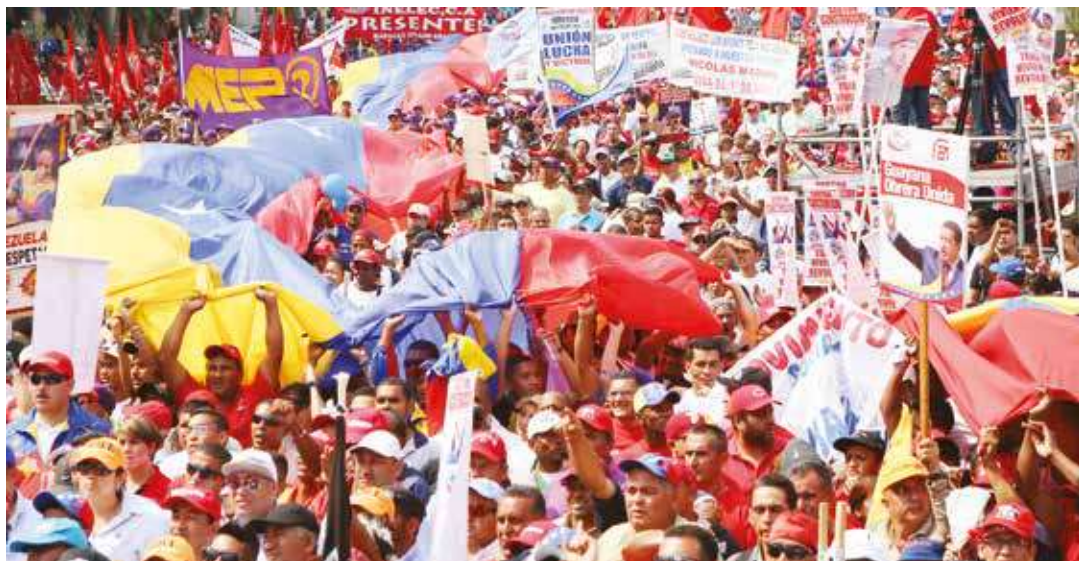
Se crearán los Consejos Comunales de Abastecimiento y Producción.

“Estamos obligados a concentrar todos nuestros esfuerzos, inteligencia, organización y capacidad de lucha, para vencer la guerra económica de los capitalistas y de los pelucones”, señaló el jefe