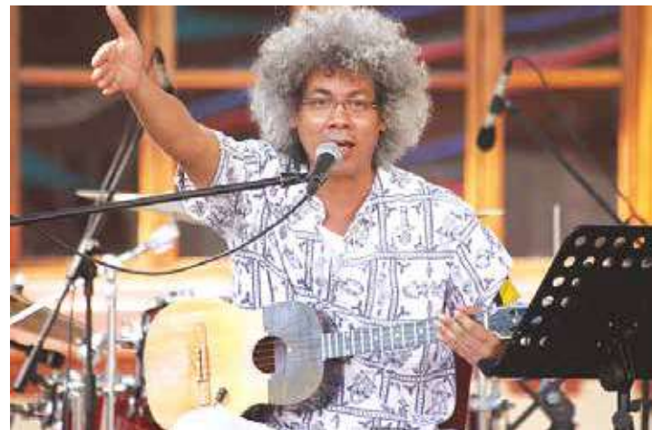
El músico migró de la música académica a la trova desde el año 1983.

-A finales de los años 70 mi papá y mi mamá se fueron a un concierto en el Teatro Nacional. Me dejaron en la casa grabando ese concierto y allí me enteré de que eran nada más y nada menos que Silvio Rodríguez y Noel Nicola. Cuando los escuché mi vida cambió y me dediqué a hacer canciones en ese estilo. Desde el año 1983 en adelante ya mi música tuvo esa arquitectura de trova,