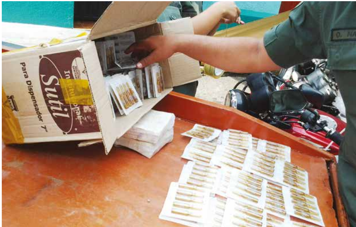
El contrabando de extracción es monopolizado por bandas paramilitares que atacan económicamente a la nación

6 Paramilitares contra el pueblo. Estas bandas criminales han incluido entre su “cartera de servicios” acciones ofensivas contra el pueblo por requerimiento de los empresarios y terratenientes locales. Así es frecuente que actúen amedrentando y hostigando a quienes se opongan a actividades empresariales que perturben la calidad de vida de la comunidad, desalojen cual policía privada a familias que ocupen inmuebles abandonados o parcelas agrícolas improductivas, o ataquen y asesinen a trabajadores en confrontación con sus patronos o con sindicatos patronales. Recientemente los sindicatos de Alimentos Polar denunciaron la utilización de “bandas delincuenciales”, al servicio de la empresa, para intimidar a dirigentes sindicales. Asimismo se ha evidenciado como estas bandas han intervenido estructuras sindicales para negociar las contrataciones de trabajadores mediante el uso de la violencia, incluyendo el asesinato de voceros laborales que les sean adversos.