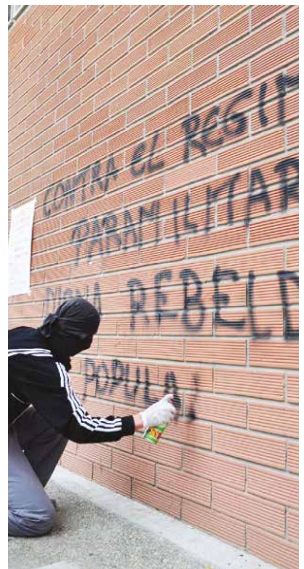
En Colombia la izquierda se ve obligada a actuar en la clandestinidad

Las notas, elaboradas en 2008, recogen una realidad absolutamente alarmante. Hoy exige una actuación inmediata del pueblo y el gobierno. •