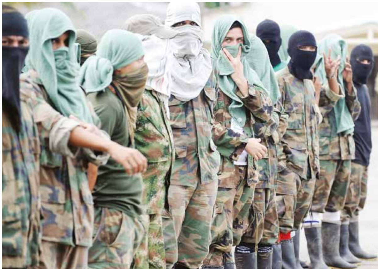
La ferocidad del paramilitarismo es similar al de las bandas criminales.

La violencia criminal organizada como estrategia para generar terror e irrumpir en la sociedad venezolana, busca desmovilizar al pueblo