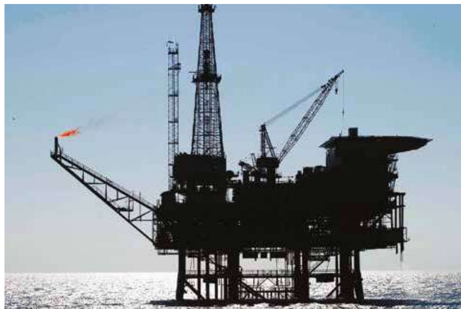
El Esequibo es una zona de inestimables recursos minerales y de posición geoestratégica.

Los enemigos de la integración y del peso político de Venezuela en la región quieren, entre las naciones del Sur, una pelea de perros. Pero en Venezuela contamos con las armas de la política, la historia y la razón. •