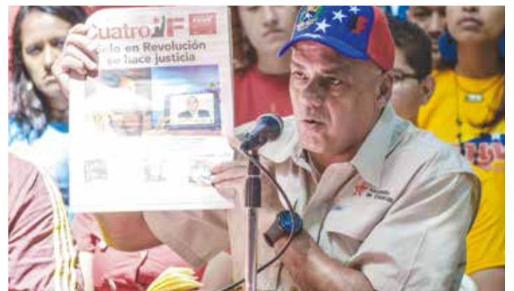
Ellos están aquí porque el pueblo reunido los postuló.

Asimismo, manifestó que la gran media nacional e internacional está en manos de la oligarquía y de la burguesía que fue expulsada del poder por Hugo Chávez, porque "antes eran ellos los propietarios del poder político también, antes quitaban y ponían presidentes, diputados, compraban curules, pero eso desapareció, fue vuelto polvo cósmico en Venezuela, gracias a la revolución bolivariana y a Hugo Chávez". •