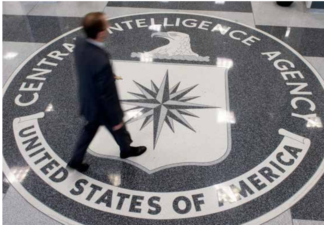
La infiltración de la izquierda, siempre ha sido polémica.

mostrado que la infiltración de cuadros por parte de la inteligencia imperialista dentro de las organizaciones políticas que conducen la vanguardia de los procesos de transformación y cambio, es una peligrosa arma para la desestabilización.