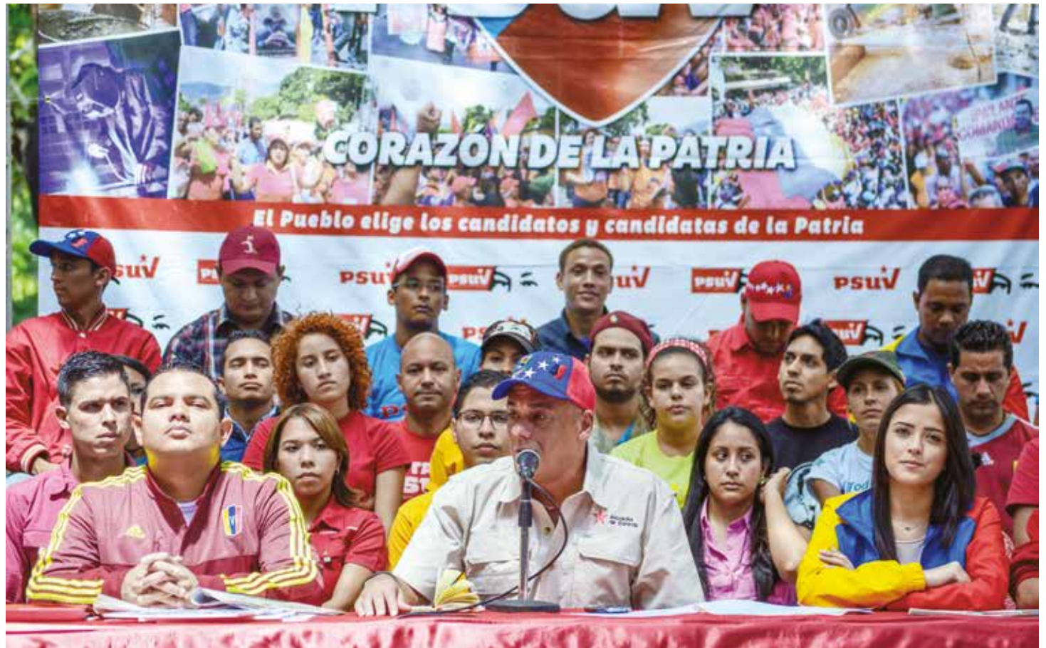
Las 1.162 precandidatas y precandidatos han visitado más de un millón 100 mil hogares venezolanos.

Por las venas de los precandidatos del PSUV y todo el pueblo venezolano, corre sangre de los libertadores de América, por lo tanto no vamos a aceptar ninguna grosera injerencia"