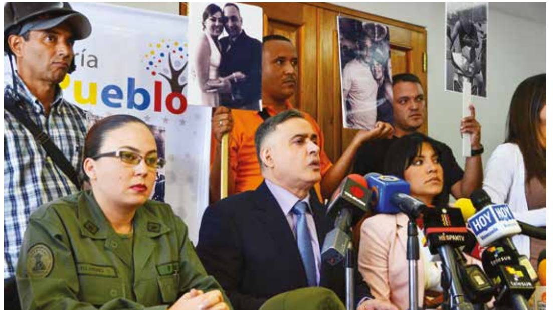
Felipe González hizo su proselitismo sin escuchar a las víctimas de las guarimbas.

Luego se efectuaron elecciones municipales donde factores de diversas corrientes políticas ganaron importantes municipios, pero territorialmente el sector gubernamental obtuvo la mayoría, que reconoció el sector opositor en una reunión en Mira-