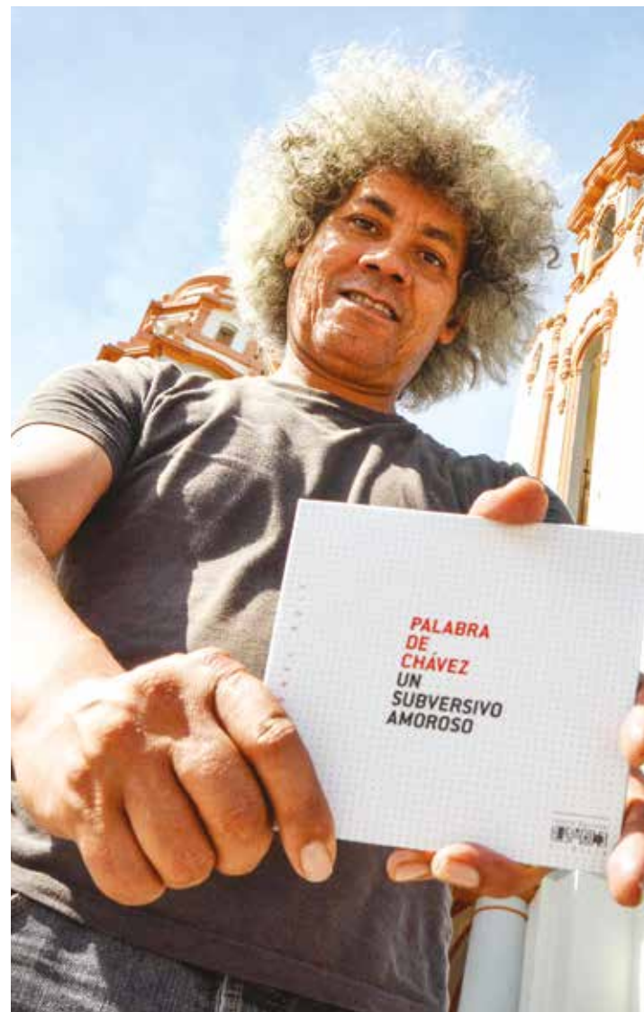
La música forma parte de mi genética.