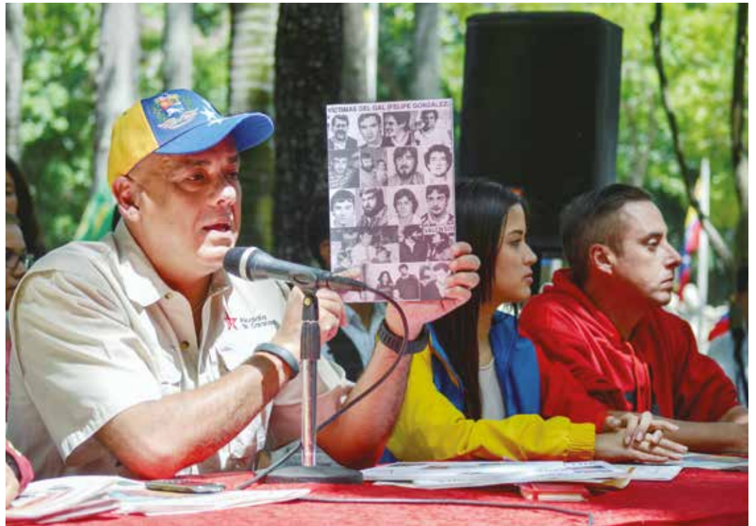
El expresidente español fue el responsable del asesinato de 28 españoles por el caso GAL.

"¿Cuántos jóvenes fueron desaparecidos y asesinados aquí mientras Pérez fue ministro?, se inauguró el tenebroso expediente de las torturas sistemáticas de dirigentes estudiantiles de izquierda