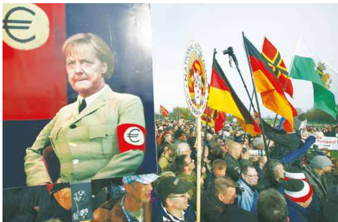
Crece la ultraderecha euroescéptica.

Solo tres días después, el 7 de mayo, se realizará lo que podríamos llamar el "juicio de la UE". Este juicio se efectuará con la segunda vuelta de las Elecciones Presiden-