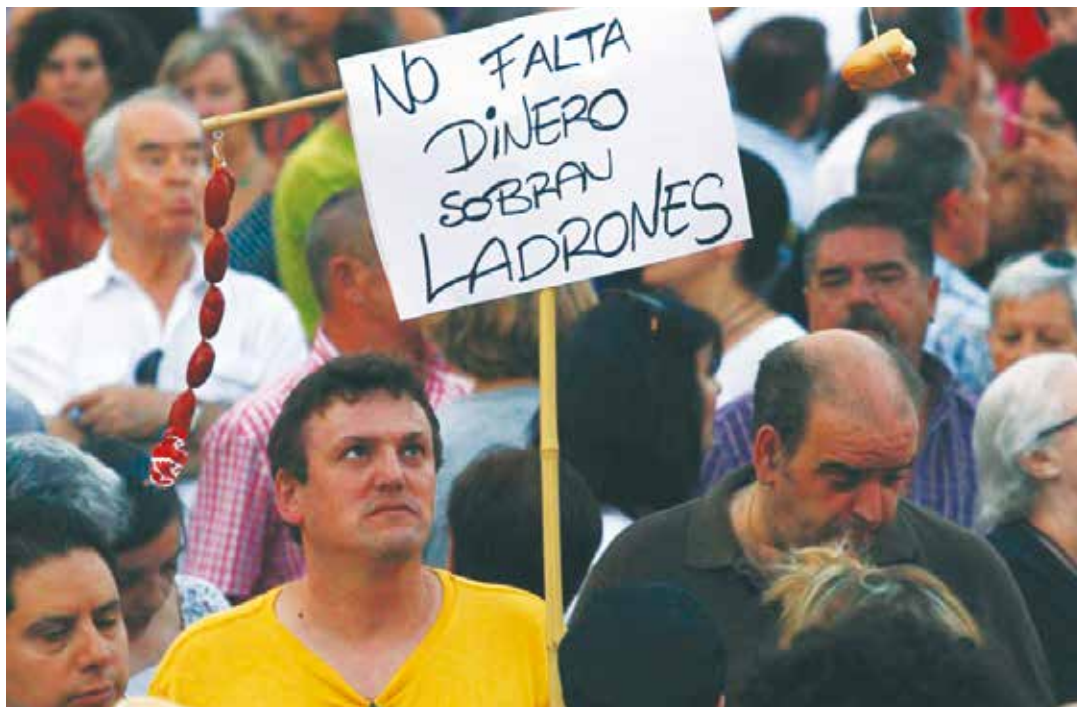
La clase trabajadora europea cada día más marginada.

Una respuesta concreta, aquello que afirmamos desde tiempo en varios de nuestros libros, es que estamos frente a una cuestión política, de correlación de fuerzas, que en el devenir de la lucha de clase pueda poner a favor del mundo de los trabajadores recursos como un programa mínimo de fase a partir de conquistas sociales. En principio imponiendo políticas económicas, no en función de las empresas, sino que antepongan las prioridades sociales, y la mejora conti-