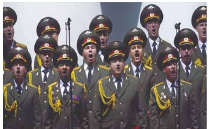
Coro del Ejército Rojo.

El 25 de diciembre de 2016 sesenta y cuatro miembros del Coro del Ejército Rojo cayeron al Mar Negro y desde allí volaron hacia el confín, como lo hicieron el 3 de septiembre de 1976 cincuenta y tres miembros del Orfeón Universitario de la UCV. Llevaban un mensaje perpetuo de paz para alegrar los corazones en la agredida Siria como ya lo había hecho en zonas de conflicto como Afganistán, Yugoslavia, Moldavia, Tayikistán y Chechenia.