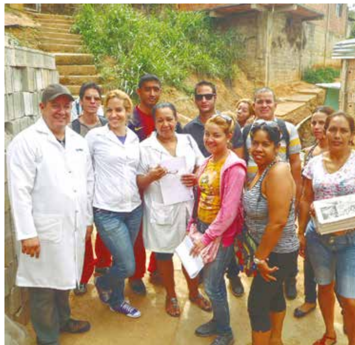
Médicos cubanos apoyan a las comunidades