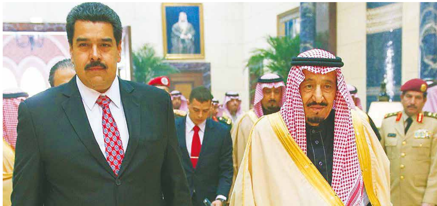
La diplomacia de paz petrolera rindió sus frutos

El presidente Nicolás Maduro ha propuesto una cumbre presidencial de naciones pertenecientes a la OPEP en donde se presentará una fórmula a largo plazo para la fijación de los precios