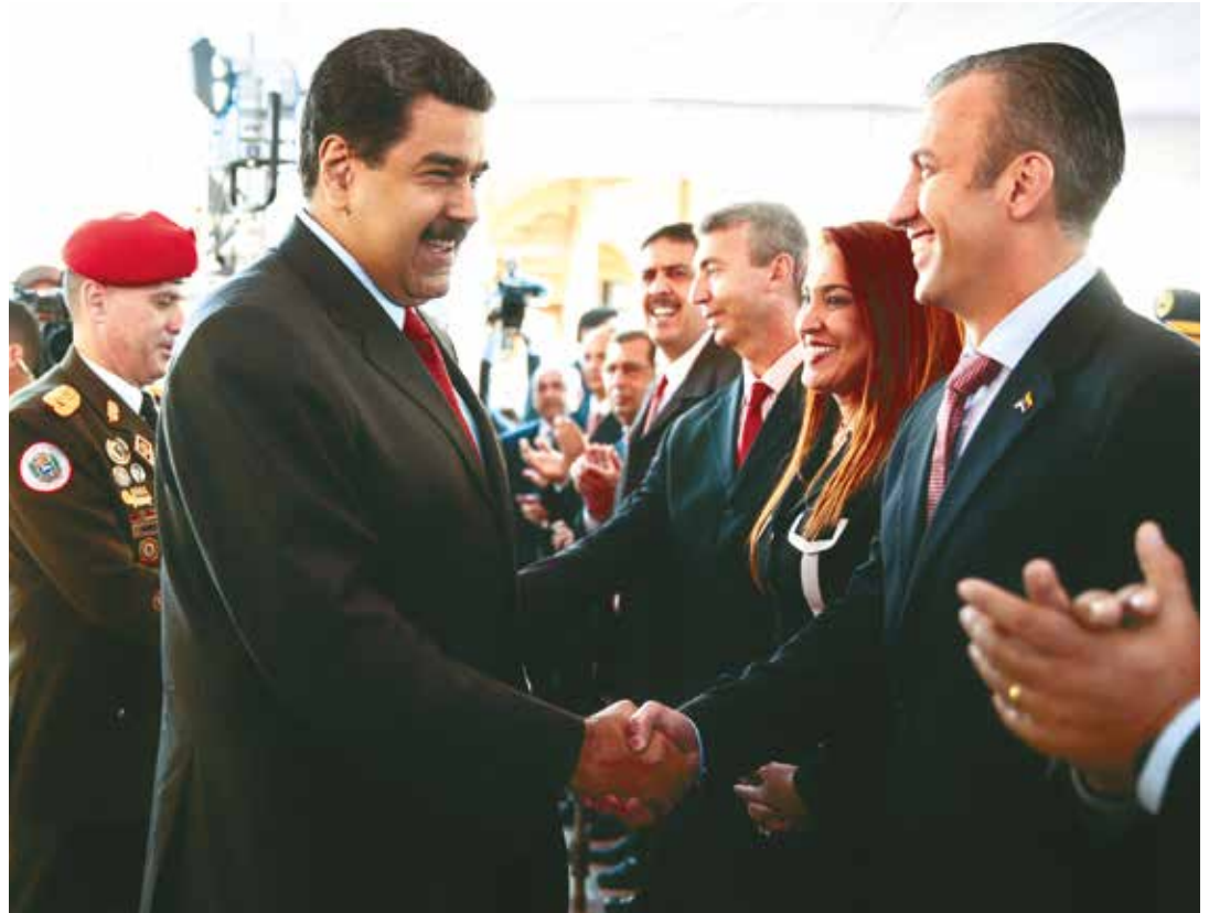
El Aissami se enfocará en luchar contra la amenaza paramilitar.

Comentó que Jaua se ha desempeñado como ministro del Poder Popular para la Agricultura y Tierras, así como vicepresidente Ejecutivo de la República en el