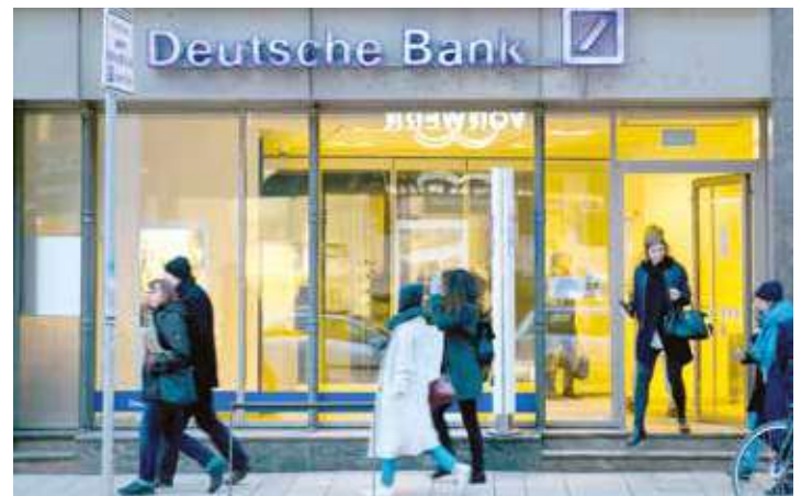
Son los bancos los mayores especuladores.

Considerando el pensamiento revolucionario de la ruptura y superación del