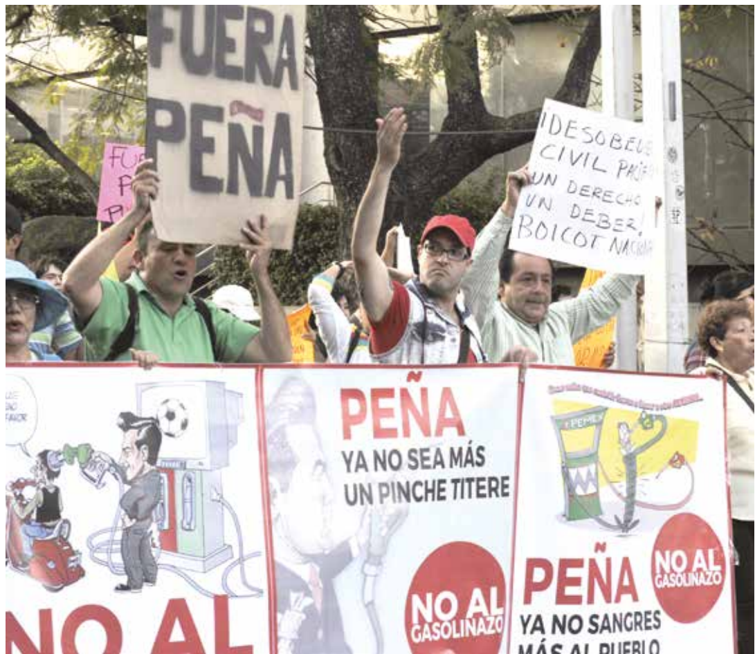
La protesta por el gasolinazo es un hecho inédito.

No, porque, a pesar de todo, lejos de disminuir, el descontento social sigue extendiéndose y no tiene visos de debilitarse en el corto plazo. La relación entre el número de protestas y el de saqueos es, según un recuento de notas periodísticas, al menos de cinco a uno. Y no, porque, la