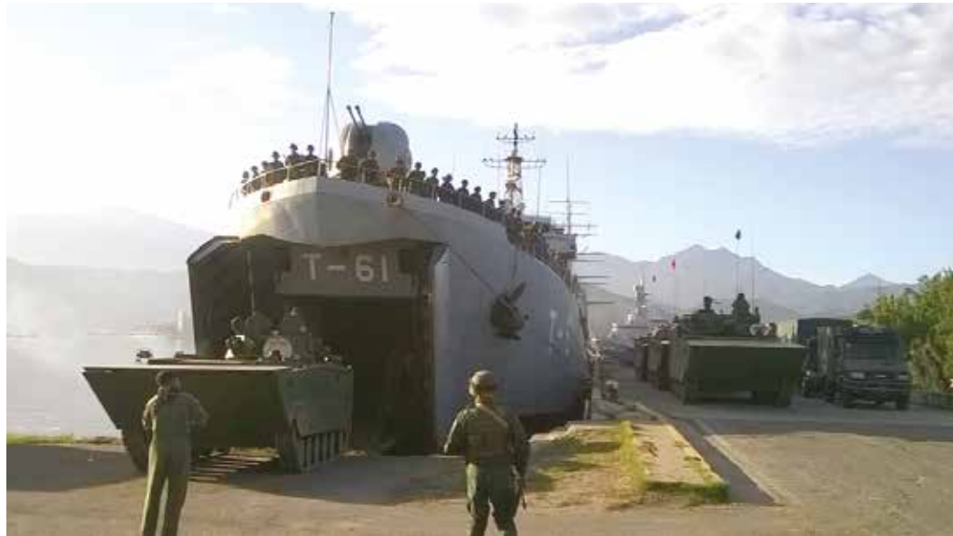
Los ejercicios se realizaron en todo el país.