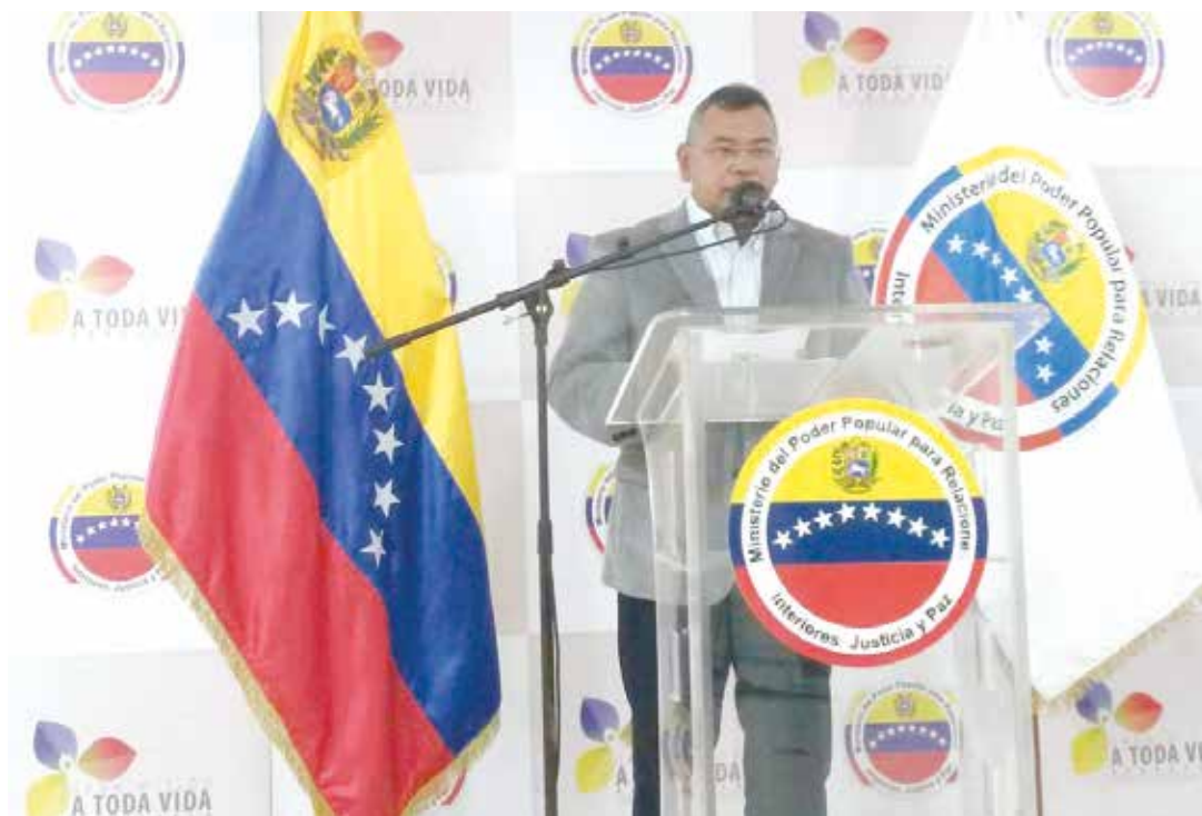
El ministro develó el plan golpista.

"El Comando Nacional Antigolpe en el inicio de 2017, recibió información de diferentes fuentes sobre la intención de generar una acción de