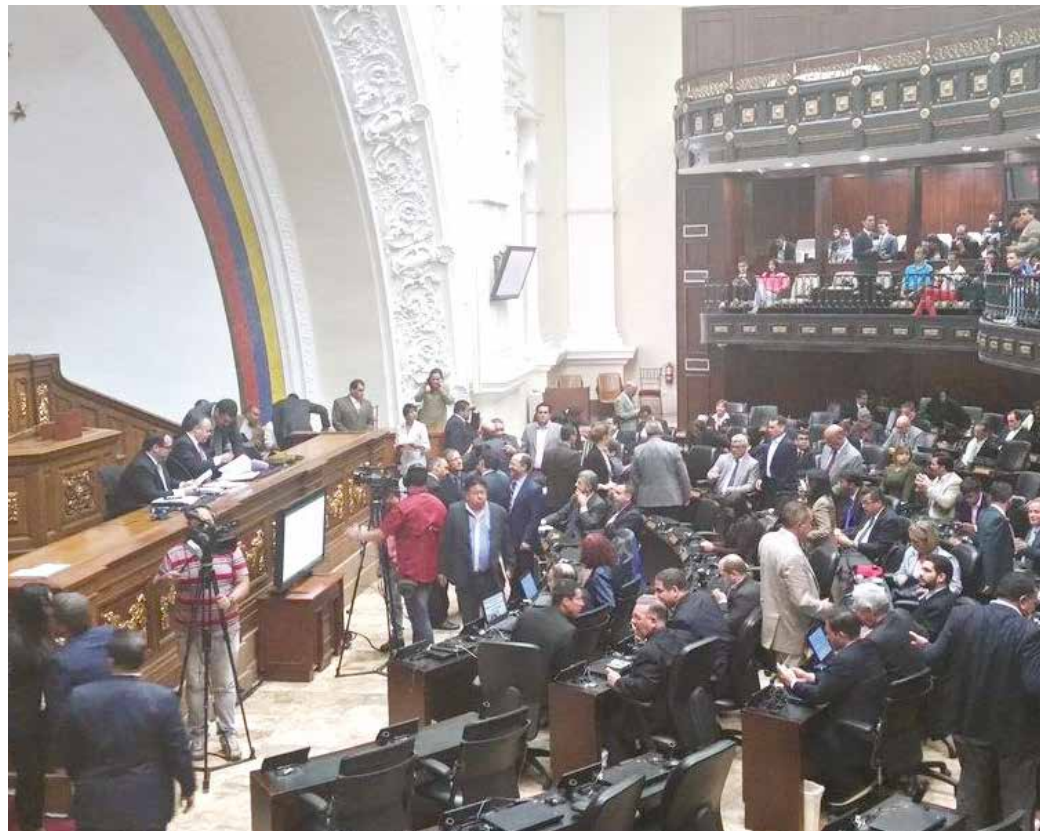
La capacidad jurídica de la Asamblea está disminuida.

Efectivamente la Cnrbv en el artículo 233 prevé la posibilidad de que la AN declare el abandono del cargo, pero dicho artículo no califica en qué consiste ese abandono. Por tanto, la aplicación de la norma estaría supeditada al hecho de que el presidente de la república dejara el cargo y para que se haga efectiva con valor legal la falta absoluta, el constituyente previó darle al órgano de control político que es la AN declararlo como tal. Este no es el caso en que se tomó dicha decisión, porque el presidente Nicolás Maduro está en pleno ejercicio de sus funciones y la AN interpreta el alcance del artículo 233 sobre la base arbitraria y sesgada con motivos subjetivos de criterios políticos partidistas, aprovechando su mayoría en la correlación de fuerzas dentro del Parlamento, acción esta que jurídicamente es inaceptable porque en la arquitectura constitucional venezolana no está contenida tal acción, pues nuestra democracia es presidencialista y no parlamentaria. Con esta aviesa conducta además de violar la Constitución se le hace un flaco servicio a la democra-