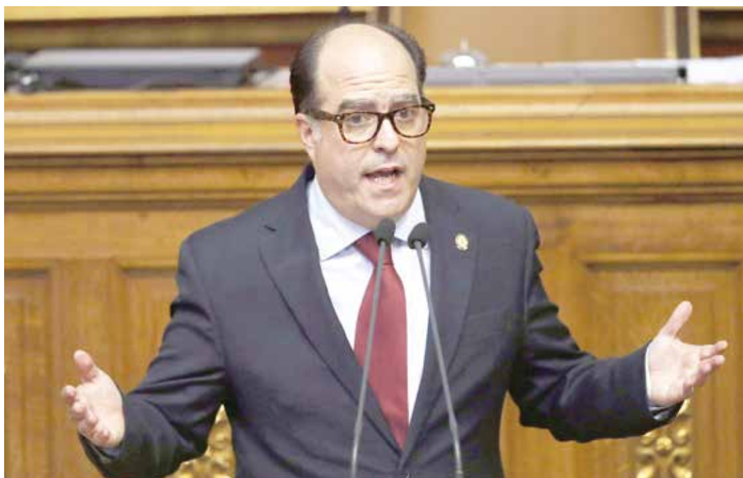
La Asamblea Nacional insiste en llamar al Golpe de Estado.

El TSJ señaló en un comunicado que la instalación de la AN y elección de una nueva Junta Directiva, efectuada el 5 de enero de 2017, no tiene validez porque continúan el desacato a varias sentencias emanada del Poder Judicial