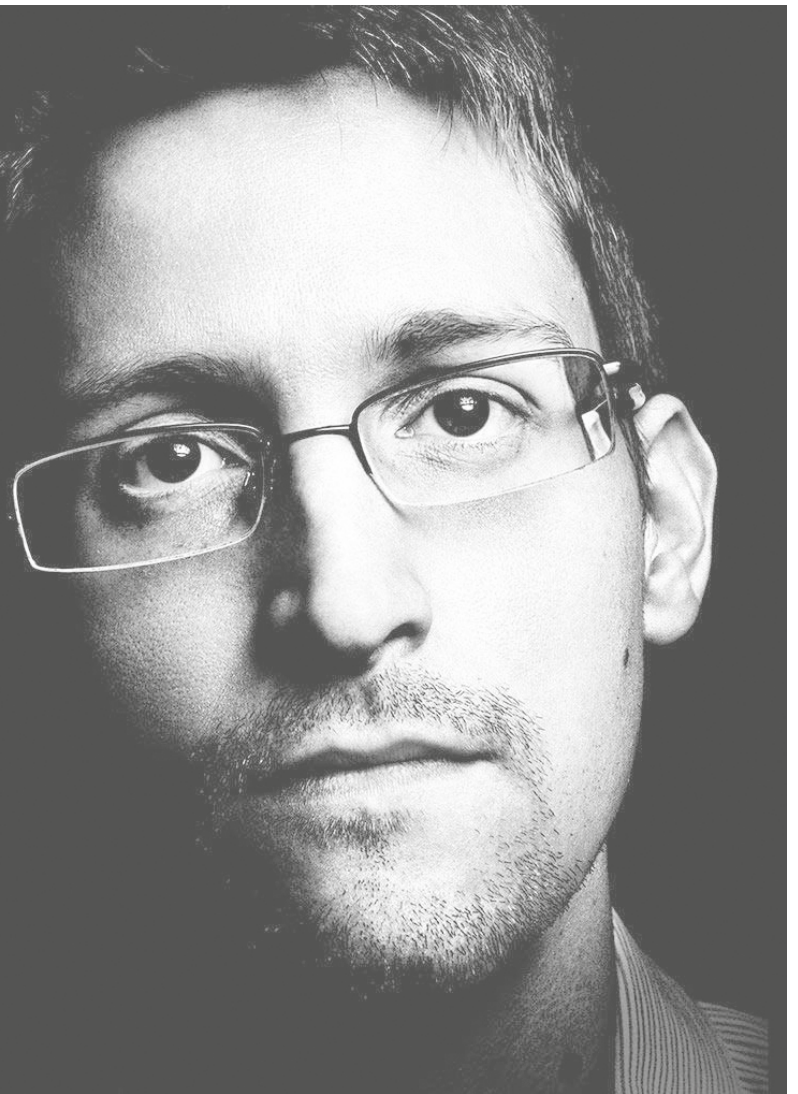
Edward Snowden develó la vigilancia masiva que ejercen los organismos de inteligencia de Estados Unidos.

Los servicios de inteligencia actuaron criminalmente basados en las premisas del Gran Hermano de George Orwell, "juntarlo todo" y "saberlo todo"