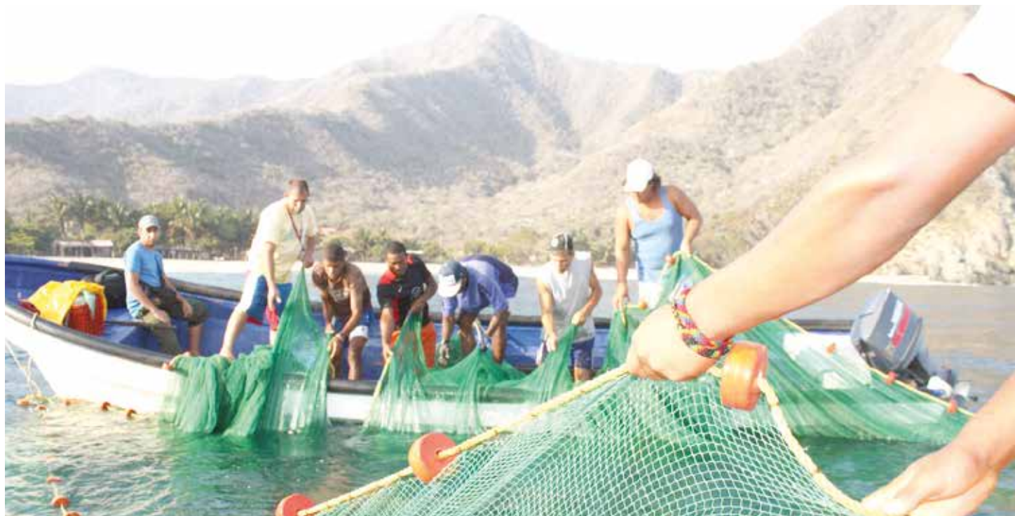
Venezuela construye un modelo basado en la independencia alimentaria.

Los recursos en cuestión están destinados a la productividad de las pequeñas y medianas industrias, así como todos los sectores productivos del país para potenciar la economía nacional. “Tenemos que convertir el año 2017 en un año de inicio de un nuevo modelo económico que nos pertenezca a todos para crear la riqueza física, material, monetaria, financiera suficiente para que nuestro país avance”, señaló el mandatario nacional en presencia de más de 200 empresarios.