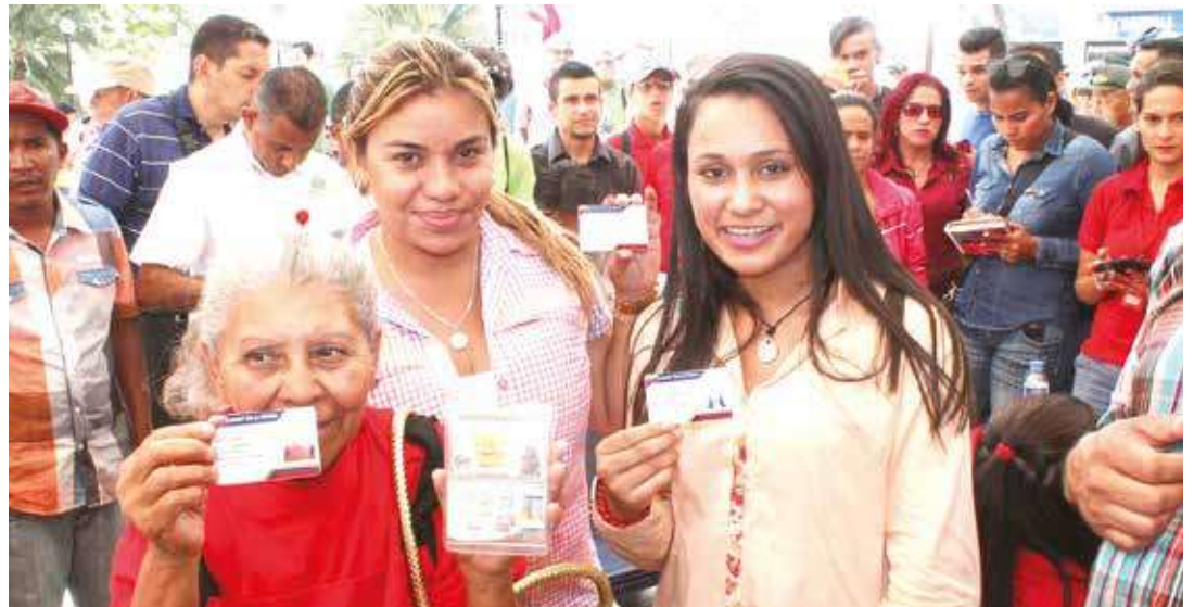
Los caraqueños mostraron orgullosos su Carnet de la Patria.

Para estas primeras jornadas los puntos de registros estarán desplegados en las plazas Bolívar del país, en 37 Bases de Misiones, 84 corredores de la Gran Misión Barrio Nuevo Barrio Tricolor y en 35 urbanismos de la Gran Misión Vivienda Venezuela. Acotó Farías que estos espacios se irán incrementando paulatinamente durante las próximas semanas hasta alcanzar los 1.876 puntos de carnetización. Asimismo, indicó que esta medida permitirá registrar con fluidez a los miembros de los movimientos y organizaciones que conforman el Congreso