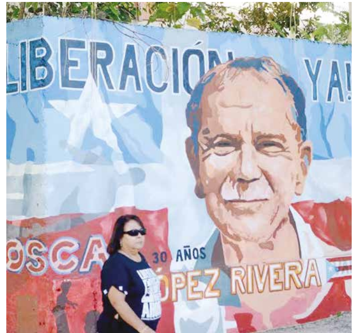
Puerto Rico celebra la liberación de Oscar López Rivera.

Oscar López Rivera se integra a la lucha clandestina en favor de la independencia de Puerto Rico en 1976 como miembro de las Fuerzas Armadas de Liberación Nacional (FALN). En 1981 fue capturado por el FBI y condenado a 55 años, a pesar de haber estado en Vietnam. Más tarde le extendieron la sentencia a 70 años por un supuesto "intento de fuga". 12 años los pasó en aislamiento total. Según el Protocolo I de la Convención de Ginebra de 1949 un prisionero de guerra, como es su caso, "no puede ser juzgado como un criminal común, mucho menos si la causa de tal procedimiento descansa en actos relacionados con su participación en una lucha anticolonial". Si algo le sobra a Oscar López Rivera es valor para seguir luchando por la independencia de Puerto Rico. •