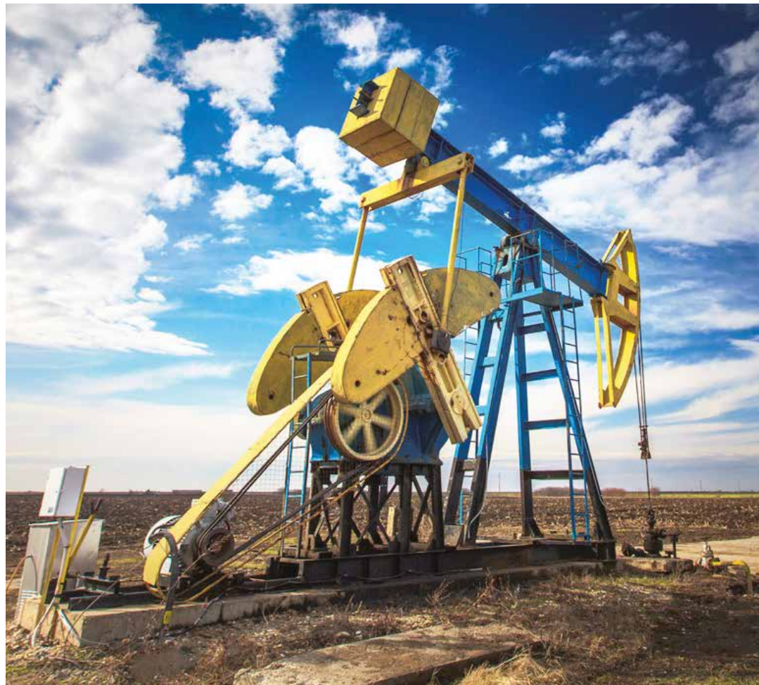
El precio del crudo se recupera.

Maduro subrayó la necesidad de que los países productores de petróleo definan las condiciones del mercado petrolero mundial y no aquellos factores que han atacado la industria, al inducir la baja de los precios del barril. "Los que producimos debemos go-