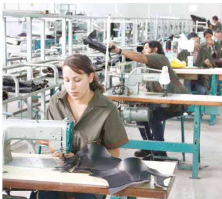
Se aspira lograr un crecimiento económico.

Los 15 motores productivos han de ser la columna vertebral de la nueva economía