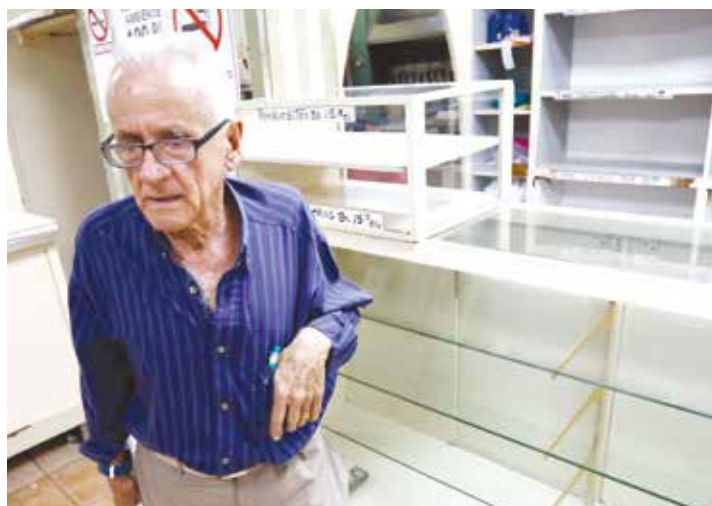
La guerra económica ha dejado profundas heridas.

El Presidente Maduro ha anunciado un relanzamiento de todas las Misiones y Grandes Misiones Socialistas y me ha dado la responsabilidad de estar al frente de esa