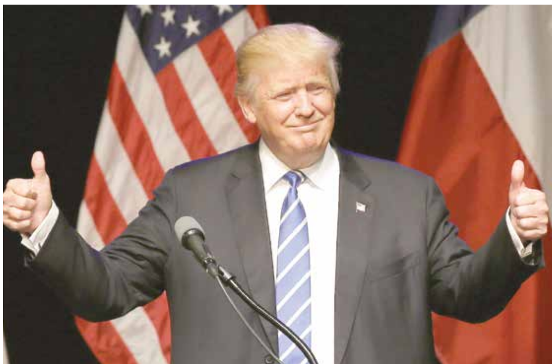
Donald Trump promete cambios radicales.

El tono entre los EE.UU. y la UE es cada vez más tenso, con un presidente electo que no solo define el Brexit como "una gran cosa", al tiempo que piensa que otros países europeos seguirán el ejemplo de Londres contra la Unión Europea, que Washington considera un competidor que tiene que ser debilitado.