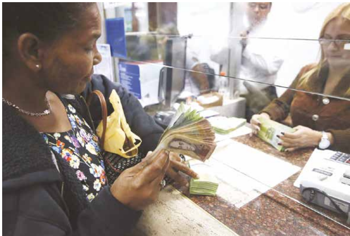
Las casas de cambio en la frontera con Colombia buscan enfrentar la cotización de Cúcuta.

Esto último sería una cuestión a considerar, tiene muchas derivadas, pero hay que analizarlo si entendemos la complejidad de estas situaciones económicas excepcionales. Eso quedará para otra nota, conforme a la evolución de estas cuestiones y a las señales que veamos por parte del chavismo y su directorio económico. •