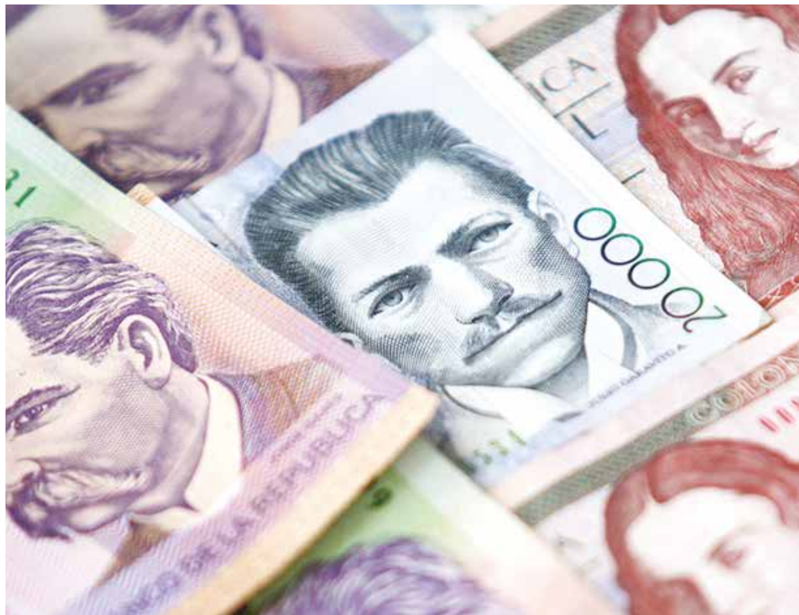
En la frontera con Colombia se libra una batalla por la estabilidad monetaria de Venezuela.

Este número está por encima del dólar flotante Dicom (Bs. 678 por dólar) que determina el Banco Central de Venezuela (BCV) y por debajo del referencial de Bs. 949 por dólar, que surge de la relación entre