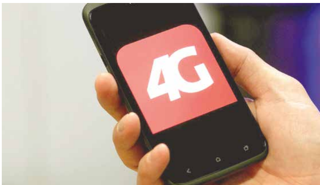
Esta tecnología en manos de la Revolución potenciará el e-gobierno.

El acceso a esta veloz autopista de la información