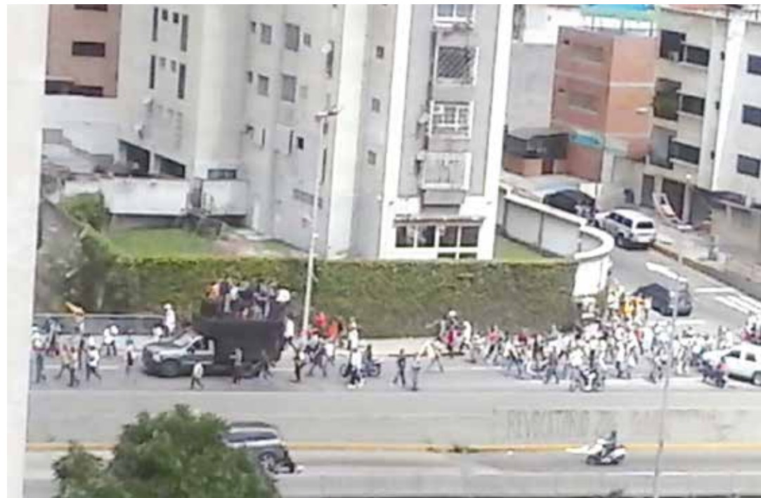
La poca participación de los militantes de la MUD en la marcha del 23 de Enero refleja que van de mal en peor.

Ante tal fracaso y decepción de la MUD, el periodista José Vicente Rangel propuso "estimular a los factores democráticos a organizarse y a actuar, lo que equivale a generar estabilidad, a garantizar que la gestión de gobierno cuente con celosos observadores, con críticos que impidan funestas desviaciones" señala en el artículo El tema de las responsabilidades. •