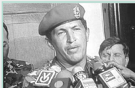
POR AHORA Y PARA SIEMPRE

La sangrienta retoma del Palacio de Miraflores por parte de tropas leales al gobierno a las 4:00 am, y el escape de Carlos Andrés Pérez al canal privado Venevisión, determinaron el fracaso de la operación, cuyo eje era la toma del centro del poder político.