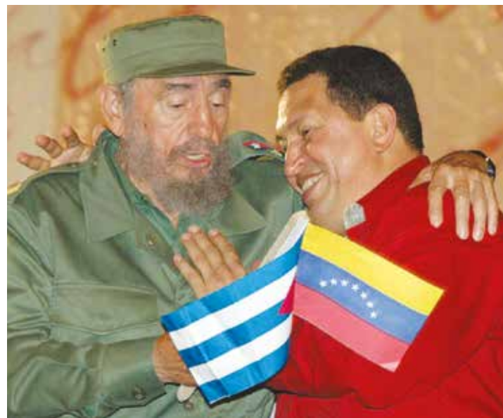
Fidel y Chávez construyeron un camino digno para sus pueblos.

Esta idea de que los pasos sean siempre los mismos, "la fila india del antes y el después", decía Benjamin, es fuertemente eurocéntrica y