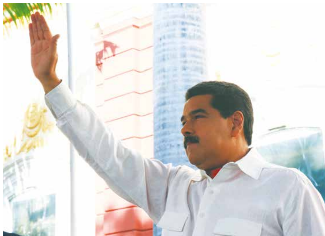
A la Revolución hay que alimentarla todos los días.

En esta escuela de la Revolución de 18 años, ya hoy, tanto hemos aprendido, que somos otro pueblo. Ha nacido otra cultura, otra conciencia y espíritu