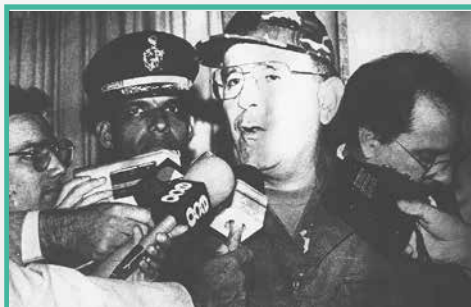
UNA SUPUESTA DERROTA

...ental de ...rabobo, ...ual Distrito ...an ...í como en ...y los