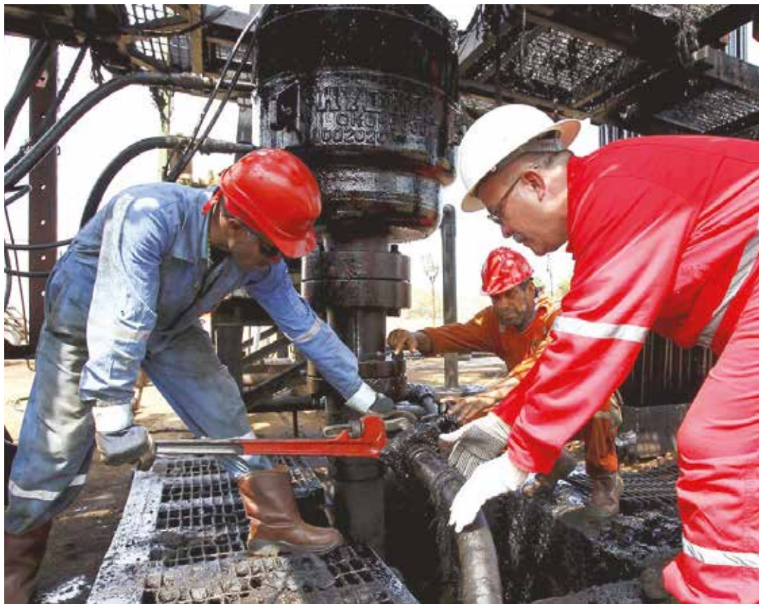
Las reservas de crudo de Venezuela son las mayores del mundo.

su consumo el crudo venezolano. La cuestión de la Faja del Orinoco es para el mediano y largo plazo de manera tal que en un futuro no muy distante habrá sólo un puñado, una decena de países, que contarán con reservas cuantiosas y a ellos acudirán unos 190 países consumidores esperando no quedar relegados al ostracismo energético y de las materias primas.