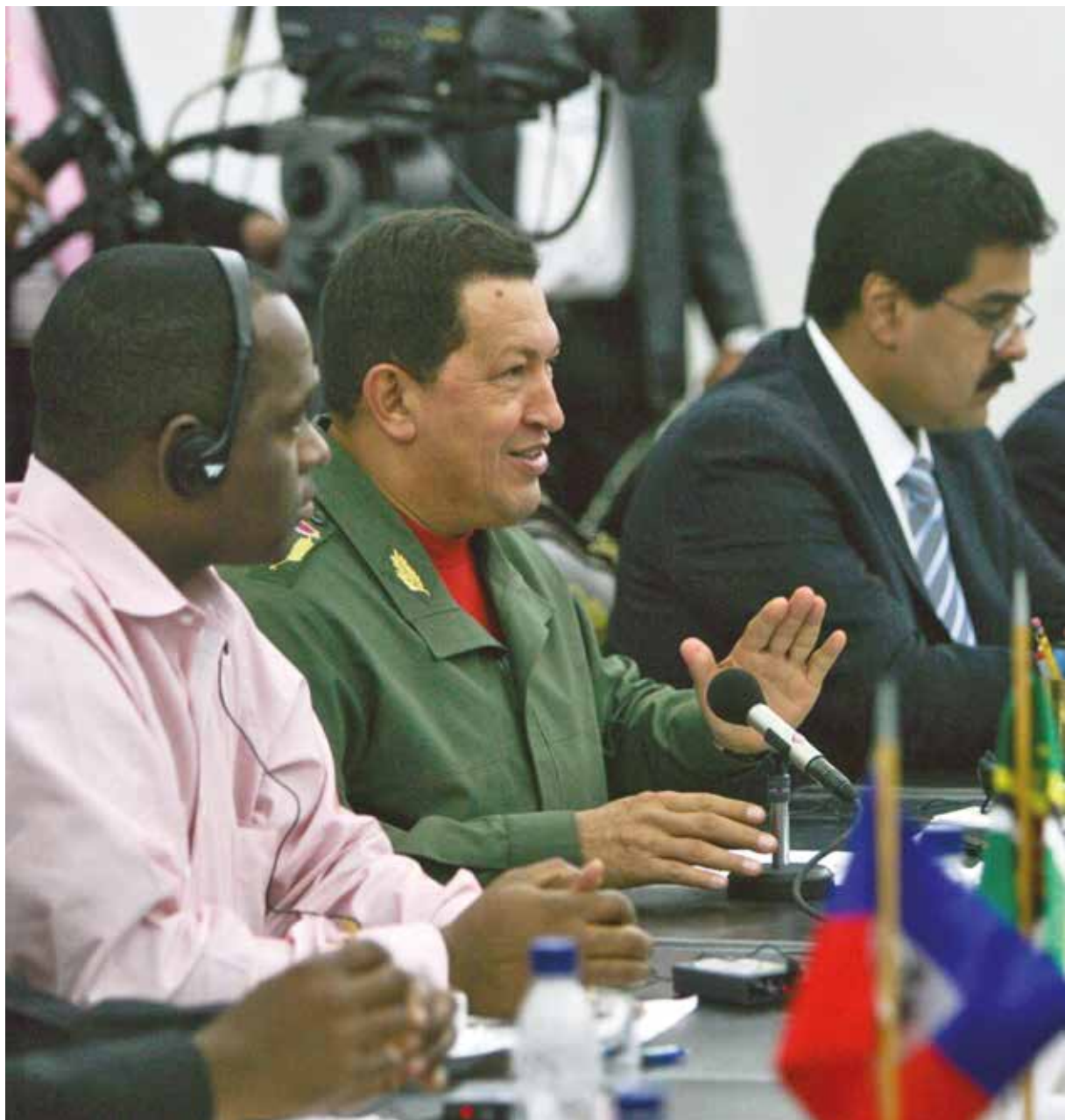
Petrocaribe nace de la mano de Hugo Chávez.

Por eso en aquella primera visita a La Habana, Fidel recibió a Chávez como un jefe de Estado, y no se equivocó.