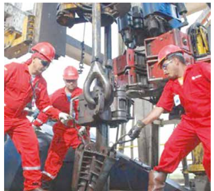
El petróleo apalanca el gasto social.

La guerra por el petróleo en Venezuela está en curso. Parece política, pero no es. Parece pacífica, pero no es. Es la explicación al duro momento, a la dura etapa en que vivimos y a nuestras encrucijadas. La guerra cae fuerte sobre nosotros, cuestión que nos demanda tomar un lugar, que nos obliga a definirnos concluyentemente, antes que, ojalá nunca, veamos el lado horrendo de las guerras armadas por petróleo que a otros les sobrevino sin tener idea, literalmente, de dónde estaban parados. •