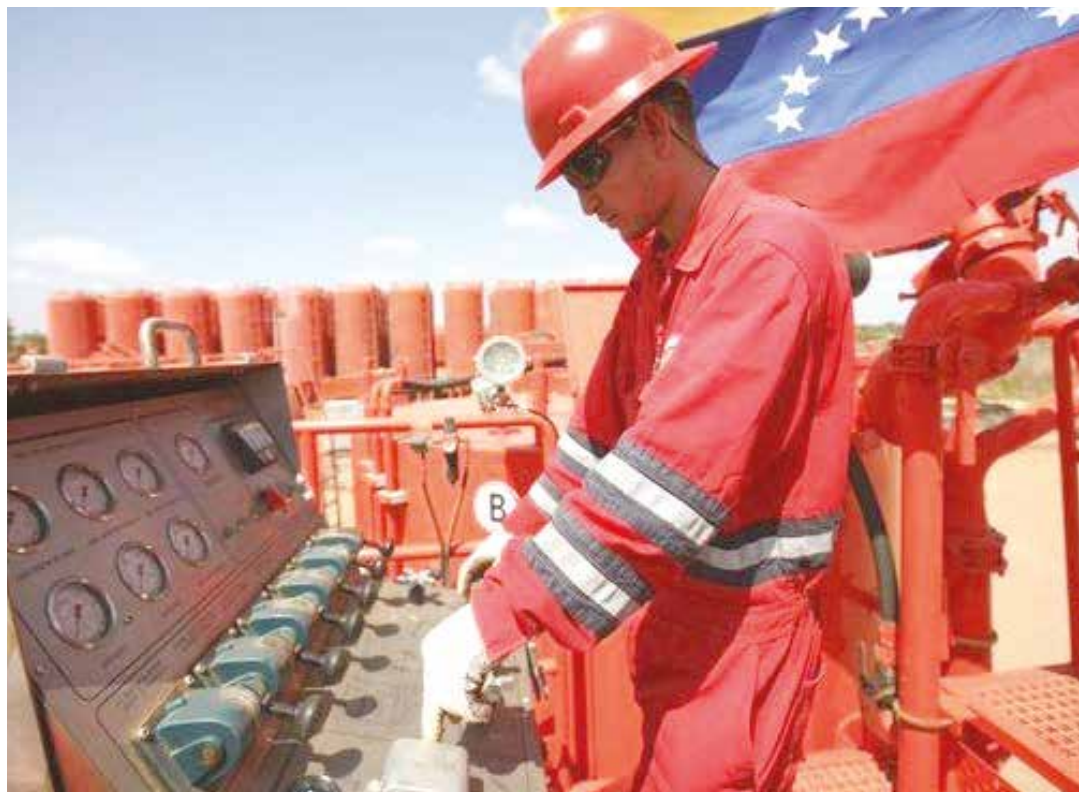
Venezuela está en el ojo del huracán.

Pero el cálculo de las reservas venezolanas tiene otra arista a saber. La base de cálculo de las reservas en la Faja yace en un factor de recobro calculado de 20%. Es decir, los tan mencionados casi 300 mil millones de barriles de petróleo es el 20% extraíble de lo que hay ahí que en términos de la materia se denomina "Petróleo Original en Sitio (POES)". Por tratarse de crudo extrapesado, se cuantifica un 20% que es extraíble con las tecnologías actuales. Pero la