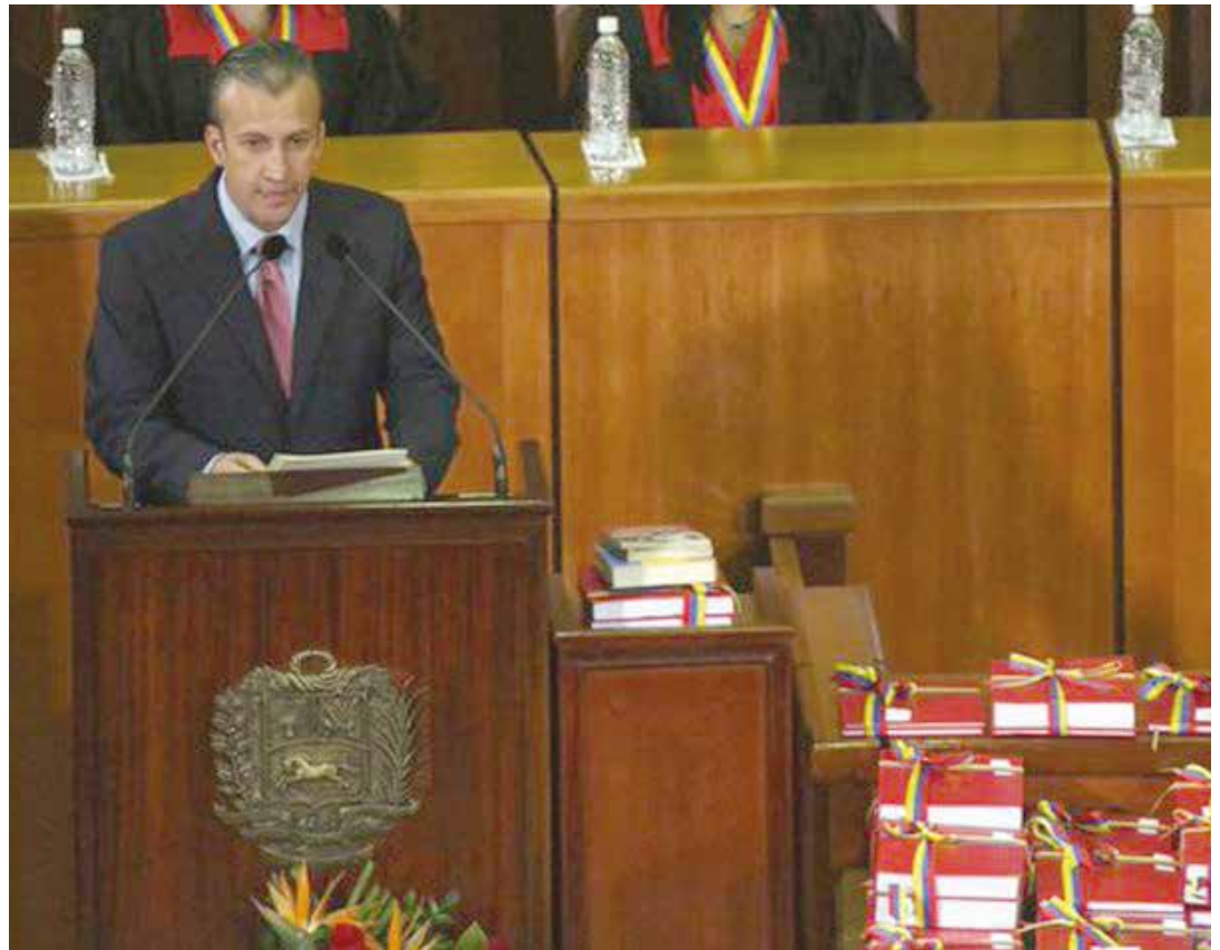
Destacó la conciencia popular como arma contra la guerra económica

Logros en cifras El Aissami mostró las cifras correspondientes al año 2016, las cuales, a pesar de las dificultades demuestran los logros del proyecto político iniciado en 1999: la inversión social de 38% en los tiempos de la Cuarta República a 71,4% en el 2016. Se pasó de un 19% hasta un 90% de la