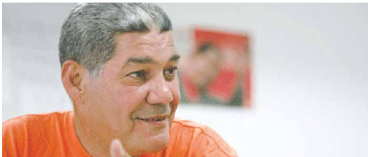
El dirigente del PSUV destaca las fortalezas del venezolano frente a las arremetidas.

“El chavismo es una concreción teórico-práctica que va direccionado a solucionar los