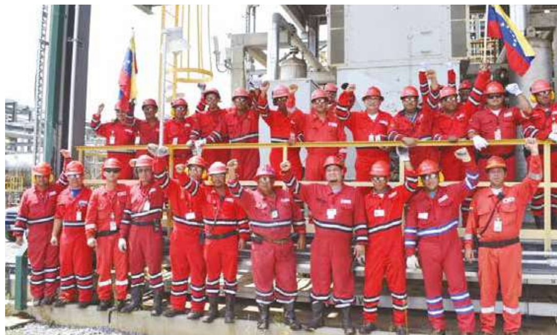
Los trabajadores: fortaleza de la revolución.

Antes de la Revolución Bolivariana las reservas venezolanas se encontraban "aseguradas" a la explotación, aprovechamiento y consumo casi exclusivo de EEUU. Hoy, con la diversificación de la política petrolera, el cambio es significativo si hablamos de la cartera de países que desarrollan actividades petroleras en Venezuela y a los cuales va para