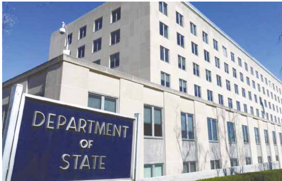
Freedom House es un brazo del Departamento de Estado de EEUU.

Freedom House fue una de las principales agencias intelectuales y propagandísticas que Washington utilizó para el diseño y creación de la OTAN. De ahí en adelante (y sobre todo después de que la administración Reagan creara la NED como un brazo civil de la CIA) su papel ha consistido en formar y financiar disidentes, cooptar intelectuales y partidos políticos, contribuir en campañas de propaganda (mediante sus tentáculos en los grandes medios internacionales) y generar expedientes pro-intervención en todos aquellos países adversos a las políticas de la Casa Blanca. Nació primero para frenar la expansión de la URSS y luego a todo aquel proyecto que atentara contra la dictadura de las corporaciones