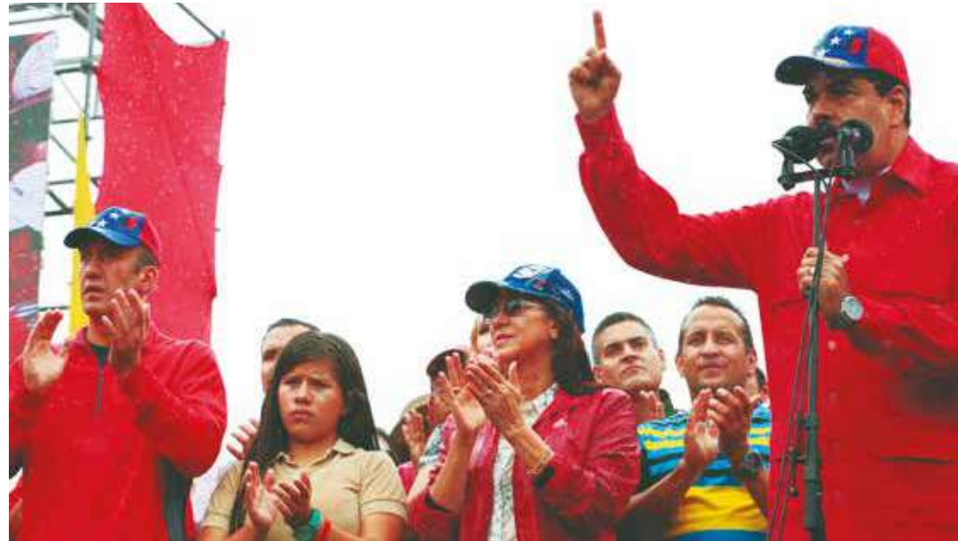
Maduro: Queremos las mejores relaciones con Estados Unidos.

Durante cuatro años se intentaron todos los recursos para derrocar a la Revolución, pero aquí estamos de pie, demostrando que se puede ser dignos y soberanos