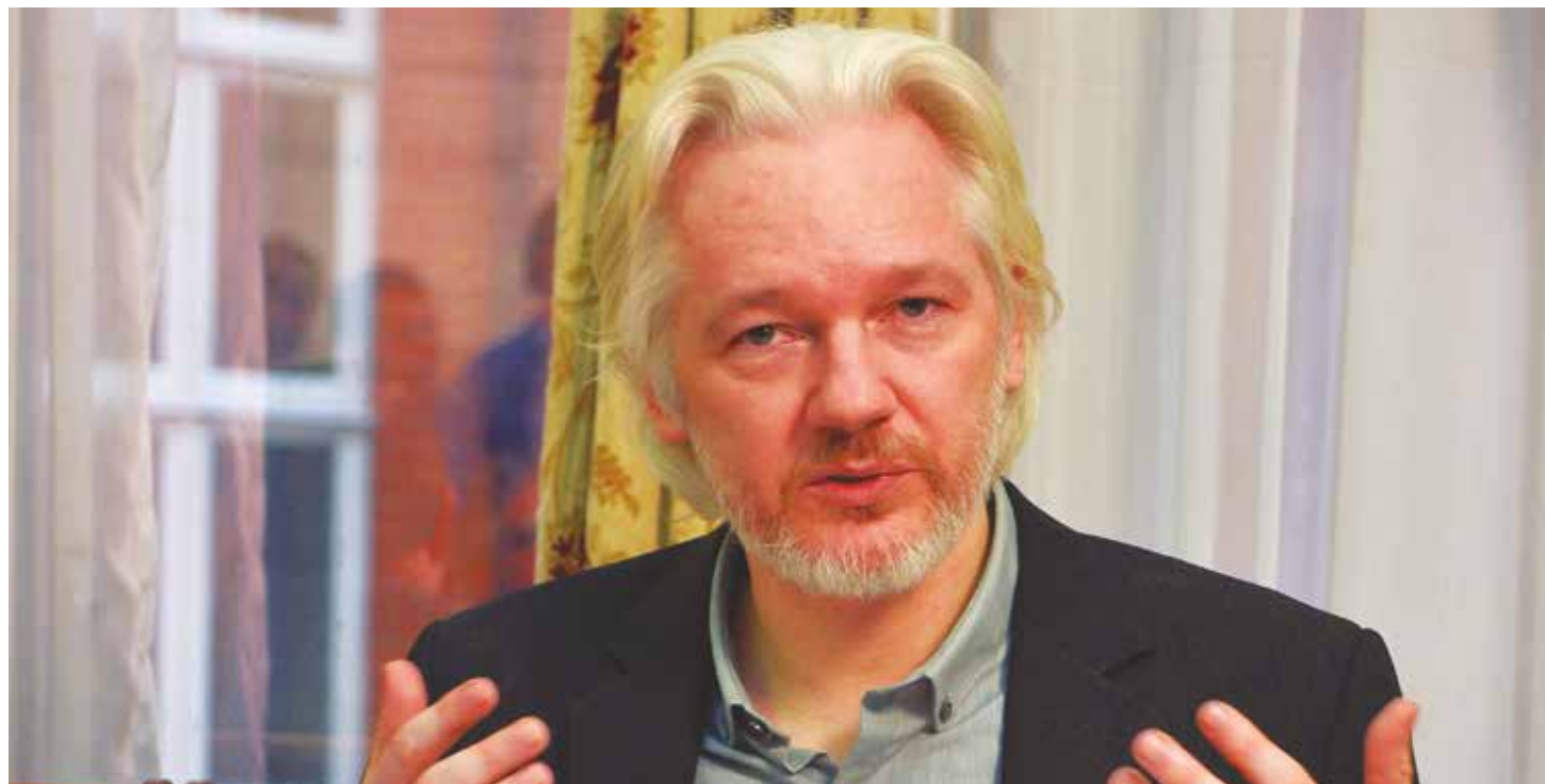
El fundador de Wikileaks solidario con Venezuela.

Denunció las injusticias tal y como él las veía y en el 2001 fue el único líder que denunció el asesinato cometido por los Estados Unidos de civiles inocentes en Afganistán, indicando: "Ustedes no pueden pelear el terrorismo con terrorismo". Poco después de 6 meses, los EE.UU apoyaron un golpe de estado en su con-