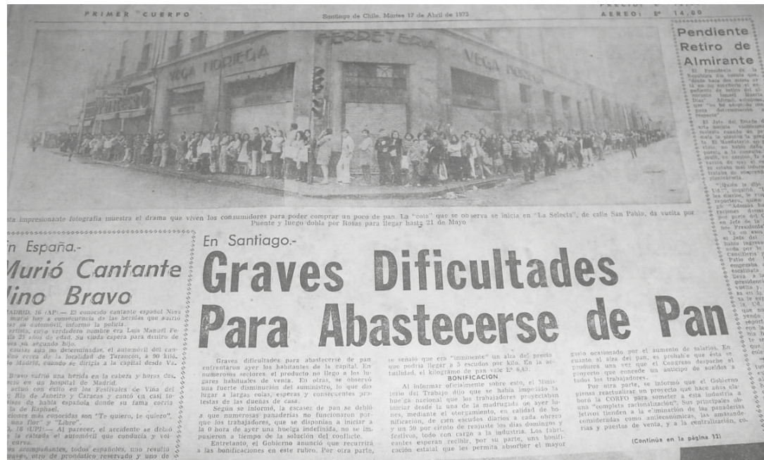
La prensa de Chile en los días previos al golpe de Estado contra Allende.

Si usted fuese granadino y viviese en 1983 en Saint George, ¿a quién culparía del desa-