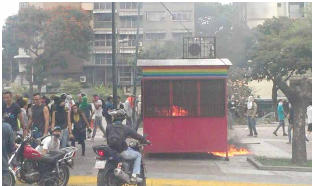
Puesto de control de Altamira fue incendiado.

En horas de la tarde de este lunes 10 de abril, tras una movilización convocada por la autodenominada Mesa de la Unidad (MUD) en la plaza Brión de Chacaíto, grupos de choque se concentraron a la altura de Altamira, en el municipio Chacao, donde atacaron el puesto de control de las unidades de Metrobús, desde donde operan las unidades de transporte a distintas zonas