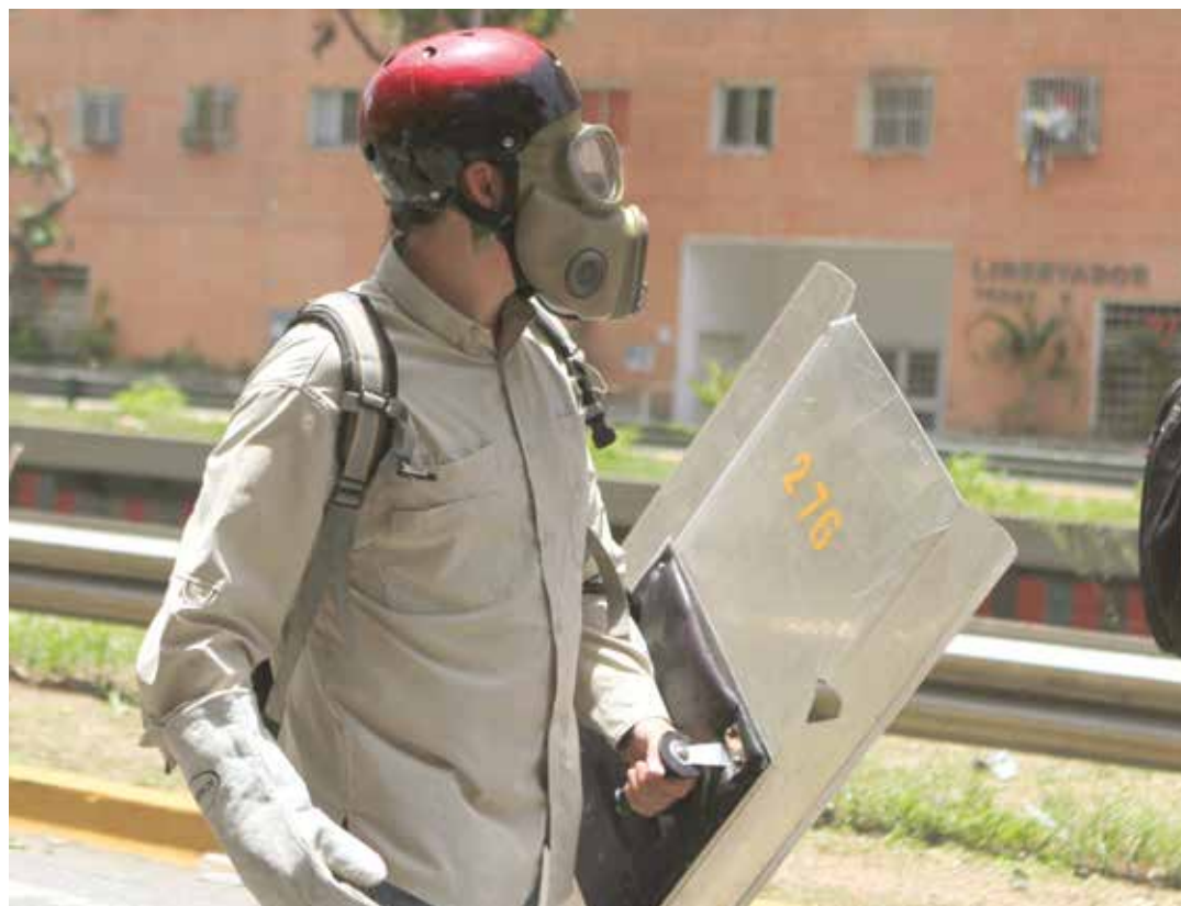
Se pretende aplicar el guión ejecutado en Ucrania.

de forma absoluta el derecho a la manifestación pacífica, impidiendo así la realización de cualquier tipo de reunión o manifestación. Por lo tanto, cualquier concentración, manifestación o reunión pública que no cuente con el aval previo de la autorización por parte de la respectiva autoridad competente para ello, podrá dar lugar a que los cuerpos policiales y de seguridad en el control del orden público a los fines de asegurar el derecho al libre tránsito y otros derechos constitucionales (como por ejemplo, el derecho al acceso a un instituto de salud, derecho a la vida e integridad física), actúen dispersando dichas concentraciones con el uso de los mecanismos más adecuados para ello, en el marco de lo dispuesto en la Constitución y el orden jurídico".