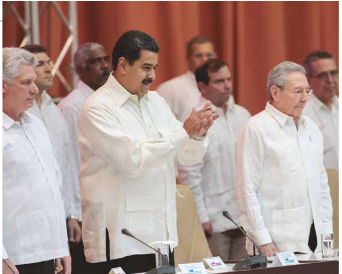
Maduro y Raúl Castro durante el XV Consejo Político de la Alianza Bolivariana para los Pueblos de Nuestra América.

Era previsible que Nicaragua se viera aupada frente los intentos desde el Congreso de los Estados Unidos de aprobar leyes que afecten la economía de la nación nica; o que Ecuador escuchara el apoyo al presidente electo Lenín Moreno y al proceso de cambio social que lleva adelante el Partido Alianza País. Ambos son dos actores