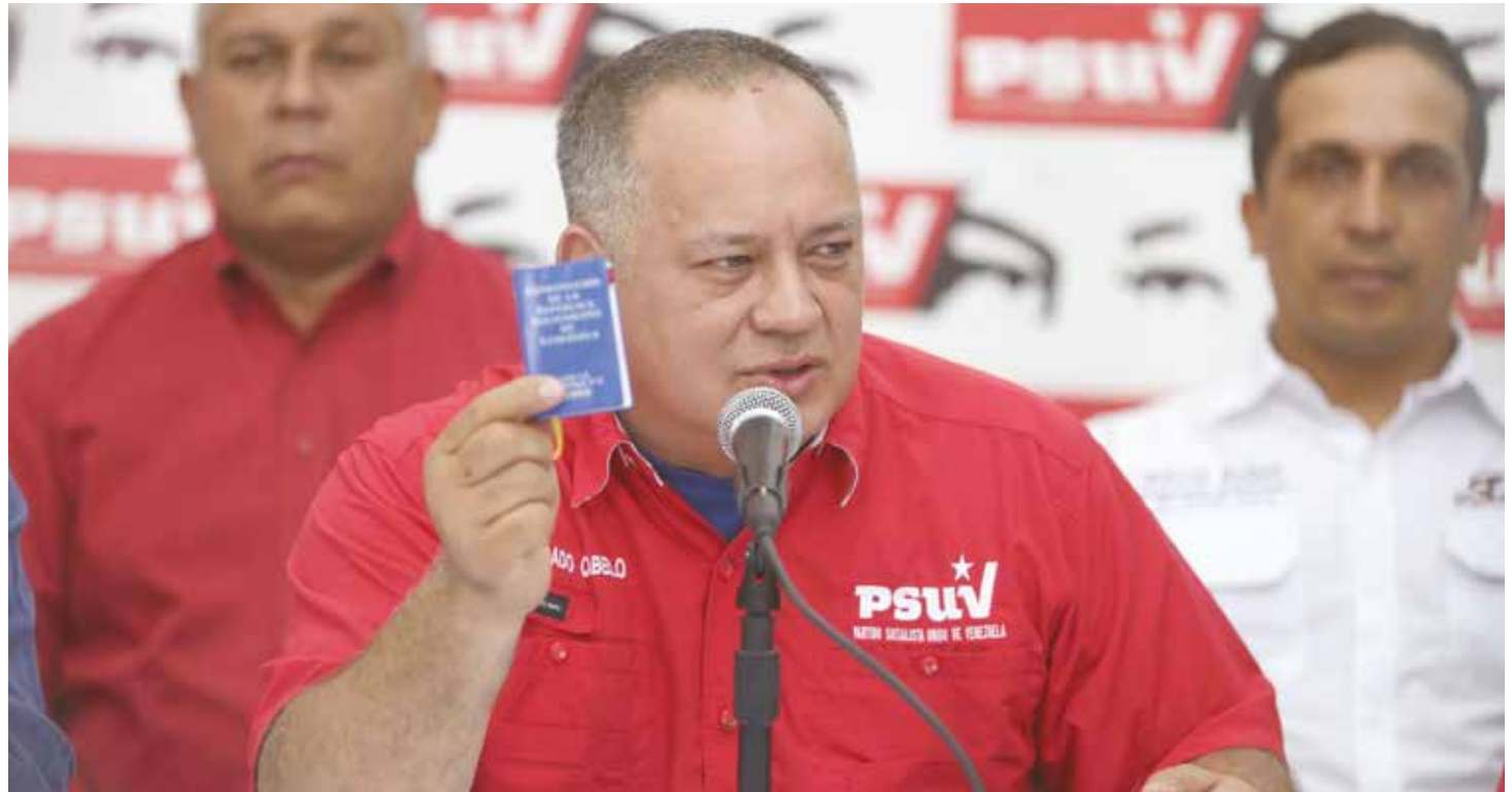
El vicepresidente del PSUV instó a aplicar todo el peso de la ley a los terroristas.

"Que dice la Ley Orgánica contra la delincuencia organizada y financiamiento al terrorismo: 'Aquel acto intencionado que por su naturaleza o su contexto pueda perjudicar gravemente un país... cometido con el fin de intimidar gravemente a una población, obligar indebidamente a los gobiernos a realizar actos o abstenerse de hacerlo, o desestabilizar gravemente o destruir las estructuras políticas fundamentales constitucionales económicas o sociales de un país...' 'por eso nosotros decimos que no son guarimberos, son terroristas' señaló Cabello.