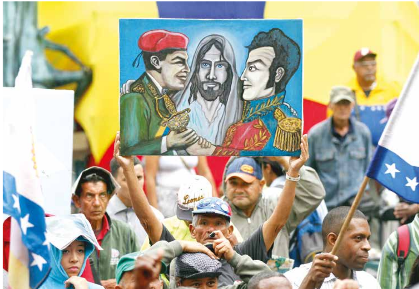
En el Puente Llaguno recordaron a los 19 caídos el 11 de Abril del 2002..

Lo que vivimos en el 2002 es un calque y copia de lo que hoy desean intentar