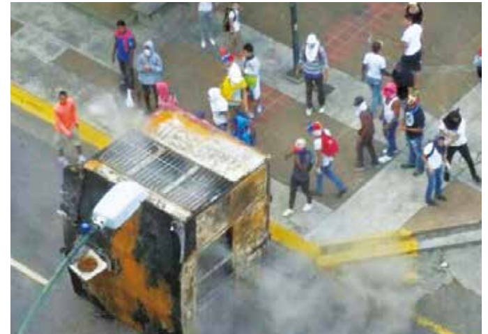
Fascismo contra el sistema Metro de Caracas.