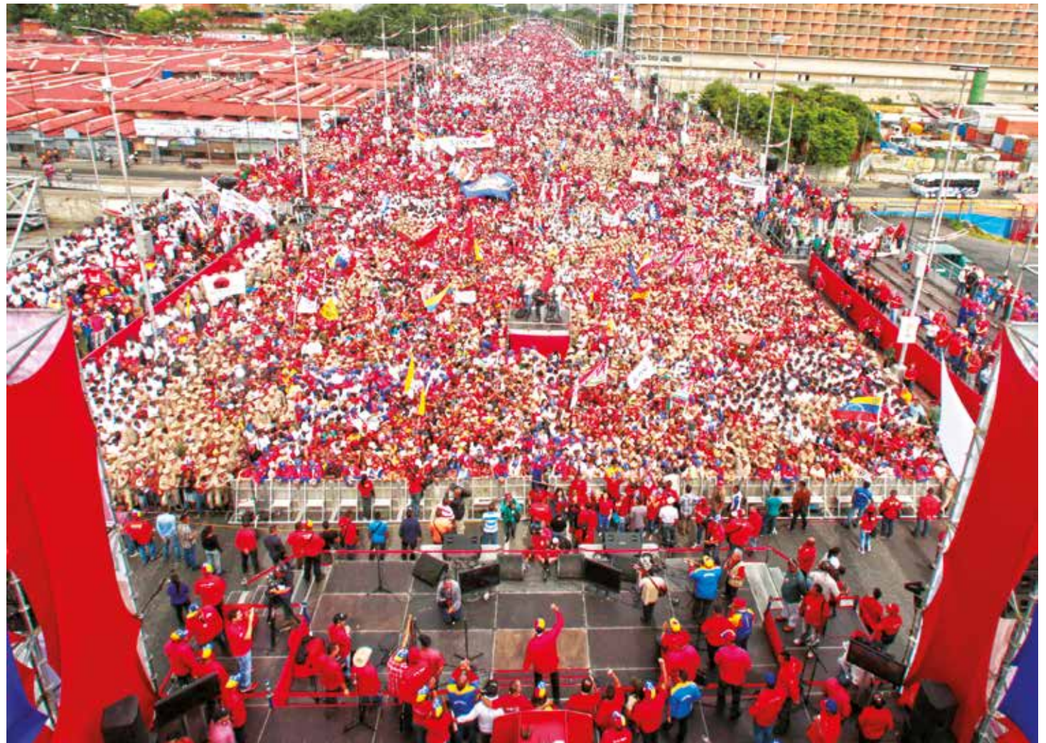
El 19 de abril el pueblo salió en defensa de la Patria.

"Hoy me han respondido por cuatro vías distintas. Están dispuestos a sentarse en el diálogo, me parece justo. Se lo han dicho a importantes personalidades internacionales", reiteró el Mandatario nacional desde el centro asistencial de la Misión Barrio Adentro María Eugenia González, ubicado en Fuerte Tiuna.