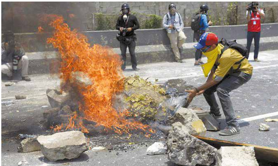
Las mismas tácticas terroristas se usaron en el año 2014.