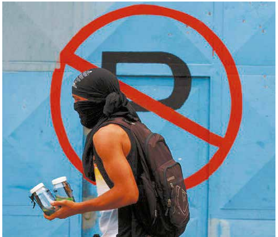
Con bombas molotov incendiaron vehículos que distribuyen alimentos.

Hay tres hechos adicionales que debemos estudiar. Dos ocurrieron el 4 de abril. En