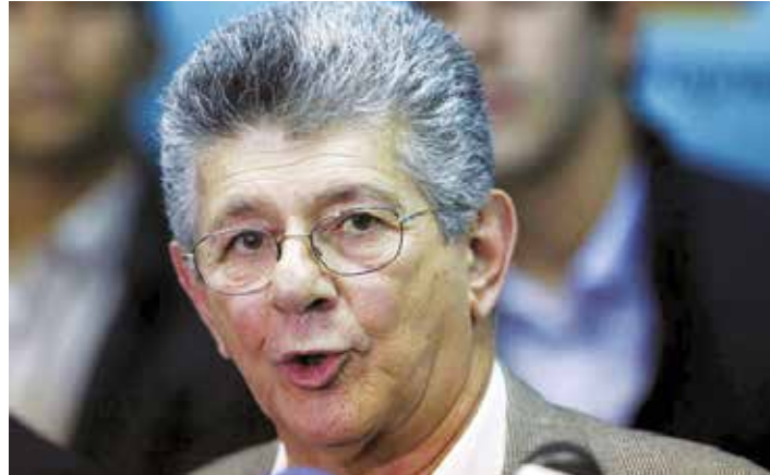
El dirigente adeco vaticina muertes.

El diputado del partido Acción Democrática y expresidente de la Asamblea Nacional, brindó declaraciones con el lenguaje en extremo agresivo y violento que lo caracteriza, en el que volvió a llamar “ladrones, narcoterroristas y asesinos” a líderes del Partido Socialista Unido de Venezuela, como Diosdado Cabello y