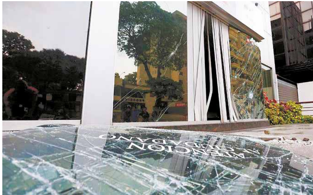
Saqueos y destrozos son parte del plan desestabilizador.

Dada la crueldad del gobierno de Venezuela, el secretario general de la OEA se ha visto precisado a intervenir. Deja para después la situación de los chilenos que no pueden volver a su país por penas de exilio aplicadas por Pinochet y mantenidas luego en gobiernos “democráticos”... Ni hablar de los casi veinte dirigentes mapuches que son presos políticos en ese país, acusados bajo la ley de “seguridad interior del Estado”. El secretario Almagro también deja para luego a los 40 dirigentes sociales que han sido asesinados en Colombia en menos de cuatro meses. Cuando Almagro habla de “ruptura del orden constitucional”, ¿se acordará de hacer algo por Honduras, donde en 2009 hubo golpe de Estado y ya hay más de 120 activistas medioambientales asesinados?