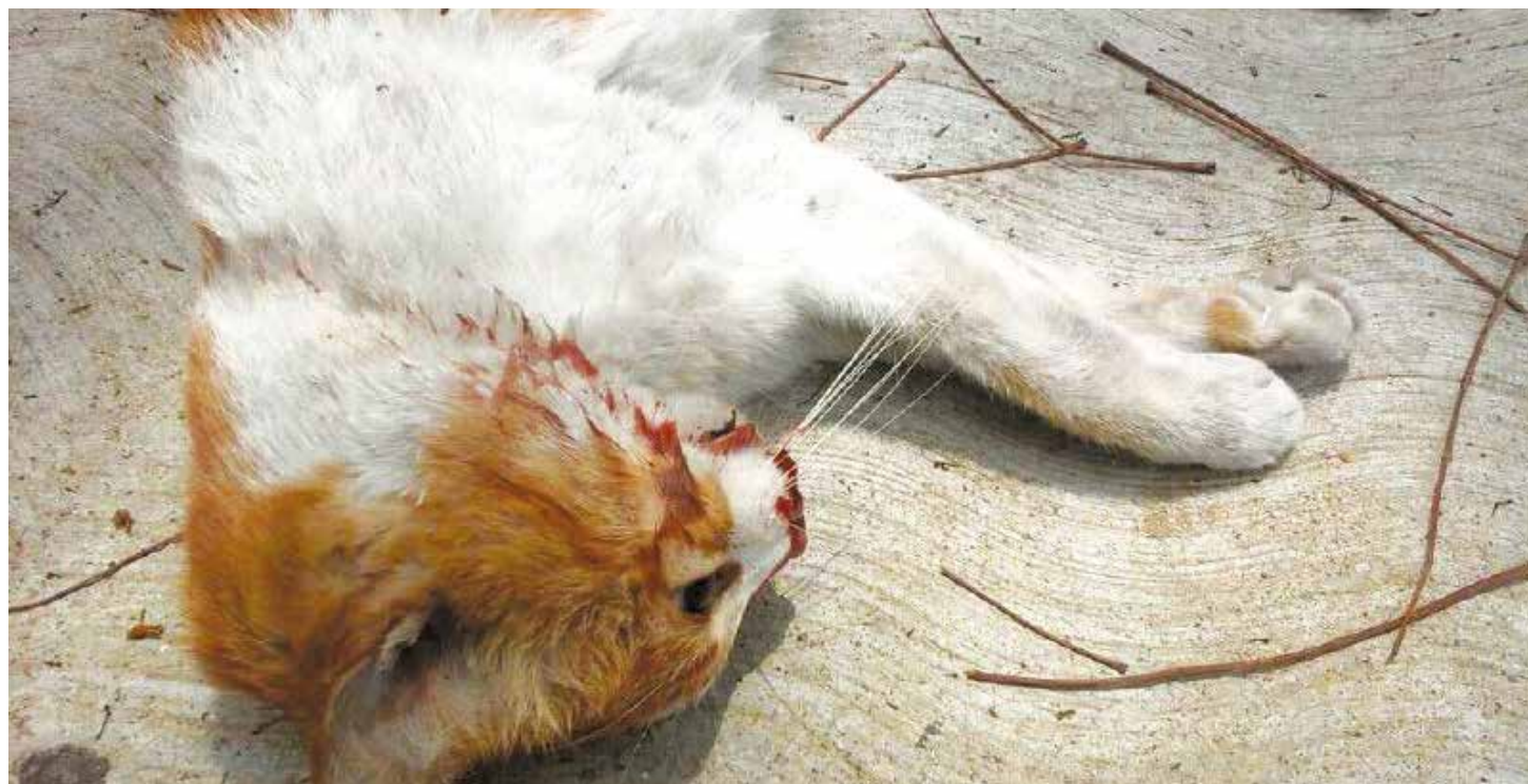
Kity fue asesinada brutalmente.

Descansa en paz querida Kity. Tu no eras ni chavista, ni opositora. Tu no debiste ser una mártir de esta locura que otra vez sacude a Venezuela. •