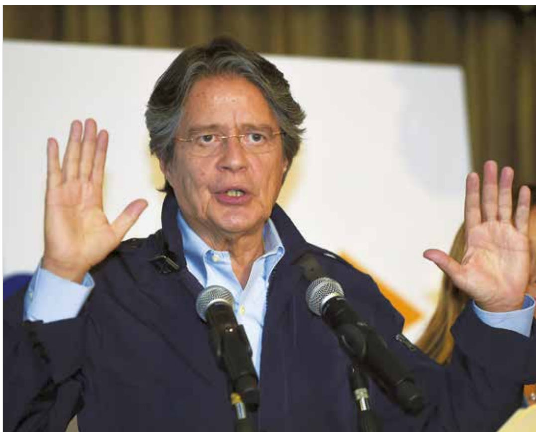
Lasso desconoce los resultados electorales.

La derecha apuntó a la mayoría en la Asamblea y no lo logró. Perdieron la consulta popular sobre los paraísos fiscales y por pocas décimas no son derrotados en la primera vuelta. Gritaron fraude desde antes del conteo y lo mismo hicieron en la segunda vuelta. Hoy esta oligarquía del banquero, desesperada evidencia qué quiere y ya: la recuperación de sus privilegios y nada más. Gene Sharp, el nuevo teórico de las protestas desestabilizadoras proimperiales, recomiendo leerlo y analizarlo. El proceso no será corto. Ellos han traído, repito, el modelo venezolano de desestabilización. Una especie de guerra de baja intensidad en las calles, destinada a minar la autoridad, el estado de derecho y la institucionalidad. Con los millones que tienen, aspiran a comprar la presencia popular, sostenerla, generar algún asesinato para culpar al gobierno y en base a una o varias mentiras sostenidas desconocer todo respeto a la Constitución, todo orden constitucional. Eso es todo. No hay debate, no hay recuento de votos, no hay búsqueda de otra cosa que no sea volver a los privilegios.