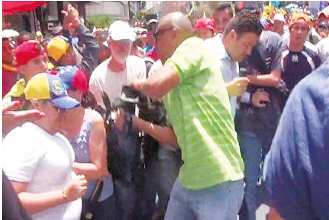
Periodistas de medios públicos y privados han sido víctimas de amedrentamientos.

Pretenden coartar la libertad de expresión