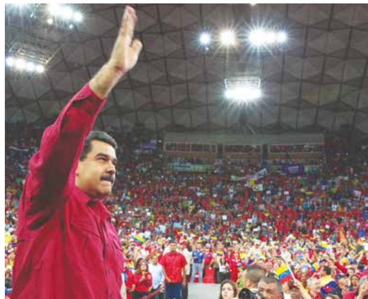
El camino es la Constituyente.

“El camino está claro y eso debemos tomarlo desde nuestro corazón, porque todo lo que hacemos lo realizamos por amor, por el amor de un futuro de nuestros niños y niñas que nos abrazan, de los niños y niñas que a pesar de este ataque violento y armado desde abril hasta la fecha, no perdieron el año escolar porque le garantizamos todo y están terminando de manera exitosa. ¡Danos las fuerzas Dios para garantizarles a los niños que tengan Patria para siempre! •