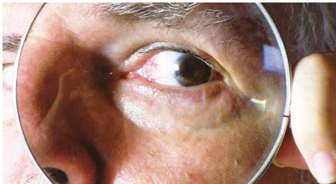
La Asamblea Nacional Constituyente puede generar procesos contra el robo del erario público