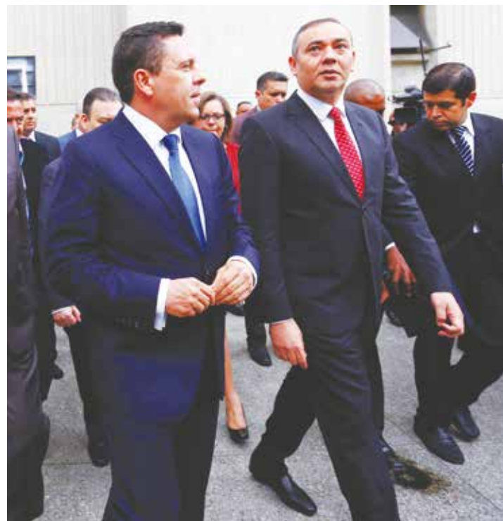
El Ejecutivo denunció la actuación de multinacionales mediáticas

Denunció que es la figuración terrorífica que persiguen