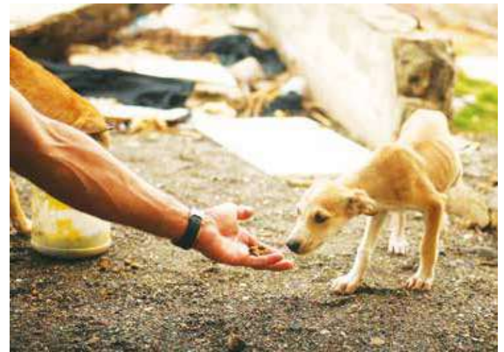
Hay que respetar los derechos de los animales.

El Artículo 11 de esta declaración, expone que "todo acto que implique la muerte de un Animal sin necesidad es un biocidio, es decir, un crimen contra la vida". Y el artículo 14 de la misma declaración se define que los organismos de protección y salvaguarda