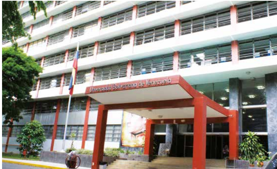
La Constituyente debe propugnar una transformación del sector universitario.

Los diseños curriculares en todos los programas de formación de grado (o carreras, como competitivamente suelen llamarse) están plagados de un universo epistémicamente eurocéntrico. Conocimientos emanados exclusivamente de países de la Organización de Terroristas del Atlántico Norte (OTAN): Estados Unidos, Inglaterra, Alemania, Francia e Italia, llenan las cabezas de los estudiantes, como decía Daniel de León, de "novecientos noventa y nueve baúles de basura insufrible" que alejan a los alumnos de su identidad nacional convirtiéndose en personas que difícilmente puedan "recobrar la dignidad de la especie homo sapiens, para volver a ser hombres y no pervertidos mentales". Hay que reparar esta injusticia epistémica e incorporar a los pensadores de las naciones del Sur del mundo. Entre estos pensadores hay que reivindicar a Simón Rodríguez, cuyos libros deben ser consultados permanentemente en Latinoamérica y el Caribe. Nos dice que los profesores universitarios y los estudiantes, así como "los presidentes,