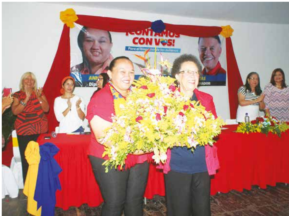
María en su infinita gesta feminista.

Para León su primera preocupación sobre las niñas, niños y jóvenes es que se adopte el modelo de educación de Simón Rodríguez: “La escuela trabajo para que todos nos ocupemos de formar a los niños para la independencia como lo previó