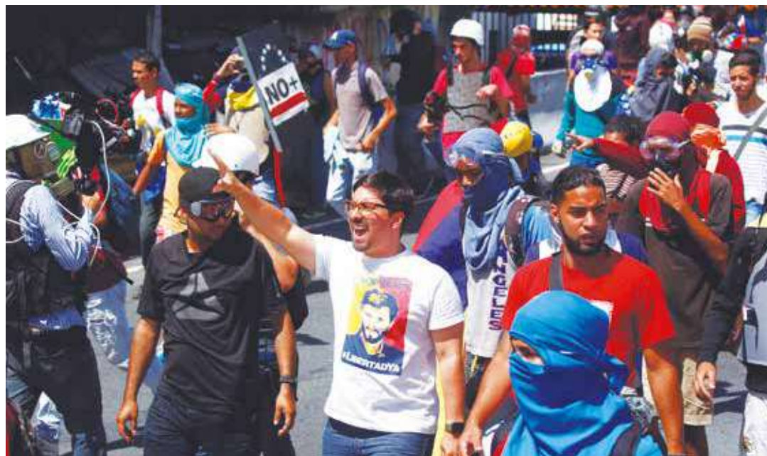
Guevara y su ejército terrorista.

Muchos medios de comunicación prefieren hablar de los