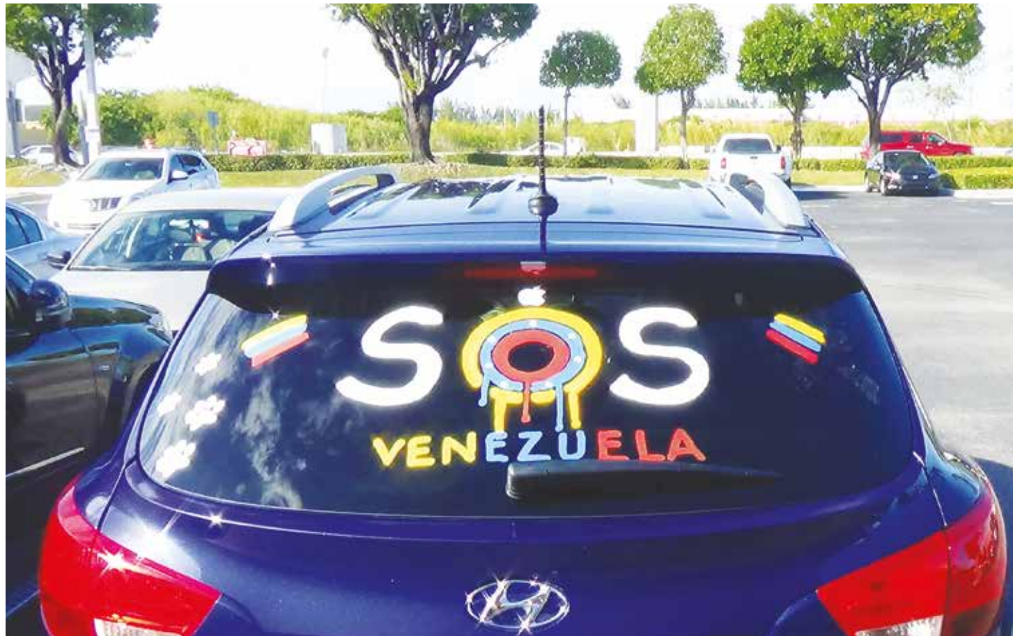
La oposición reiteradamente ha pedido que invadan a Venezuela.

La Asamblea Nacional Constituyente debe prever las sanciones que habrán de aplicarse contra quienes solicitan invasiones contra Venezuela