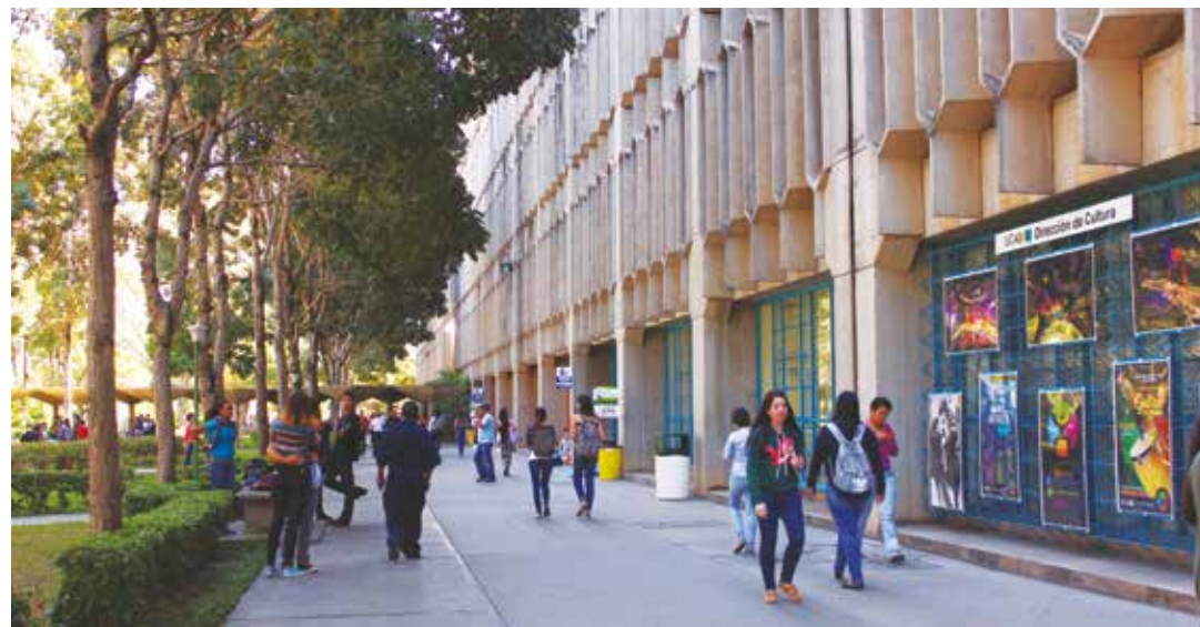
La universidades deben promover la soberanía y la paz.

A pesar de que en nuestros suelos se encuentran los elementos de la tabla periódica aún no somos capaces de producir la materia prima que necesita nuestra industria