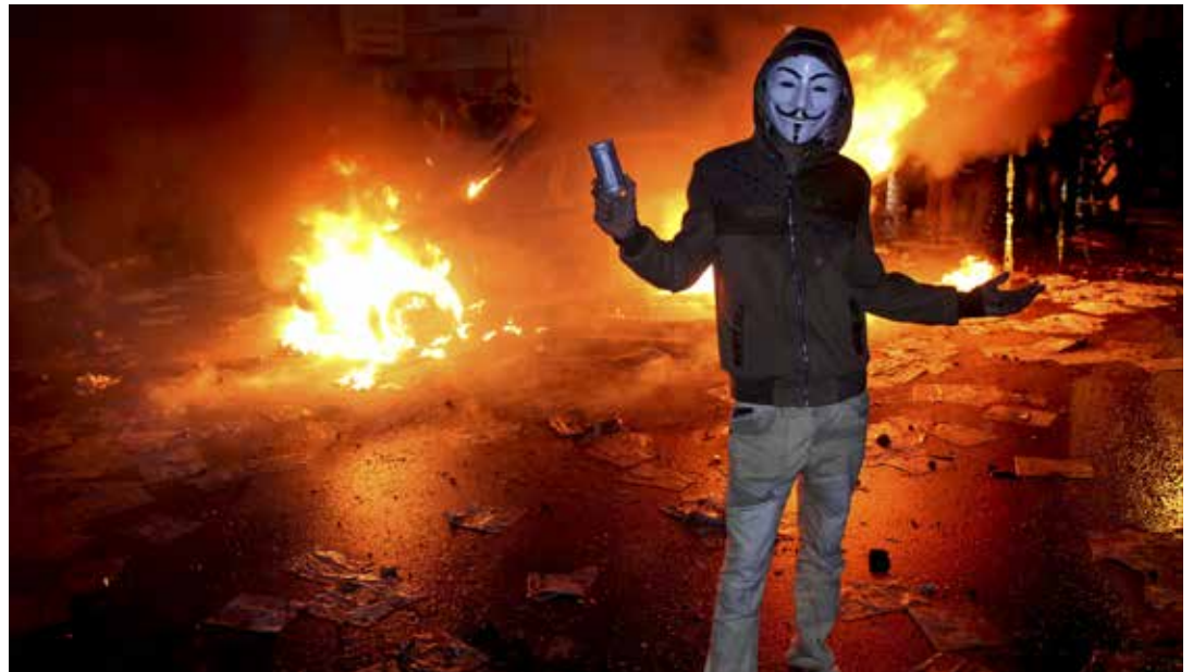
Se promueve el odio en Venezuela.

La rabieta de Orlando se convirtió en un estallido que destrozó puertas, bombillos y la reja de la entrada. También salieron volando sus juguetes: metras, guayas, clavos, miguelitos. NARRADOR: ¡Suficiente! -