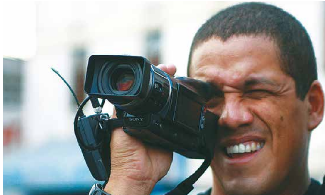
Mi única arma es mi cámara.

–Allí nos encontramos con un grupo de diputados de la oposición encabezados por Freddy Guevara, José Manuel