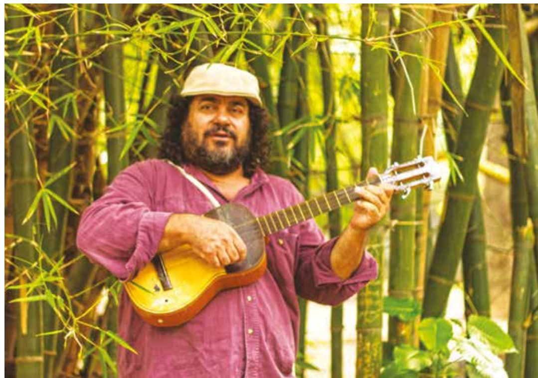
Somos un buen ejemplo para los pueblos del mundo.

El pasado domingo 16 de julio en el simulacro electoral se demostró que esa probabilidad no tiene opción. La gente saldrá a votar. Independiente-