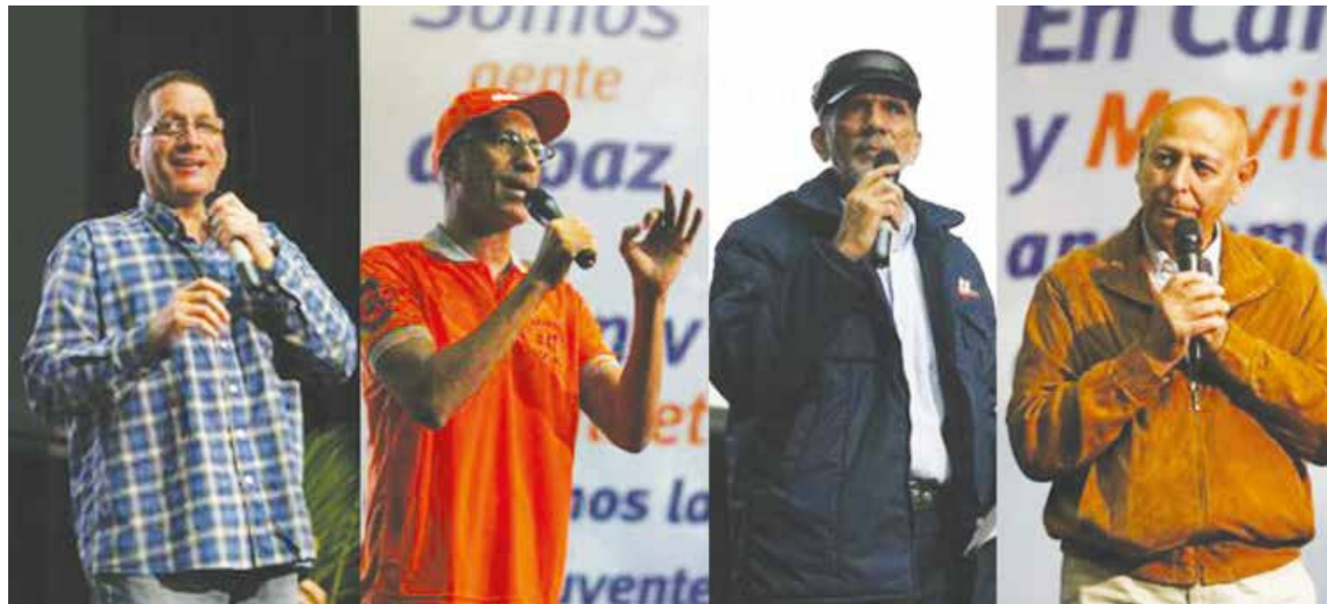
Candidatos en defensa de la paz.

Para el candidato no cabe duda de que este golpe que se ejecuta en cámara lenta es por petróleo, por lo que recordó que en abril de 2002 el golpe de estado fue dirigido por la televisión, pero hoy esa vanguardia cambió y se está ejecutando a través de las redes sociales orquestada desde el imperio, que a través de su propaganda de guerra ha promovido el odio entre los venezolanos, han dividi-