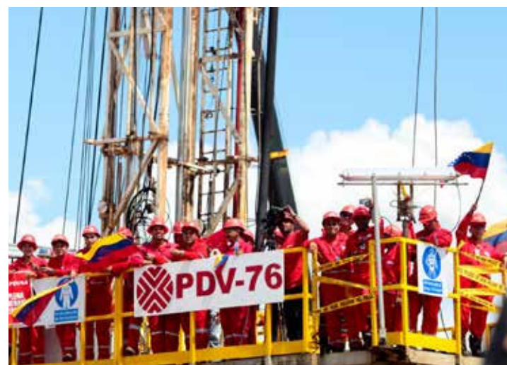
Venezuela avanza hacia su soberanía petrolera.

No obstante, debido a las amenazas del gobierno de