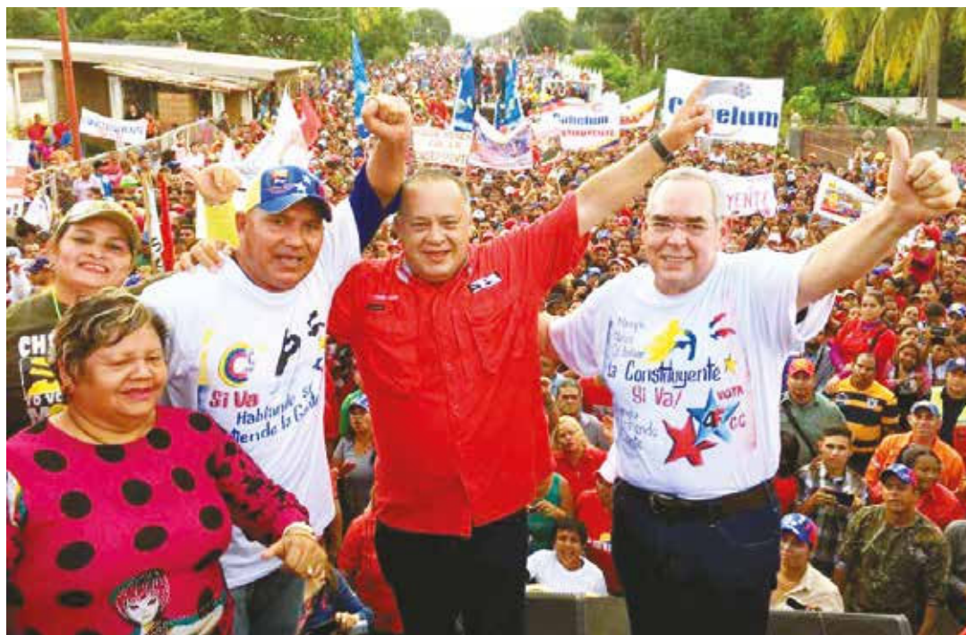
Cabello: organización para el 30 de julio . FOTO ARCHIVO

paro el pueblo bolivariano se va asustar, creen ellos que porque tienen grandes medios de comunicación, los chavistas se van a desaparecer. Rondón debe demostrar ahora mucha sabiduría y paciencia, mucha sangre fría. Nadie debe desesperarse, batalla que nos toque dar, batalla que debemos lograr una victoria”.