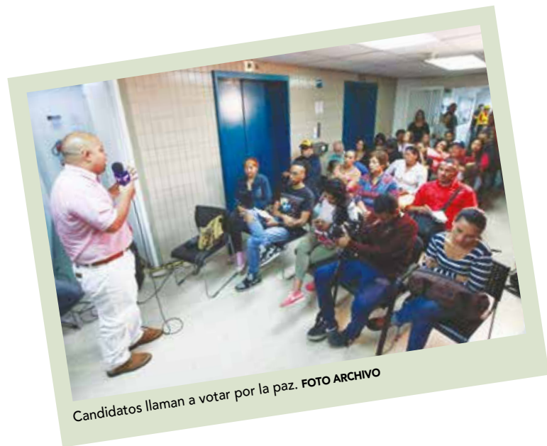
Candidatos llaman a votar por la paz.