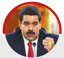
Presidente Maduro sobre ataque a VTV

Tampoco se había pronunciado ninguno de los llamados "líderes" de la derecha ni del Colegio Nacional de Periodista (CNP) y ni siquiera la Conferencia Episcopal Venezolana (CEV), quienes no han levantado su voz para condenar el ataque contra un medio de comunicación en Venezuela, tal como ocurrió en 2002, cuando el gobernador opositor de Miranda, Enrique Mendoza, ocupó y cerró VTV con su cuerpo policial armado, en una acción que facilitó el golpe de Estado de Pedro Carmona Estanga. •