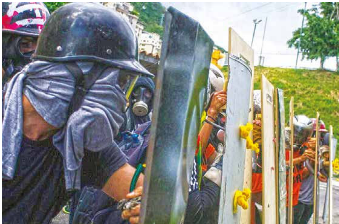
La violencia al servicio de fuerzas apátridas

La misma estrategia les había resultado exitosa en Colombia en 1903, cuando le cercenaron Panamá. En efecto, el 3 de noviembre de ese año, el Concejo Municipal de la Ciudad de Panamá, azuzado por EE.UU, se reunió bajo la "voluntad del pueblo de ser libre y de establecer un Go-