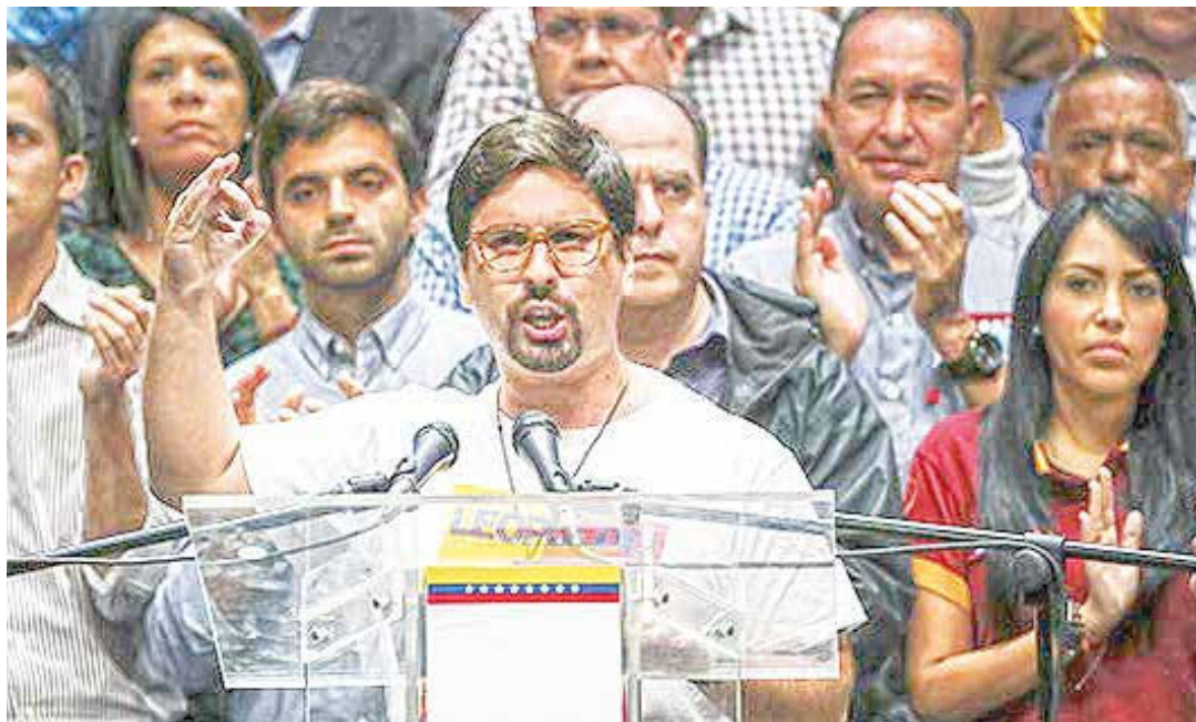
La irresponsabilidad política condujo a la oposición a uno de sus mayores fracasos.