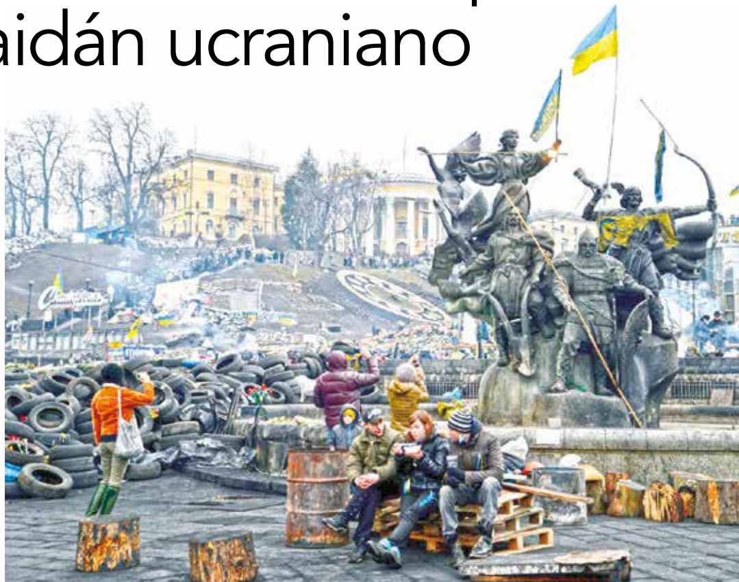
Tratan de replicar el modelo ucraniano.

Este relato puede ser adaptado con exactitud a lo que ha ocurrido en Venezuela desde abril de 2017. Las mismas máscaras, la misma armadura y el mismo armamento es el que utiliza la vanguardia de lo que la oposición ha dado en nombrar "la resistencia". Pero no solo se trata de haber copiado la imagen