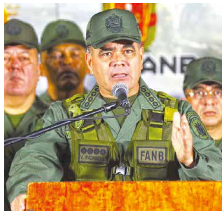
Ministro Padrino López.

También denunció que en este sentido hay un empeño