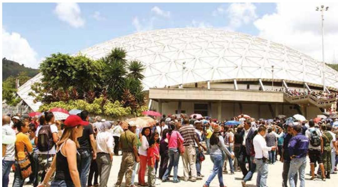
El efecto Poliedro demostró la vocación democrática del pueblo venezolano.

Tampoco es la expresión de las expectativas y necesidades de la mayoría o de los principales sectores del país. Ni siquiera de los sectores dominantes.