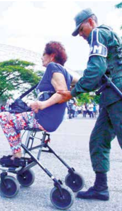
En una verdadera fiesta democrática, el pueblo venezolano se desplegó por todo el país atendiendo al llamado del CNE para conformar una Asamblea Nacional Constituyente, venciendo las adversidades generadas por la violencia terrorista que desató el ala extrema de la oposición.

de los “comunicadores” del sistema. Queda reafirmada la Revolución, el liderazgo de los de abajo, los poderes comunales, la fuerza indestructible de la unidad pueblo y ejército, el mandato de Nicolás Maduro y por sobre todo el legado de Hugo Chávez Frías. Todos estos elementos se combinaron para que las mujeres y hombres de Venezuela se sintieran más bolivarianos que nunca y se echaran la mochila al hombro para salir a votar. Vencedores, alegres y rebeldes, auténticos resistentes