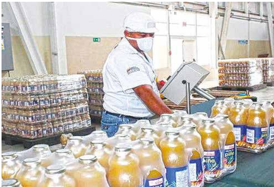
Hay que resolver los problemas económicos con urgencia.

Los intereses particulares no son exclusividad de la burguesía parasitaria. No olvidemos lo que nos dice Mao Tse Tung sobre el corazón burgués que habita en algunos revolucionarios, sobre todo en el sector empresarial que forma parte del cuerpo constituyente y de algunos personeros que han hecho negocios en cargos públicos. Ambos grupos intentarán proponer artículos, párrafos, oraciones e ideas que favorezcan y cuiden sus actividades comerciales. Por ello, la actitud de las voceras y voceros de los movimientos revolucionarios debe ser radical. Debe dejarse a un lado la tibieza política. Solo la radicalidad es garantía para emprender la verdadera transformación que, como lo dice Rodríguez, debe arrancar desordenando la economía que sigue anclada a viejas