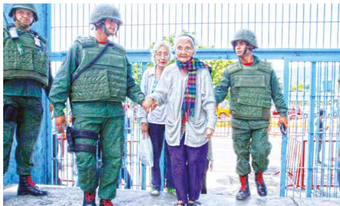
Los adultos mayores salieron a defender la democracia.

Indicó que al menos 21 funcionarios de seguridad resultaron lesionados con armas de fuego en distintos eventos que están siendo investigados. •