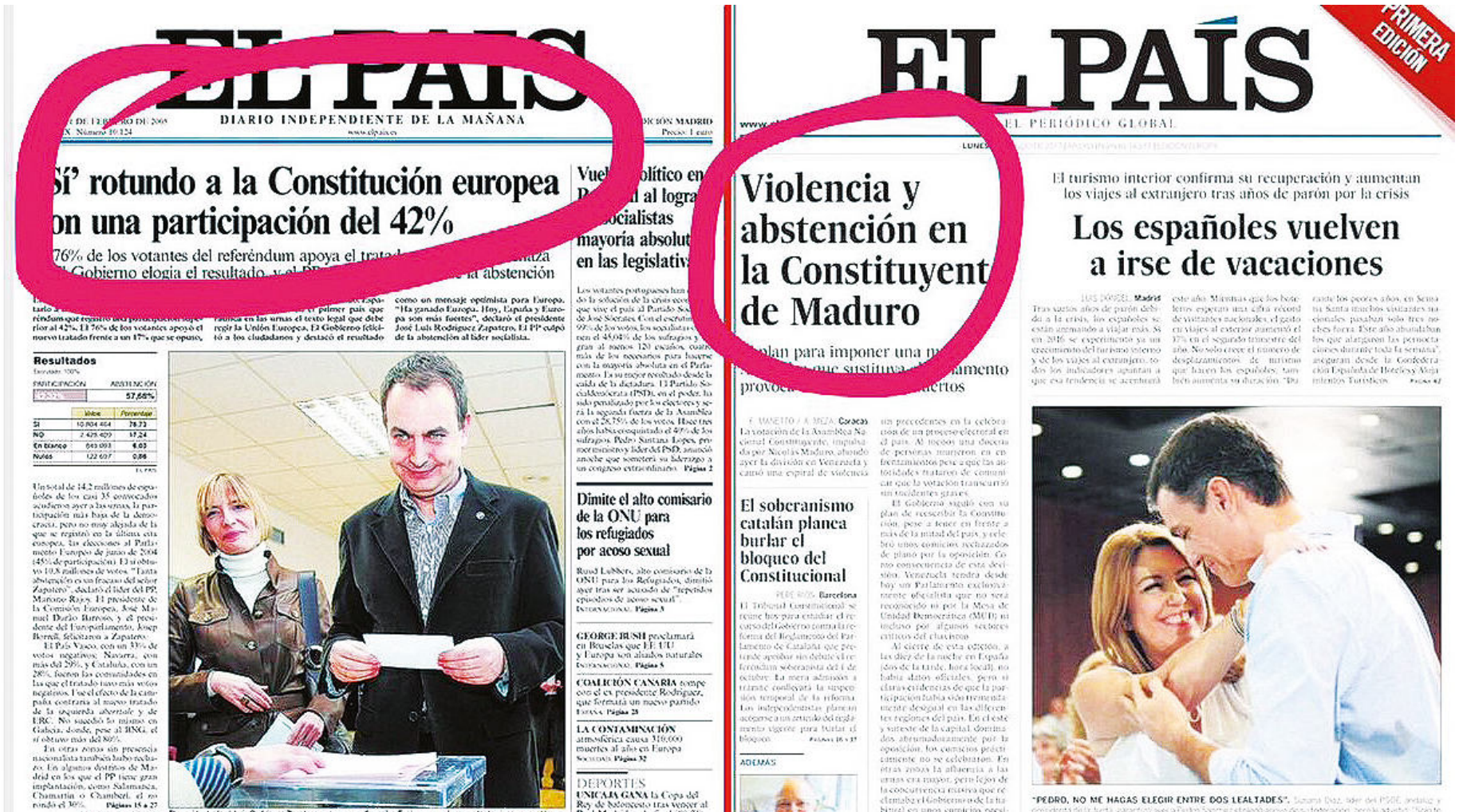
Dos países, igual nivel de participación electoral. En España es un triunfo, en Venezuela un fracaso por efecto de la postverdad