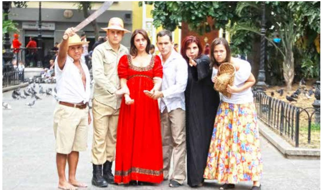
Comunicalle celebra cuatro años.

No sé que tanto pude haber disimulado la emoción que me produjo el estar recibien-