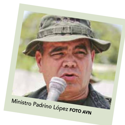
Ministro Padrino López

mos respirando. Y se refleja y se concretiza cuando ha sido amenazada por el imperio norteamericano con la más grosera de sus expresiones ofensivas, se ha atrevido el imperio a poner sobre la mesa la opción militar y eso es inadmisibles".