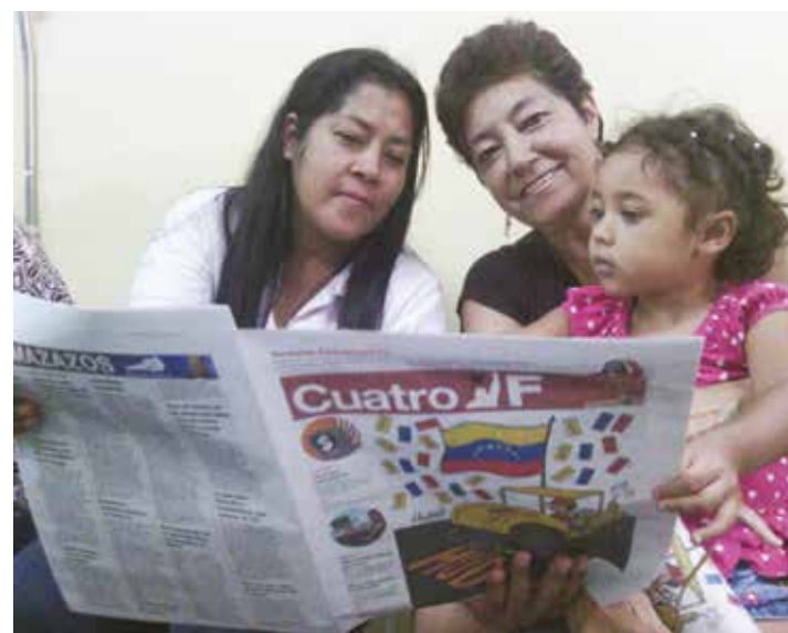
La comunidad se organiza.

"Estamos haciendo el trabajo de fortalecer la producción. En la parroquia El Paraíso hay 81 CLAP y 81 proyectos productivos enfocados en agricultura animal, vegetal, proyectos textiles, elaboración de productos de higiene personal y panaderías CLAP. Queremos lograr que Caracas sea productiva, para ello se instaló junto con el Estado Mayor de los CLAP y el Gobierno de Distrito Ca-