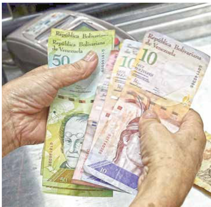
Atacan el bolsillo de los venezolanos.

En tal sentido, de manera respetuosa, someto a los y las constituyentes algunos temas recogidos del debate diario, y macerados sobre los errores y aciertos cometidos, que pudieran convertirse en acciones inmediatas a través