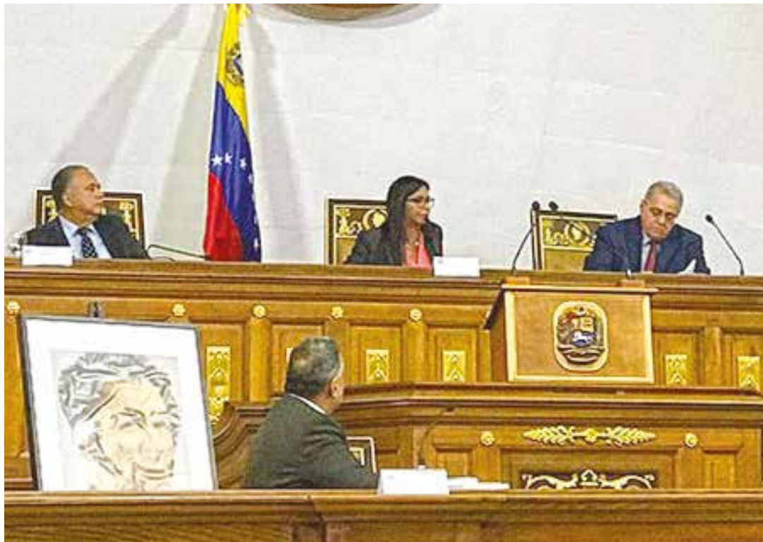
ANC asumió algunas funciones de la Asamblea Nacional.