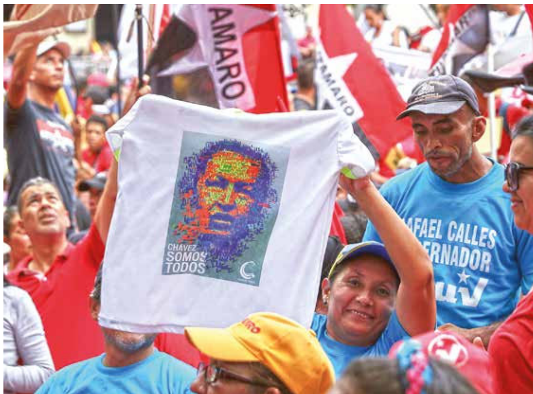
El pueblo quiere paz y democracia.

"Vamos a ganar las 23 gobernaciones con una alianza perfecta. Tenemos los mejores candidatos mientras la MUD inscribió 198 aspirantes, todos divididos por su lado"