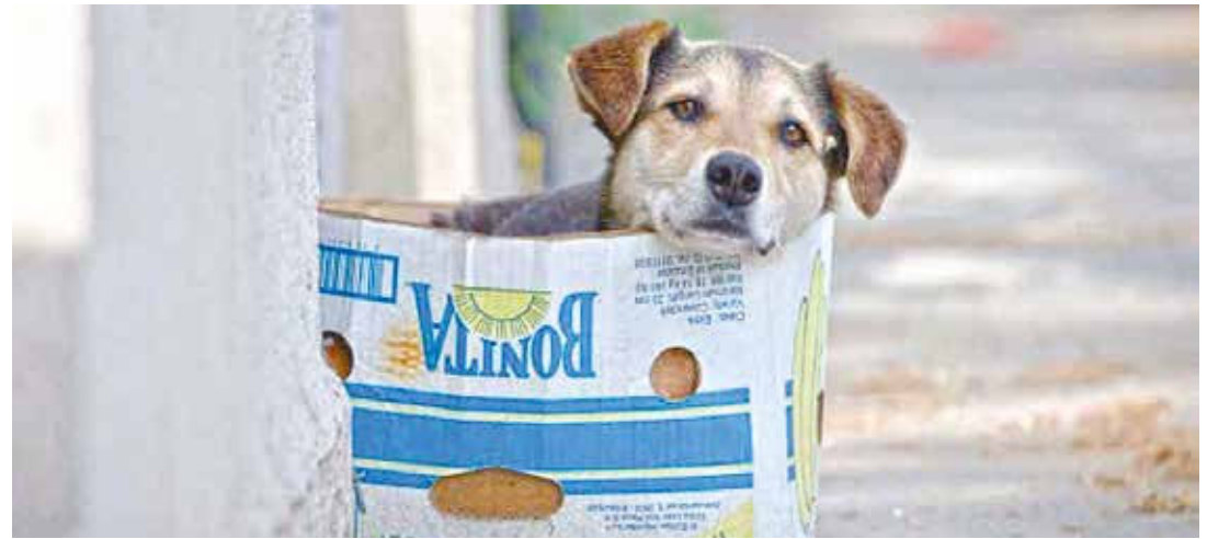
Hay que garantizar los derechos de los animales.

La Ley requiere de una discusión pormenorizada en la que se recoja la experiencia de la Misión Nevado, que jun-