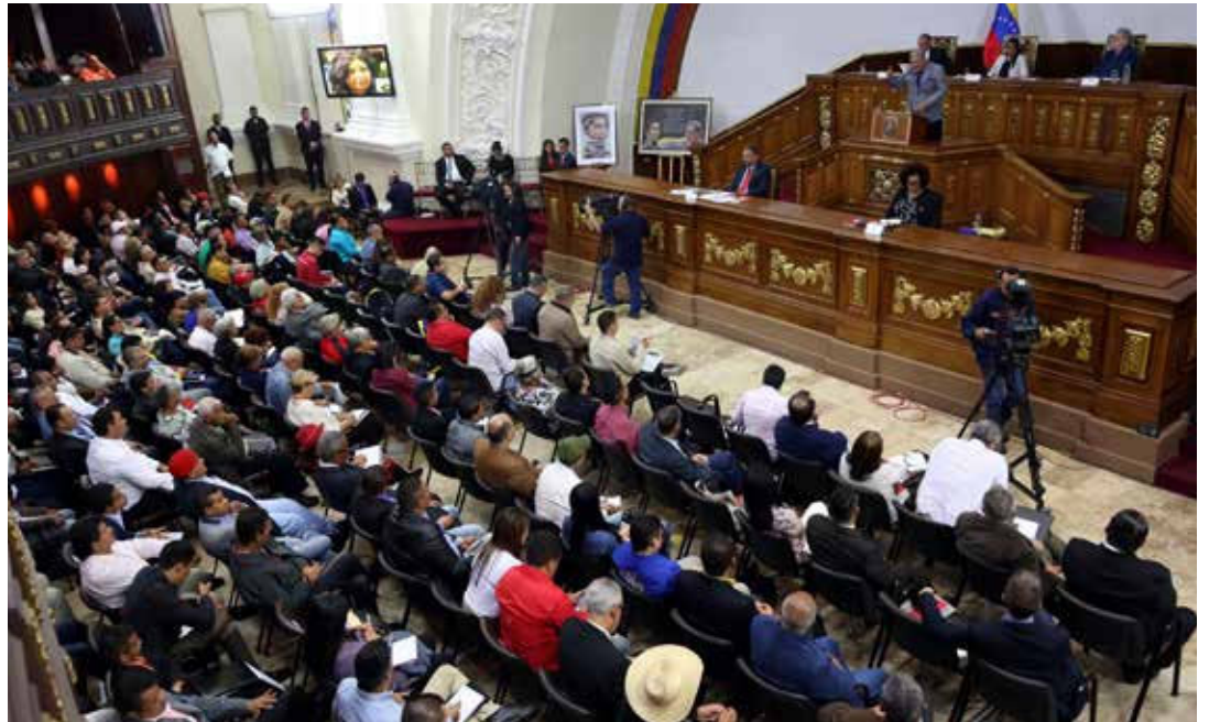
ANC enfrentará coyuntura económica.