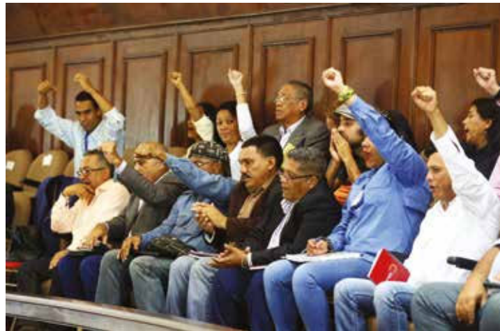
Hugo Chávez está presente.

Porque esto que está pasando y que ha arrojado a Venezuela toda y que, de paso, es faro para el mundo, sigue siendo culpa de Chávez... •