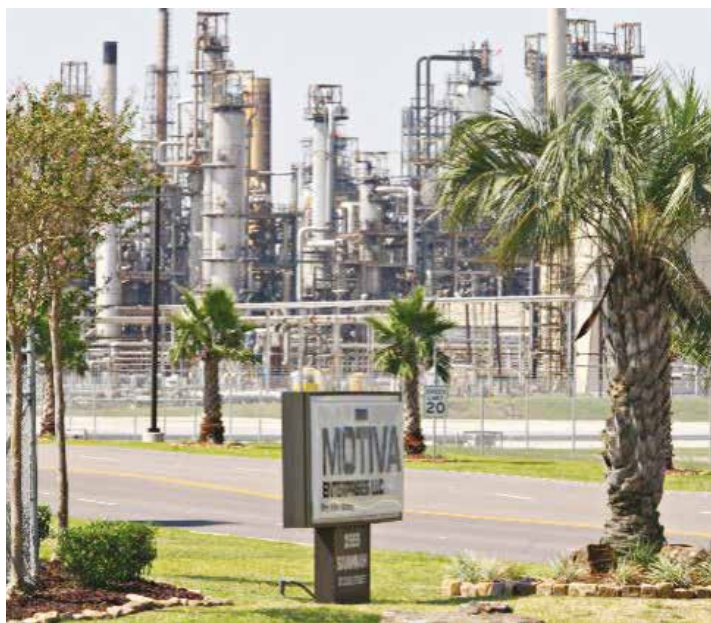
Sanciones podrían revertirse contra sus autores

A la luz de los acontecimientos recientes y el rol activo que ha tenido la administración Trump en la guerra económica contra Venezuela, necesario es entender que no hay casualidades. Todo este entramado de situaciones y eventos forma parte de un maniobra política con actores claramente definidos. •