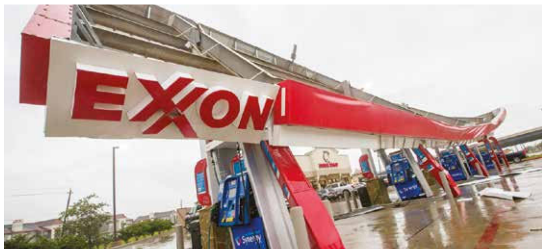
La infraestructura energética fue seriamente dañada.