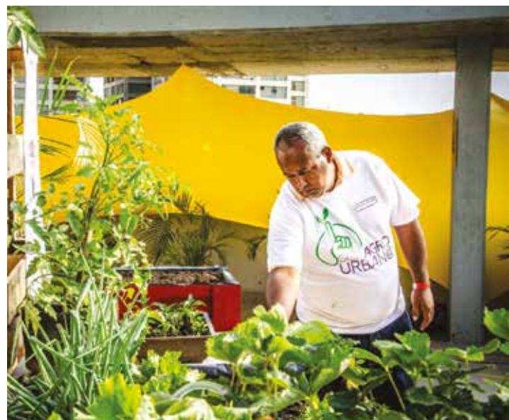
Sembrar es hacer patria.

Finalmente informó que está en marcha el "Plan Cayapa Recursos Naturales", que es un operativo destinado a la fiscalización de las empresas explotadoras de minerales no metálicos en tierras pertenecientes al organismo. •