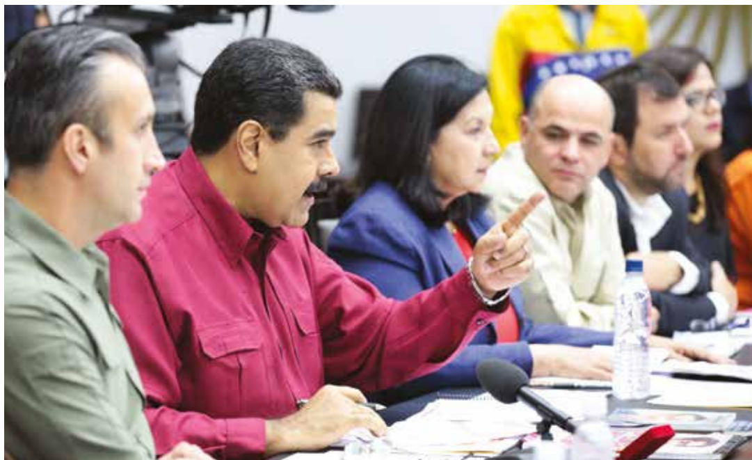
El presidente pidió castigos ejemplarizantes.

“Una clase política que pide la intervención de su país es condenable totalmente y tipifica el delito. Una clase política que pide intervención militar contra el país está traicionando a la República. Una clase política que pide bloqueo para afectar al pueblo, a la población entera, está configurando, está traicionando los valores de la patria” señaló recientemente la presidenta de la Asamblea Nacional Constituyente, Delcy Rodríguez.