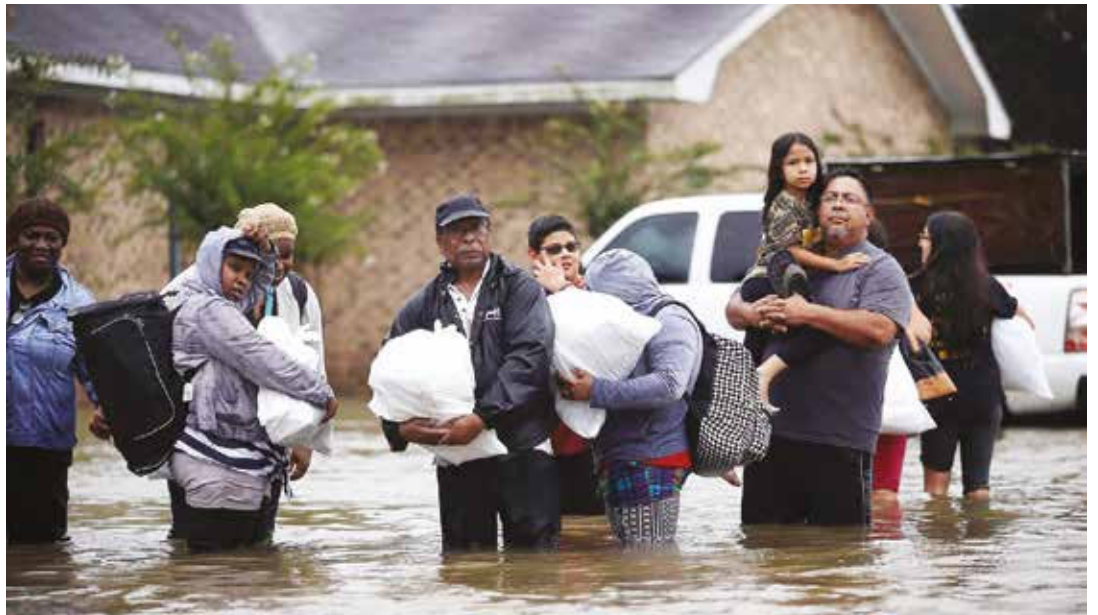
Los pobres han sido los más afectados por el huracán.

Le toca al propio pueblo de los Estados Unidos sufrir las dramáticas consecuencias del calentamiento global, que intentaba mitigarse con el Acuerdo de París, que Trump repudió a principios de este año. •