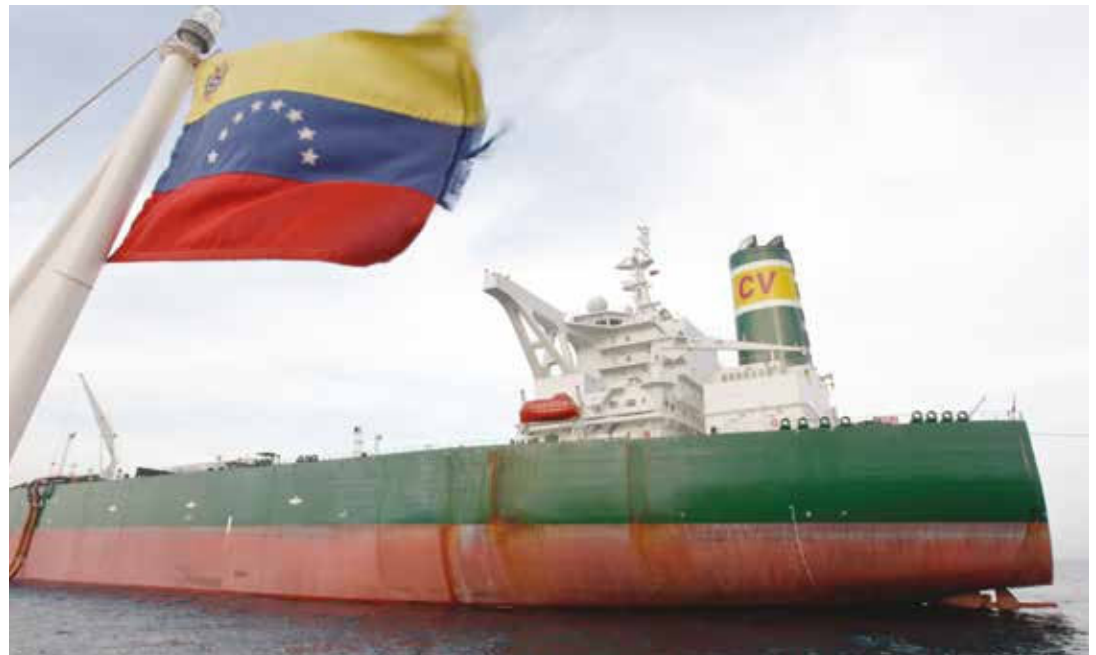
Se ha intentado sabotear embarques de crudo.

En un acto de encubrimiento informativo por la situación real del tanquero