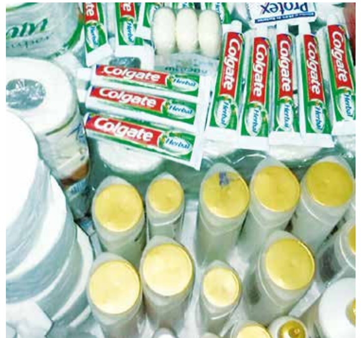
Los 50 en el ojo del huracán.