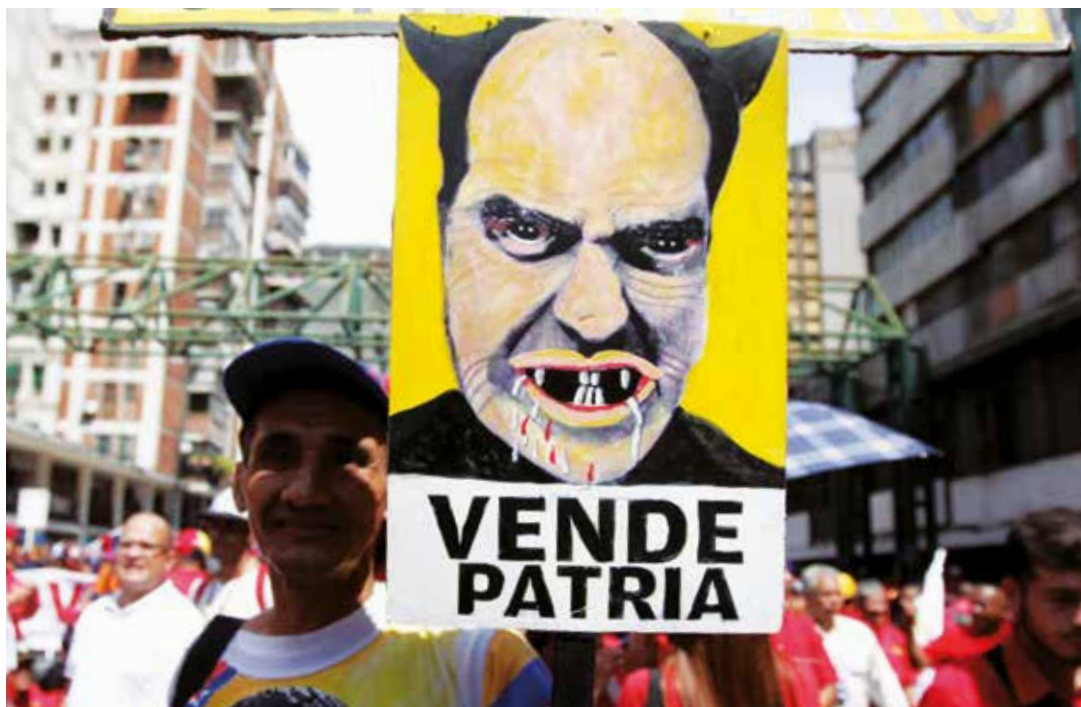
El imperio tiene aliados locales.

con la Asamblea General de la ONU y con la agresión del nuevo "Hitler" de la política imperial "el magnate se cree dueño del mundo, pero a Venezuela no la agrade nadie".