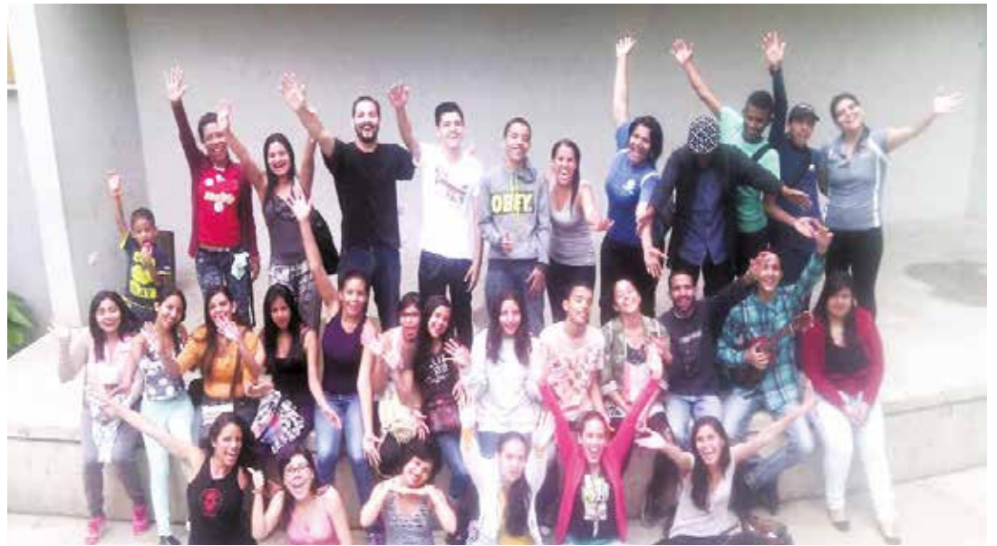
Los jóvenes en acción.

Allí, a la sombra de sus árboles y favorecidos por el acogedor clima que nos acompañó durante los cuatro días de actividad, las y los facilitadores de Comunicarle compartimos saberes en las disciplinas de actuación, expresión corporal, estatismo, música y creación plástica; que serán algunas de las áreas que el naciente "Chambearte Los Teques" comenza-