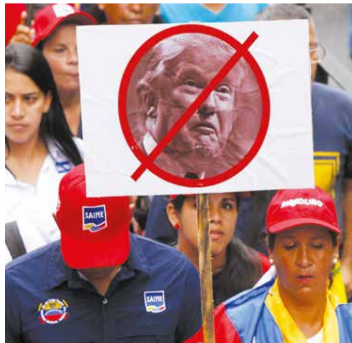
Trump no conoce a los venezolanos.

Tenemos fuerza, poder económico y el apoyo del mundo nuevo para que no nos hagan daño con sus sanciones aseguró el primer mandatario. Explicó que el evento Todos Somos Venezuela, coincidió