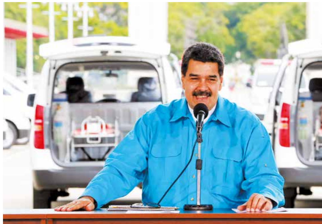
Maduro explicó que Venezuela es un excelente pagador.

Hemos pagado la deuda externa siempre, nuestra intención es que cese la persecución financiera contra Venezuela