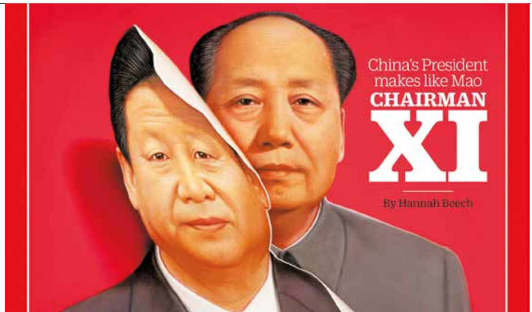
Xi ha sido equiparado con Mao.

Este último ha sido renovado en casi su totalidad. Solo han quedado Xi y su primer ministro Li Keqiang, mientras que los otros cinco miembros fueron reemplazados. El Comité Permanente saliente había sido heredado de la administración anterior, mientras que la nueva composición ha sido designada por el jefe de Estado.