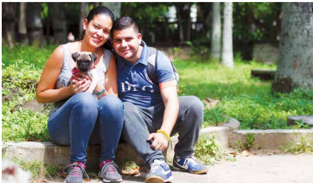
Nuestra capacidad de amar debe ser infinita.

En Perú, las penas van hasta 5 años de cárcel por matar animales domésticos y/o silvestres que estén en cautiverio y de 2 años por maltratar o someter a los animales a realizar actividades ajenas a