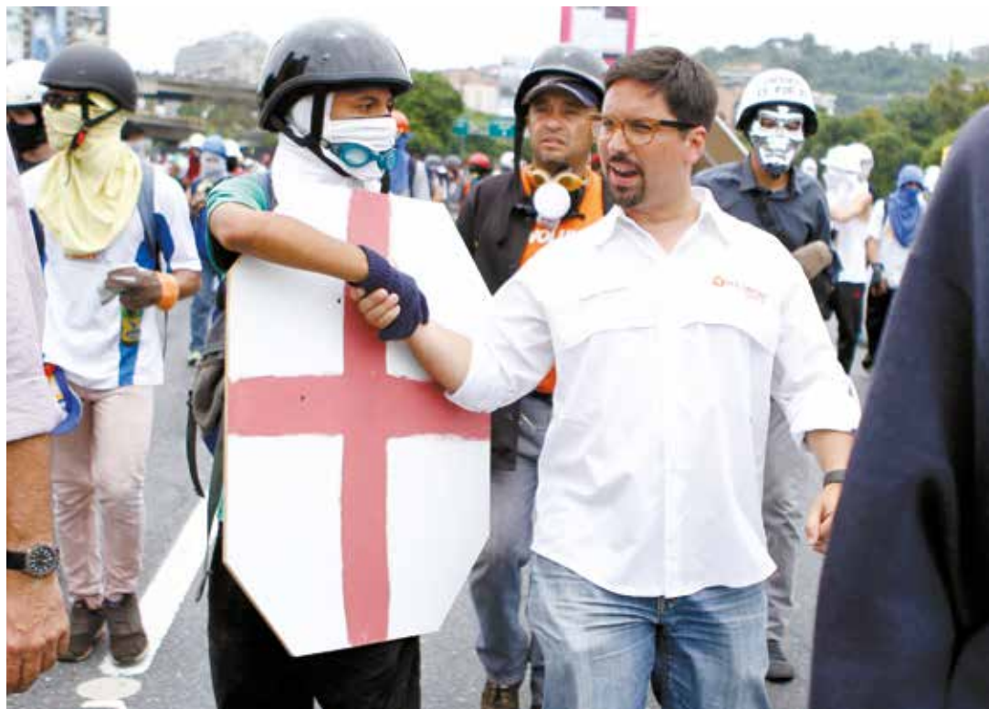
Guevara en su cruzada guarimbera, ahora debe responder a la justicia.

"Los ultras discrepan abiertamente, al considerar que con la actual estructura institucio-