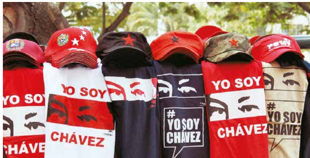
Venezuela es el Stalingrado de nuestros tiempos.