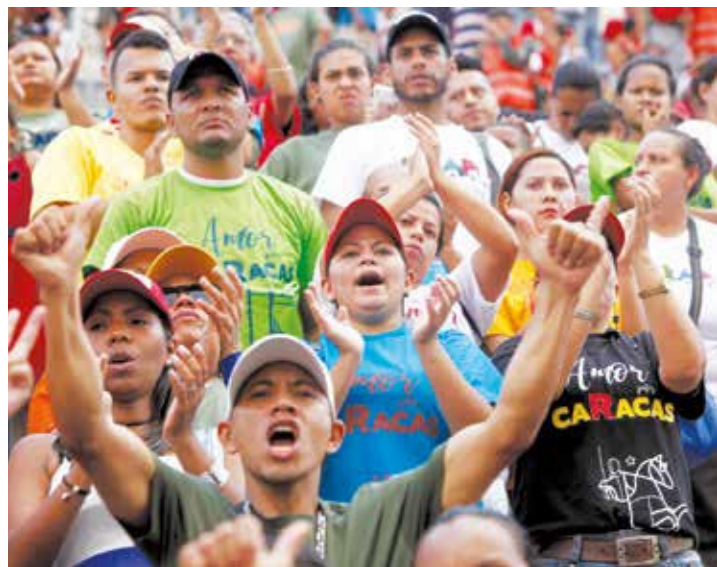
Venezolanos se preparan para la fiesta electoral

“Nosotros somos buenos ganadores y buenos perdedores, no andamos lloriqueando”, expresó el Presidente, al retar al miembro de la oposición venezolana, Henry Ramos Allup, a inscribir su candidatura presidencial en el año 2018. •