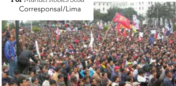
Los 167 conflictos sociales, se expresaron en masivas manifestaciones populares de protesta.

Por Manuel Robles Sosa Corresponsal/Lima