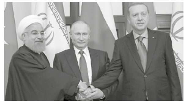
Rusia, Turquía e Irán garantizan una lucha más eficaz contra el terrorismo.

La abstención saudita más bien estaría relacionada con su posición respecto a los grupos armados opuestos al gobierno de Al Assad en esta etapa,