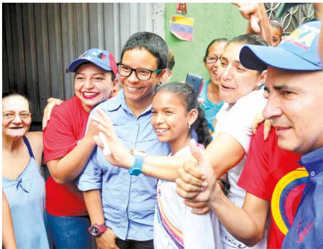
La candidata de la Revolución en Caracas.

Cuando en abril de este año, los sectores opositores inscritos en la llamada Mesa de Unidad Democrática iniciaron su agenda violenta en coordinación con elementos externos, pregonaban la caída de la Revolución Bolivariana