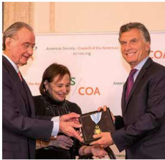
Seguramente también se le premió por su cabildeo diplomático para lograr la tan ansiada intervención militar estadounidense contra la Revolución Bolivariana.

¿Liderazgo regional? Seguramente también se le premió por pedirle a la Casa Blanca, en el cierre de su gira por Estados Unidos, la imposición de un embargo petrolero total contra Venezuela; o por sus incansables esfuerzos de cabildeo diplomático para crear las condiciones necesarias para la tan ansiada intervención militar estadounidense contra la Revolución Bolivariana; o acaso, simplemente, como celebración del buen estado de sus articulaciones, de lo que no cesa de presumir en sus constantes genuflexiones al gobierno de Donald Trump.