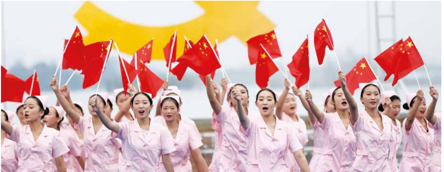
Venezuela ratifica el socialismo como única alternativa viable para la construcción de un mundo mejor.