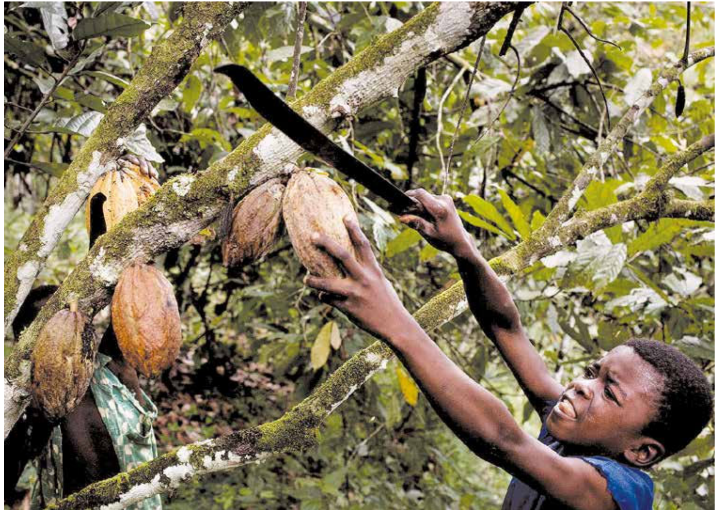
La corporación ha sido acusada de explotación infantil

En la obra "El lado oscuro del chocolate", la periodista Miki Mistrati afirma que la Nestlé no solo es responsable de comprar el cacao producido por niños esclavizados; lo que constituye en sí misma una práctica empresarial antiética e inmoral. En realidad, asevera, esta compañía es la autora intelectual de todo el circuito económico que genera esclavitud infantil en África. El modus operandi de esta transnacional es el siguiente: Primero propicia una política "amistosa" de cooperación y acercamiento con las naciones productoras de cacao y con la comunidad científica local vinculada a la agricultura cacaotera por medio de una seductora estrategia co-