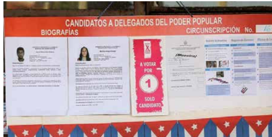
No se permite propaganda de los candidatos, solo se exponen sus síntesis biográficas.

Hechos como estos definen los rasgos esenciales del sistema político cubano. Por derecho constitucional, definido así hace más de cuatro décadas, todo