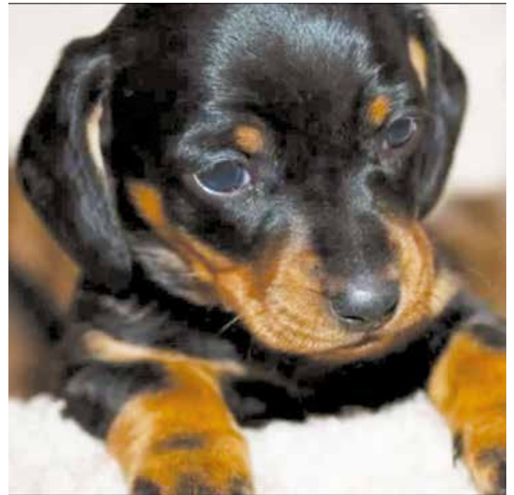
Teatro para educar respeto y amor a los animales.

Tareas como tener que recoger su popó, alimentar, pasear, cuidar y educar al animalito, comienzan a formar parte de su rutina diaria. Aunque la primera de ellas no es una de sus favoritas, la realiza con buena volun-