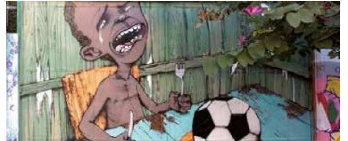
Paradójicamente Brasil fue la sede, un país que según el director de la FAO, José Graziano da Silva, puede volver a estar en el Mapa del Hambre, del cual salió en 2014.