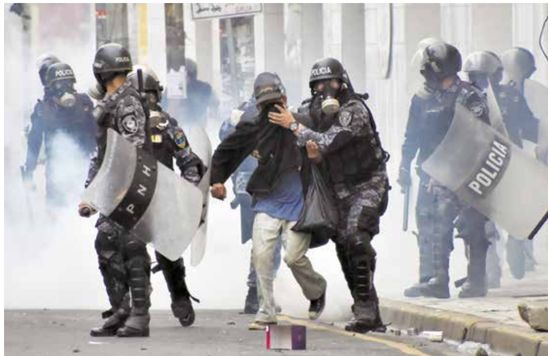
Honduras sin garantías constitucionales se reprimió a quienes denunciaron el fraude.