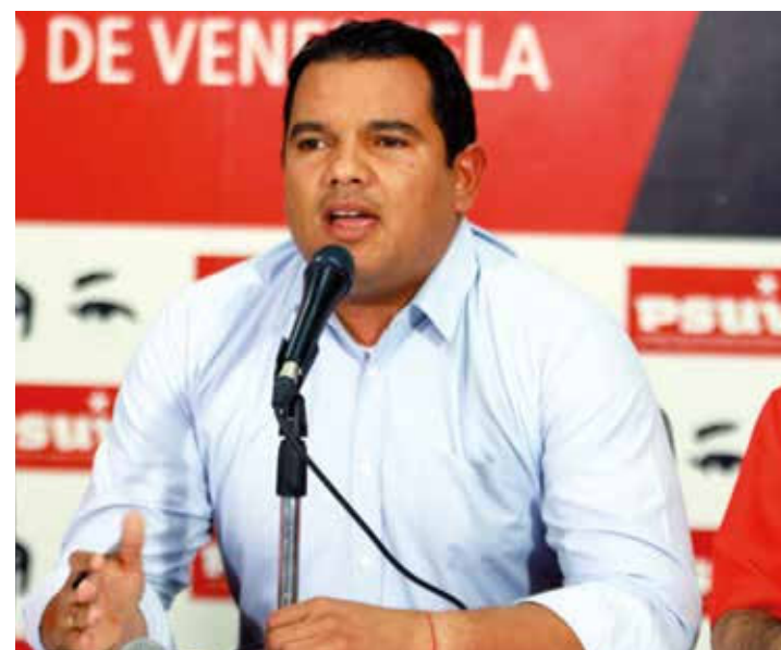
Clark: El dialogo es el camino.

Destacó que esta medida responde a las sanciones contra Venezuela y la industria petrolera por parte del gobierno de Estados Unidos. Por esta razón, condenó que otros gobiernos de derecha