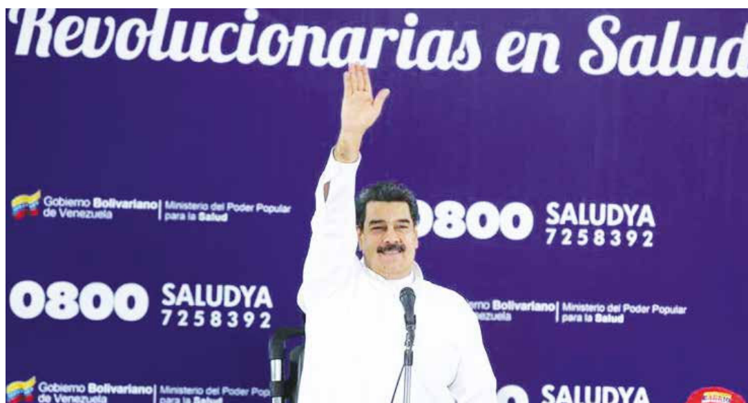
Derecha pretende atacar el Petro desde la Asamblea.

De llegar la derecha a gobernar "eliminaría Barrio Adentro y le quitaría el título a los médicos integrales comunitarios, porque dicen que no son médicos. Son dos modelos: el de la salud para pocos y privatizada, que es lo que ellos quieren o el modelo de la salud democrática, para todos", expresó el primer mandatario. •