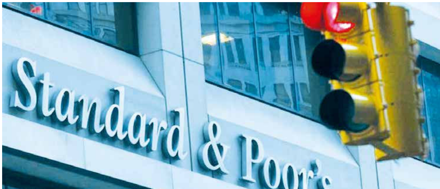
Las calificadoras forman parte del ataque contra el país.

del precio del petróleo. En la actualidad, el RP, dado por JP Morgan (EMBI+), se encuentra actualmente en 4.820 puntos, es decir, 38 veces más de lo que le asignan a Chile a pesar que este país tiene un ratio de deuda/PIB similar al venezolano.