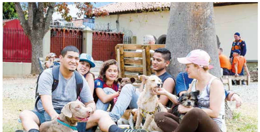
Un perro o gato en el hogar es bueno para la salud.

Psicológicamente, son importantes para niños y ancianos. Los gatos con su ronroneo producen al ser humano un efecto relajante y tranquilizador, que en el campo de la medicina ha dado excelentes resultados, en el tratamiento de enfermedades cardíacas, psicológicas o de hipertensión.