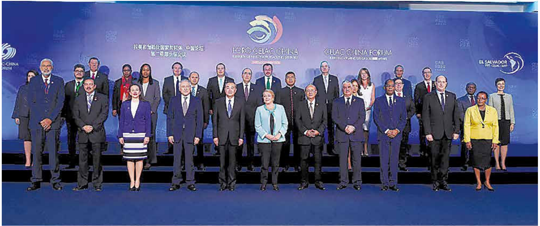
La cita fijó metas para los próximos 15 años.

Hay una apuesta a una libertad de comercio equitativo, una propuesta de cooperación en áreas sensibles como desarrollo tecnológico, que se avance en la superación del esquema de mirar a América Latina como exportador de materias primas, planteando avanzar hacia un intercambio de productos de mayor valor agregado en ambas direcciones