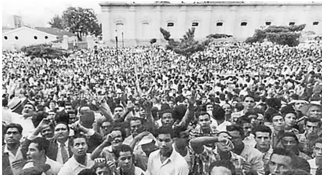
Las élites secuestraron el espíritu del 23 de enero.

El pueblo venezolano ha definido su camino, el de la paz,