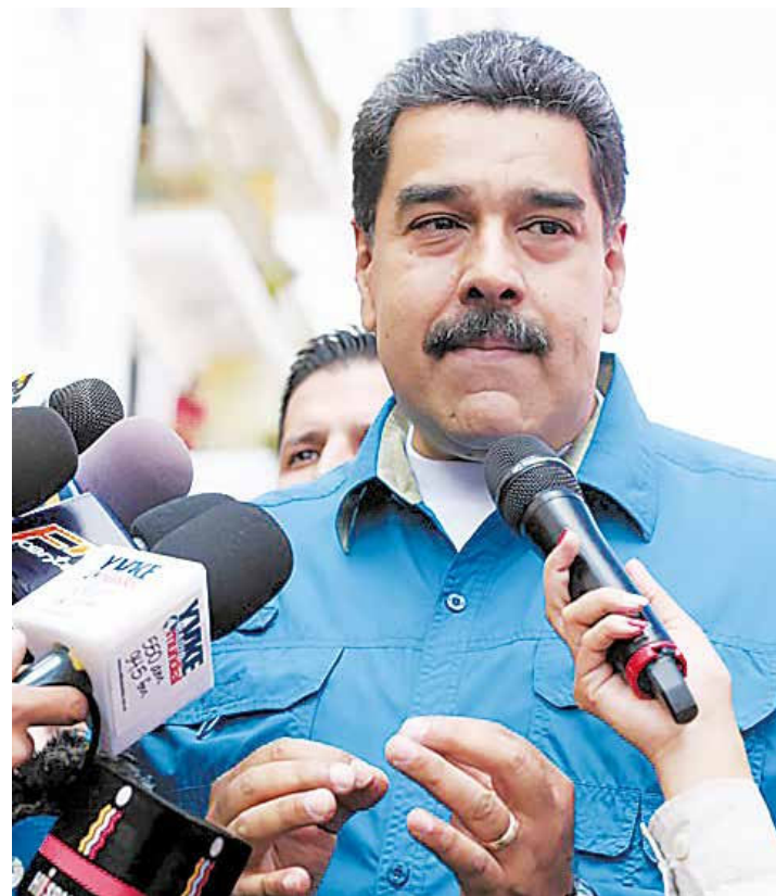
Maduro, candidato de la Patria.

Al respecto, Maduro explicó que se obtuvo importante información de inteligencia que ha conducido a la detención de varias personas relacionadas con actos de sabotaje que se pensaban llevar a cabo en el marco de un plan de desestabilización contra la democracia venezolana.