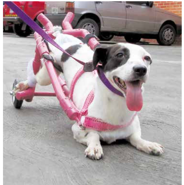
Manchas volvió a caminar.

Cabe destacar que aunque Manchas cuenta con el cuidado y protección necesario, no es conveniente para ella permanecer en un lugar confinado,