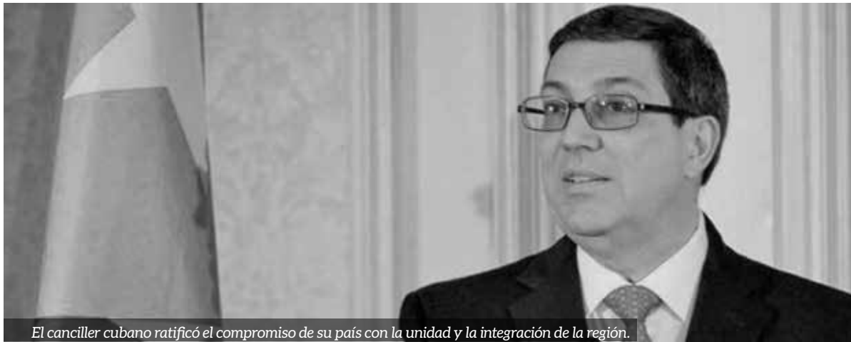
El canciller cubano ratificó el compromiso de su país con la unidad y la integración de la región.

Por Fausto Triana Corresponsal/Santiago de Chile