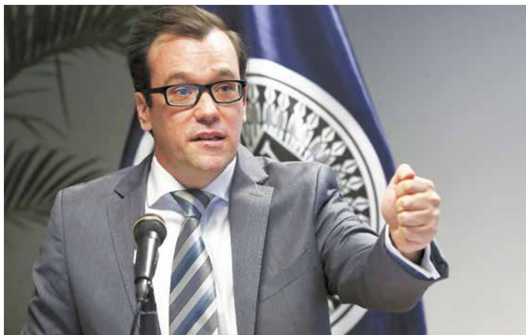
El nuevo DICOM contribuirá a equilibrar la tasa de cambio del bolívar frente al dólar.

Las personas naturales podrán adquirir un monto máximo de 420 euros (€) trimestrales y €1.680 anuales, o su equivalente en cualquier moneda extranjera.