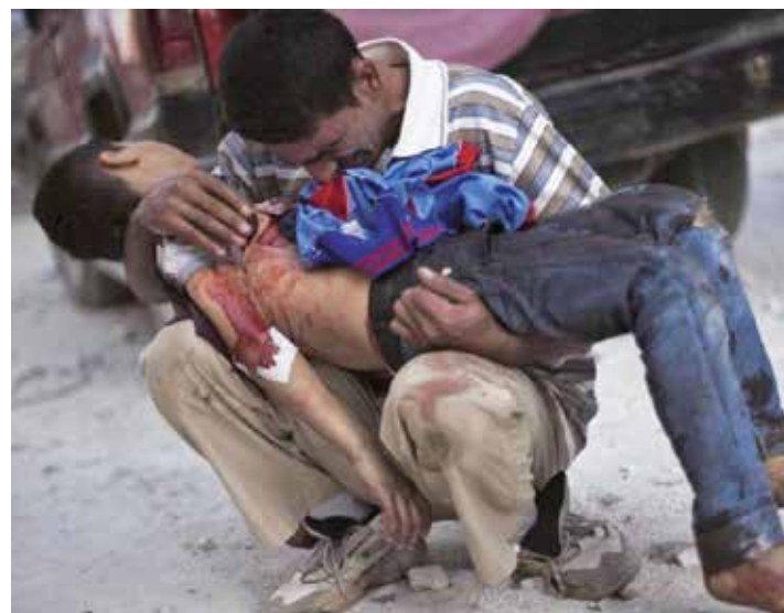
En Siria miles de civiles han muerto por la guerra.

Se pudo conocer que solamente entre el 19 y 20 de marzo de 2011, fueron lanzados 110 misiles provenientes de