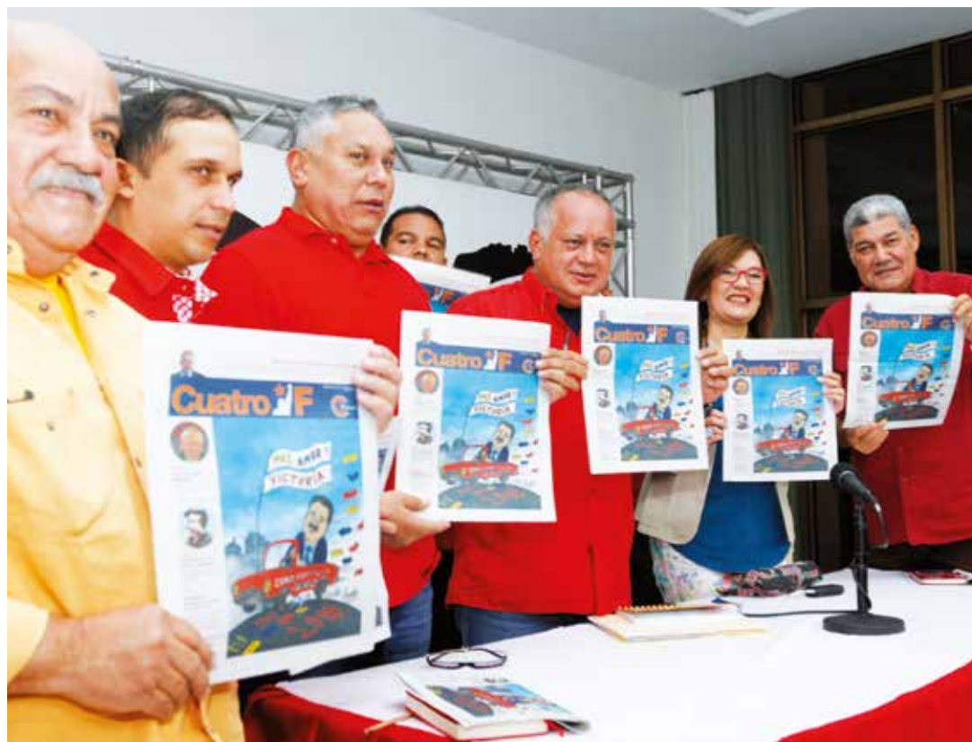
El PSUV se organiza para la victoria perfecta.

“El PSUV está obligado a ganar las elecciones, y el carnet aumentará la eficiencia política. Tendremos nuestros puntos rojos chequeando en tiempo real el 1x10, lo que permitirá hacer el remate perfecto. Va a ser un mecanismo absolutamente eficiente, porque la victoria de Nicolás Maduro repercutirá en el mundo entero”