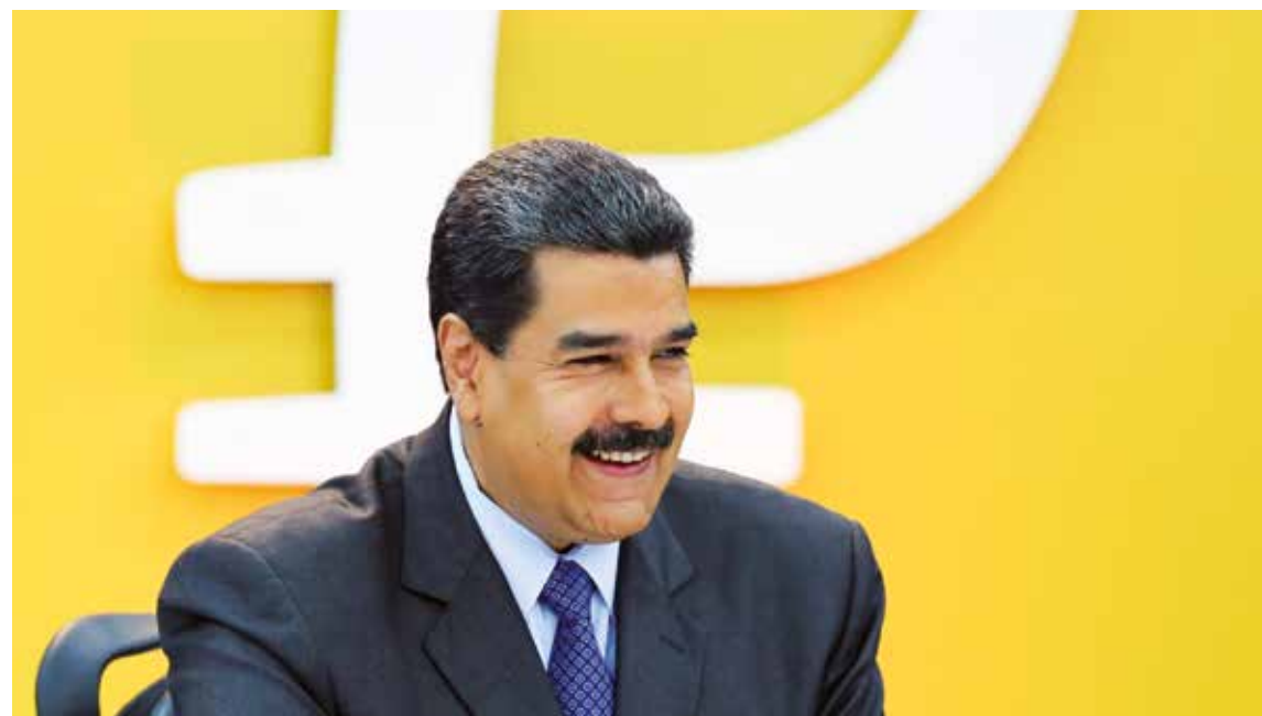
Maduro; El petro nació grande.

Este criptoactivo, que comenzó el martes 20 de febrero su preventa, está respaldado por el campo 1 del bloque Aya-