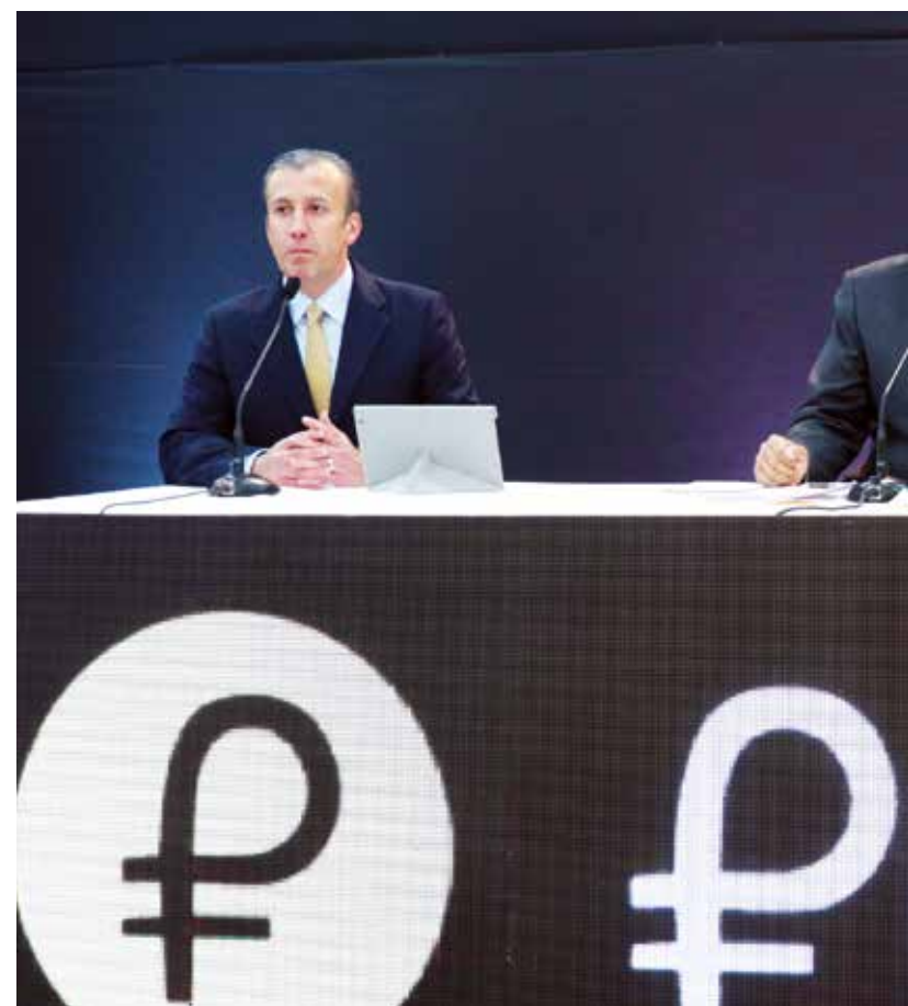
Las primeras ofertas superaron los mil millones de dólares.