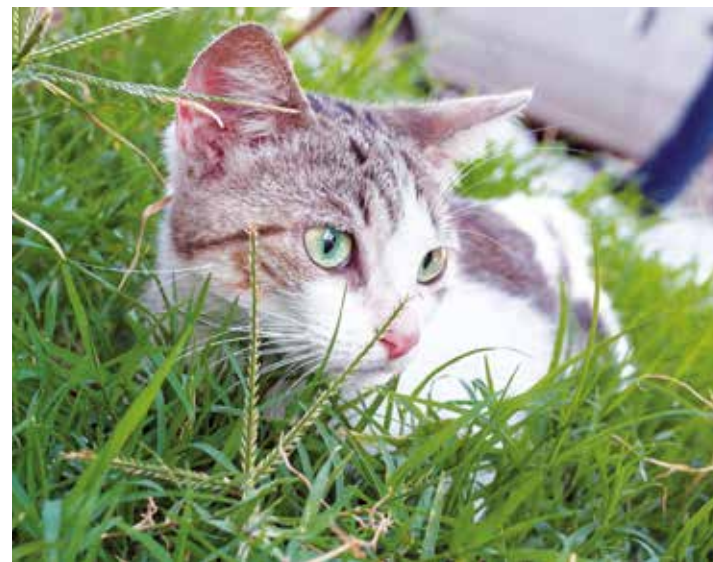
Excelentes compañeros.

Los gatos aprenden por medio de la imitación, la observación y las experiencias