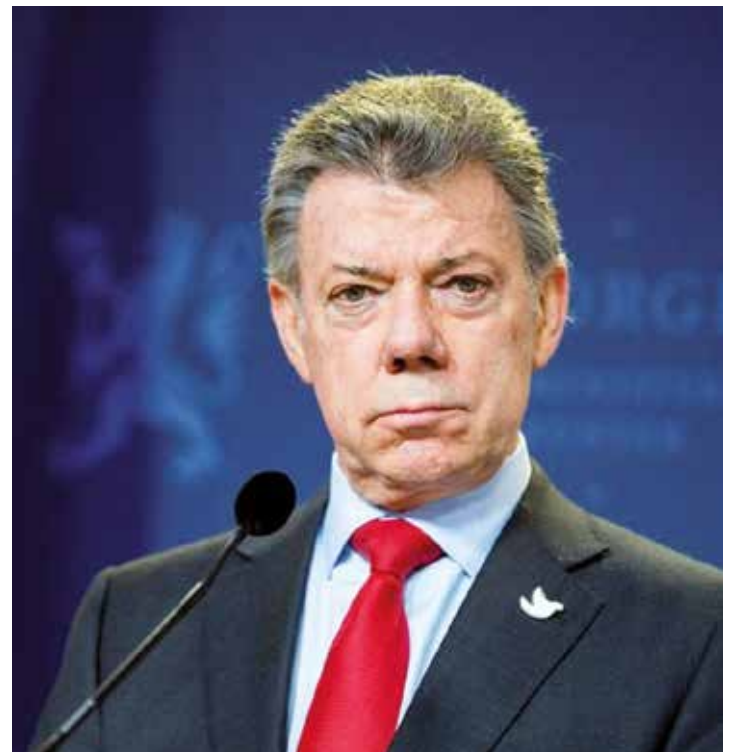
Juan Manuel Santos.

Es decir, del total de inmigrantes que cruzan hacia Colombia desde Venezuela, el 70% tiene derecho a transitar porque tiene nacionalidad co-