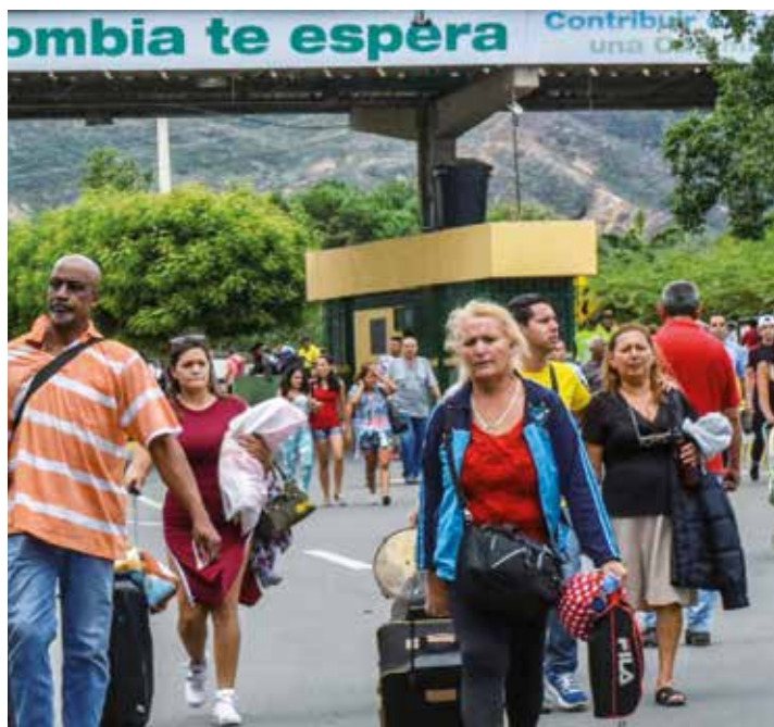
Son más los colombianos que han cruzado la frontera.

Las declaraciones de Santos se producen justo cuando su popularidad no supera el 15% y el proceso de paz peligra por el asesinato sistemático de líderes sociales, el golpe a las circunscripciones de paz y los atentados del ELN. Según información publicada por los medios locales, Colombia mantiene el primer lugar como productor de cocaína del mundo y el segundo puesto como el más desigual de América Latina; y está a la cabeza en abstención electoral por la desconfianza en el sistema democrático. Resulta curioso que el "problema más serio" de ese país sea, según su presidente, la migración venezolana. •