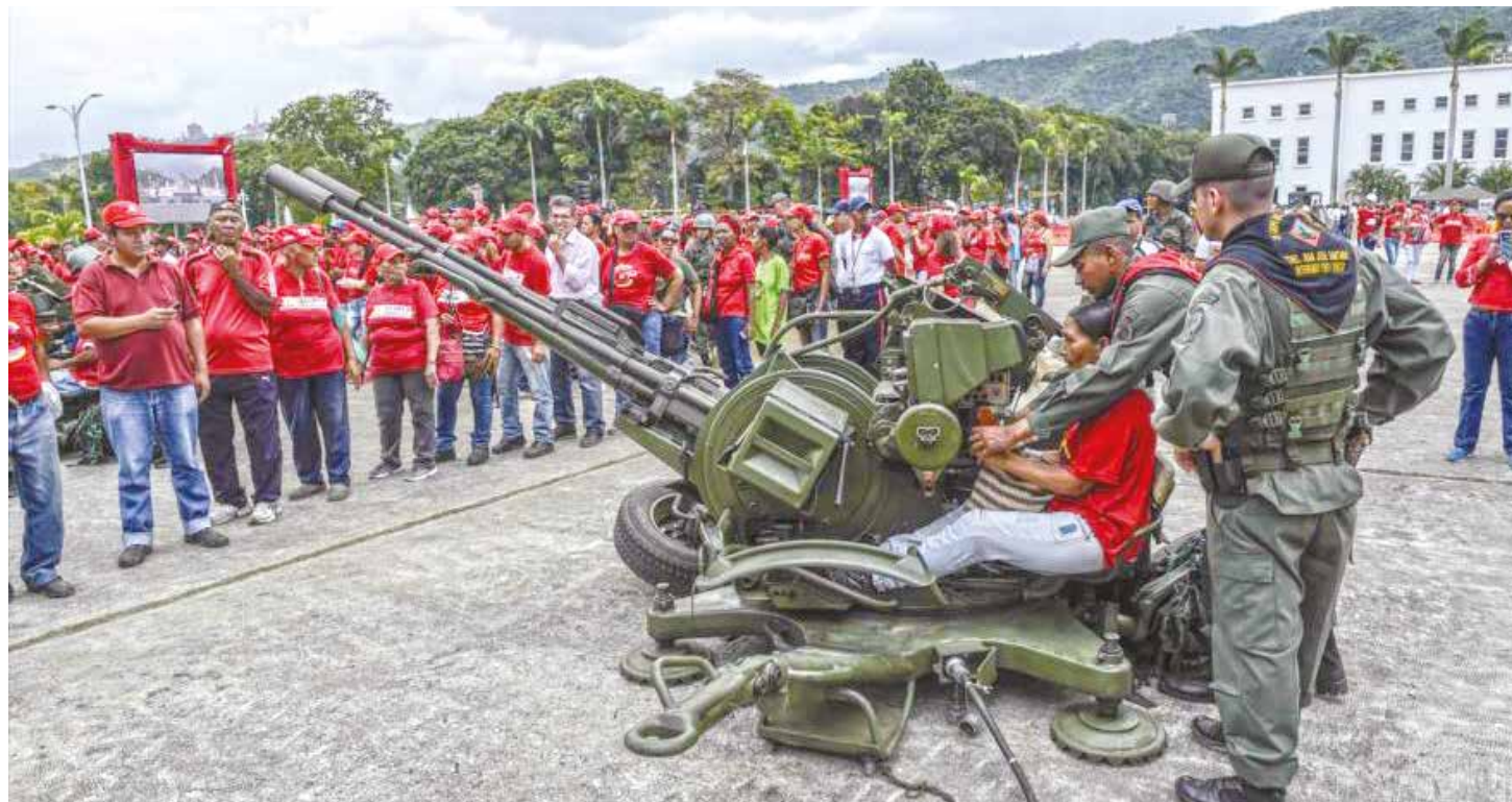
La unión cívico-militar se fortalece ante las amenazas.

Pese a las dificultades que hoy tenemos los venezolanos para cubrir nuestras necesidades básicas nuestro pueblo está consciente de los esfuerzos que realiza el Gobierno Bolivariano para proteger a las mayorías