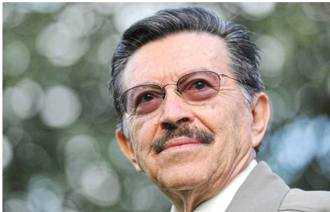
Fue calificado de "terrorista intelectual".

La razón del secuestro fue la proyección en San Lorenzo de la película "El profe", film mexicano dirigido por Miguel Melitón Delgado Pardavé en 1971 y protagonizado por Mario Moreno "Cantinflas" en el papel de Sócrates García, Marga López, en el papel