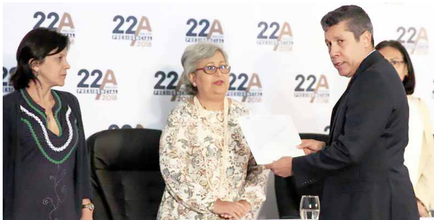
Fue aceptada la postulación de Falcon como candidato presidencial.

"¿No les parece una locura el llamado a la abstención?", inquirió el mandatario, al tiempo que acusó a la oposición de estar "subordinada a Estados Unidos y a la derecha internacional". Destacó igualmente que en los comicios del 20 mayo venidero, cuando se elegirán Presidente de la República, consejos legislativos estatales y concejos municipales, habrá oportunidades y participación de varios candidatos opositores. "Se van a sorprender de cuántos candidatos, decenas y cientos, se