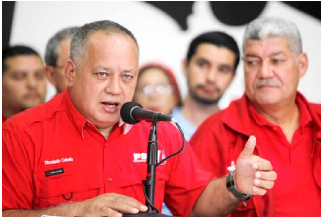
Diosdado Cabello: Borges pide más sanciones para Venezuela.

En lugar de un canal humanitario, pedimos que nos dejen comprar la comida y las medicinas que necesitamos, pedimos que cese el bloqueo