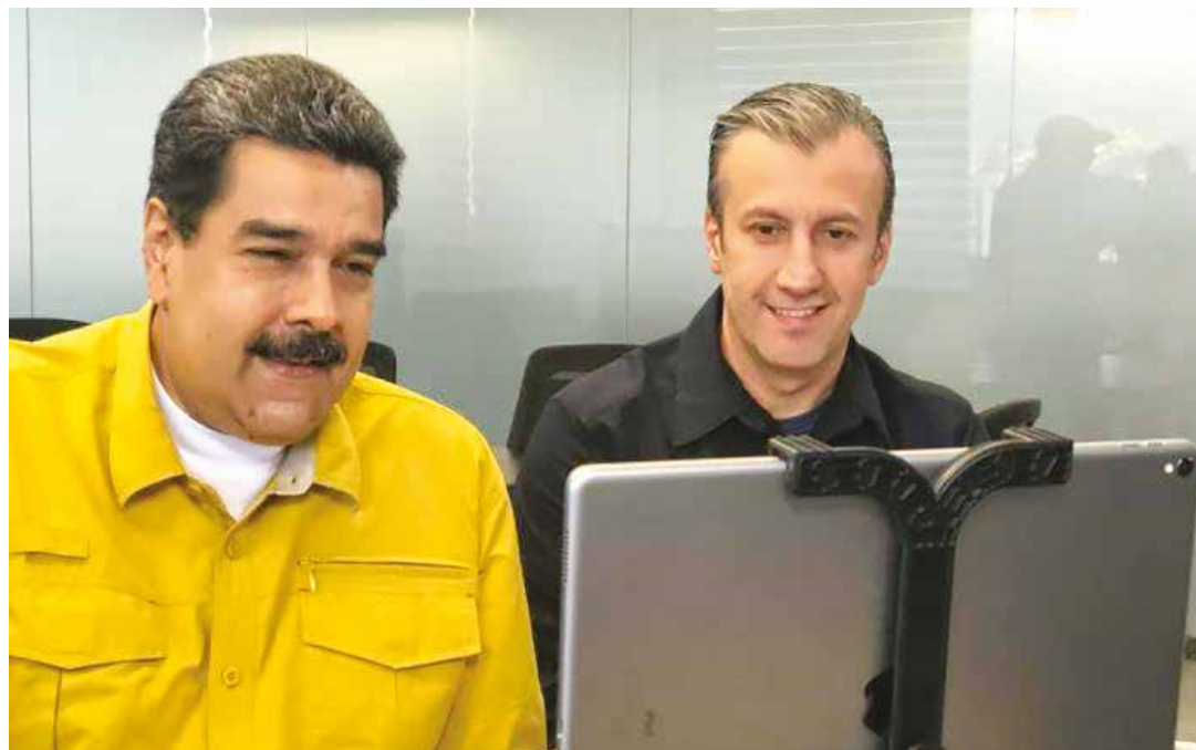
Es el segundo incremento de salario durante este año.