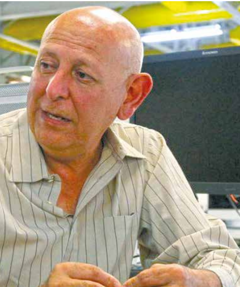
Revolución Bolivariana.

demás luchas nacionalista defensora del pueblo venezolano. No nos derrotarán.