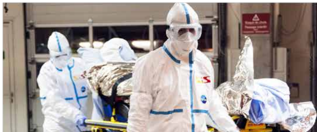
Abstenerse de la indiferencia y abrazar causas solidarias, como los cubanos del personal de la salud que en África enfrentaron el ébola.

Por Frei Betto* Para Firmas Selectas de Prensa Latina