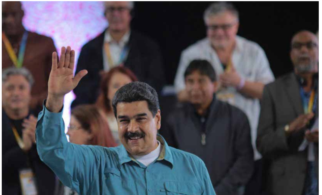
El presidente Maduro clausuró la jornada de reflexión.

Cinco fueron las áreas temáticas afrontadas en forma de seminario: una dedicada al género y la libertad de las mujeres a vísperas del 8 de marzo; una segunda concerniente a la juventud y a las nuevas banderas antiimperialistas; una tercera sobre el trabajo y sus trabajadores, vanguardia en la lucha anticapitalista; una cuarta sobre la Constituyente y el diálogo; una quinta sobre la comunicación y sobre las estrategias para combatir la ofensiva de las grandes corporaciones y sobre las estrategias que responden al complejo militar