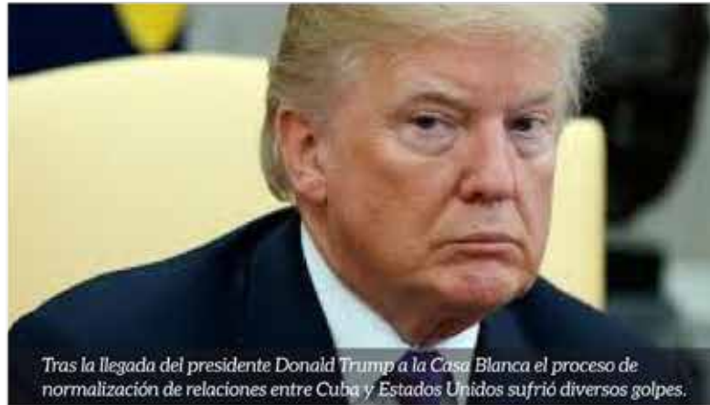
Tras la llegada del presidente Donald Trump a la Casa Blanca el proceso de normalización de relaciones entre Cuba y Estados Unidos sufrió diversos golpes.

El pasado 2 de marzo la administración de Trump dio a conocer que mantendrá indefinidamente la reducción de su personal diplomá-