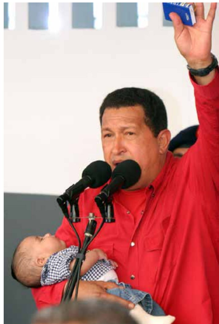
Chávez llamó a mantener la unidad en tiempos difíciles.

En momentos como este, es necesario advertir, como él mismo lo señaló en su última proclama, que no faltarán quienes quieran aprovecharse y manipular su discurso, sus palabras en un determinado momento, para inclinar la balanza a favor de sus propios intereses, o para confundir a quienes creen en su legado. Es por ello que debemos asumir, con gran responsabilidad y conscientes de la profunda confianza que el Comandante Chávez depositó en nosotros, que no hay espacio para la duda: los verdaderos chavistas estamos con Nicolás Maduro, quien es hoy en día el único líder que puede conducirnos