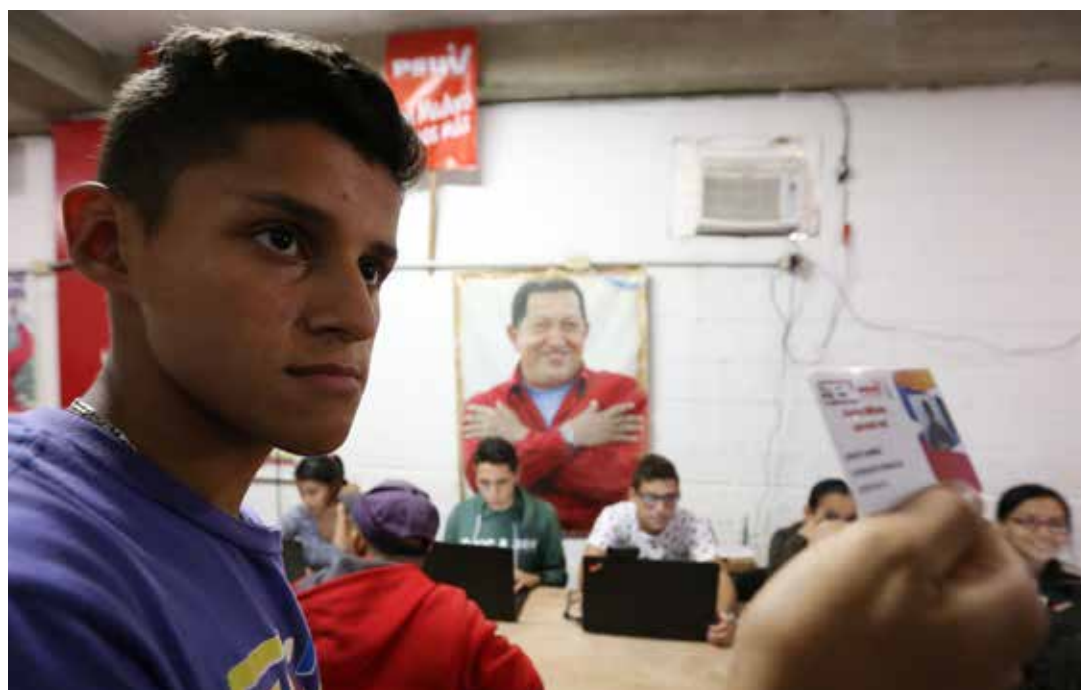
2 millones de militantes han sacado su carnet.

Con 10 millones de votos nosotros despejamos el camino por 10 años para el trabajo, para la economía, para la cultura, para la seguridad social, para las misiones, para la vida