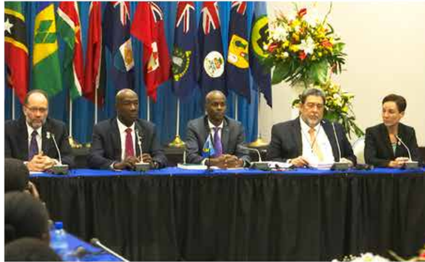
El mandatario haitiano, Jovenel Moise (al centro), actual presidente pro tempore , significó que tenemos los mismos problemas y Caricom es el espacio para defender los intereses comunes.

El mandatario haitiano, Jovenel Moise, actual presidente pro tempore de la agrupación regional, afirmó que tenemos pequeñas naciones, tenemos los mismos problemas y Caricom es el espacio para defender los intereses comunes. Anunció que los miembros firmaron un acuerdo de reconstrucción de los países destruidos por los huracanes Irma, María y Matheew, en el contexto del enfrentamiento a los desastres naturales y la resiliencia al cambio climático en 2018. El jefe de Estado recalcó que para ser una región más fuerte debemos trabajar en el mejoramiento de nuestras infraestructuras y ser capaces de aplicar normas y regulaciones para salvaguardar bienes y personas.