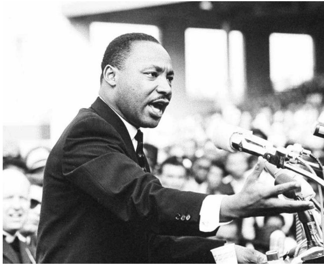
Persiste la violencia contra los afrodescendientes.

Martin Luther King fue un activista del siglo XX que luchó contra la discriminación racial, el capitalismo y el imperialismo estadounidense. Nació el 15 de enero de 1929 en Atlanta, Georgia. Su pedagogía emancipadora se sustenta la economía. Cuando le habla a los poderosos es claro: "ustedes no pueden hablar de una resolución del problema económico de los negros sin hablar de millones de dólares. Ustedes en verdad falsean la realidad porque tienen negocios con los capitanes de la industria. Eso significa ahora que ustedes se mueven en un mar agitado, porque eso significa que hay algo que no funciona con el capitalismo. Debe haber una mejor distribución de la riqueza". Martin Luther King cree en un Estados Unidos más cercano a Abraham Lincoln que al emporio bélico de Thomas Jefferson, los hermanos Charles Foster y Allen Dulles, Henry Kissinger y Joseph McCarthy. "Hemos guiado a los misiles y desviado a los hombres", dice. Tiene plena consciencia de que "lo que se obtiene con violencia, solamente se puede mantener con violencia" y de la arrogancia imperialista ya que "Estados Unidos es el mayor exportador de violencia en el mundo" porque ejerce terrorismo de Estado, practica el genocidio, planifica la eliminación de gobiernos inconvenientes a Estados Unidos, y prioriza los intereses corporativos de Wall Street.