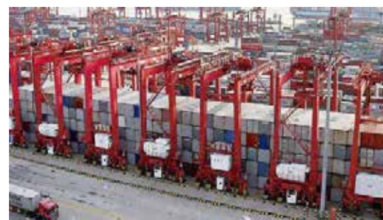
CHINA - EE.UU.