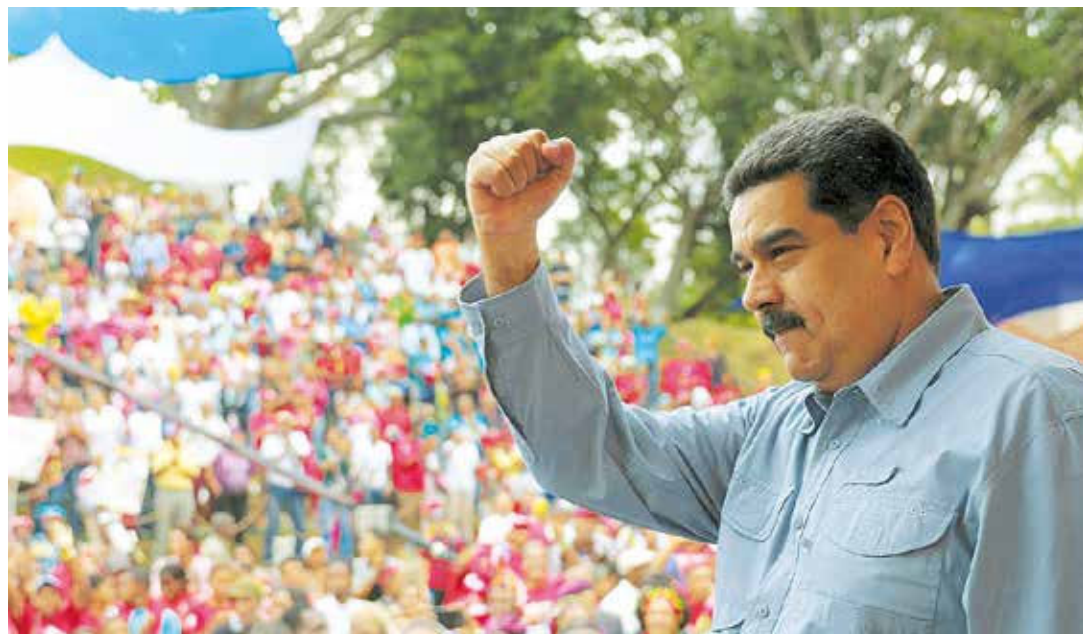
Venezuela no se convertirá en una colonia gringa.

"Hemos logrado la unión perfecta, la unión perfecta es la unión política en un proyecto, el Plan de la Patria 2025, la unión perfecta es la unión histórica en las raíces de Bolívar, en las raíces revolucionarias de Zamora, en las raíces revolucionarias del legado del comandante Hugo Chávez, tenemos una unión perfecta en lo histórico", resaltó Maduro en el acto, en el cual llamó a los venezolanos a prepararse a la lucha comunicacional e informativa por la verdad de Venezuela ante los ataques