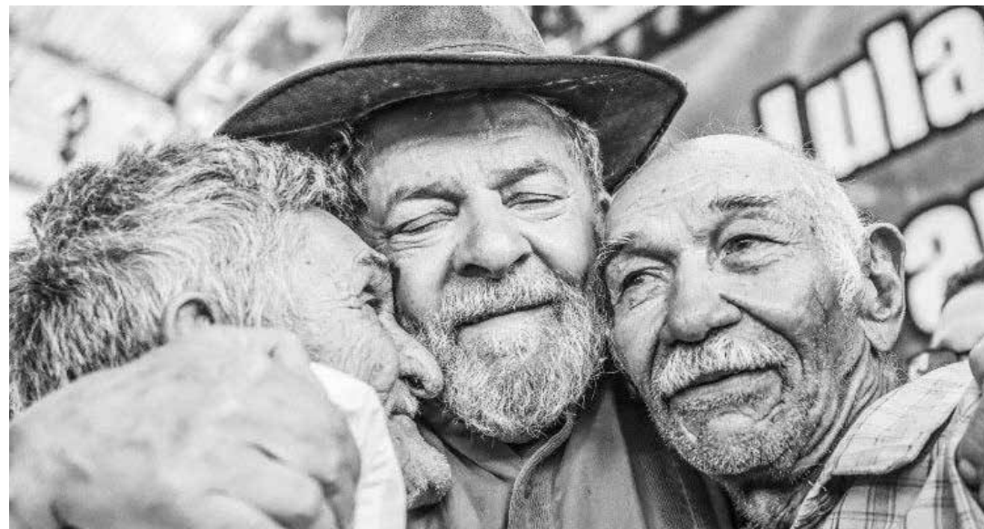
Lula ha recibido la solidaridad de los pueblos.