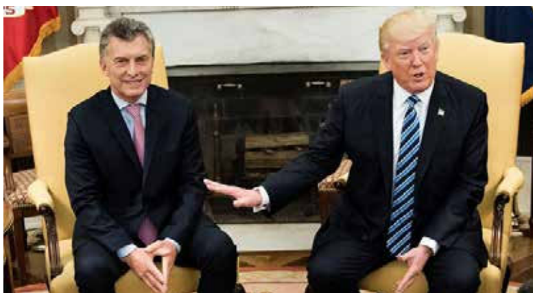
Donald Trump y Mauricio Macri, presidentes de EE. UU. y Argentina, respectivamente.

del Arco Minero del Orinoco (en donde, hace pocos días, se certificó la existencia de la cuarta mina de oro más grande del mundo, de la que se podrían extraer 1480 toneladas del metal precioso).