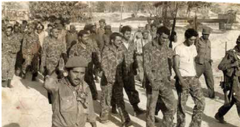
Primera derrota de EE. UU. en América Latina.

En el marco de la reunión de Ministros de Finanzas del G20, recientemente en Buenos Aires, funcionarios brasileños y colombianos promovieron la tesis de un "plan de reconstrucción económica para Venezuela", bajo esquemas de crédito de organismos financieros internacionales y colocando como garantía -¿o botín?- las enormes riquezas