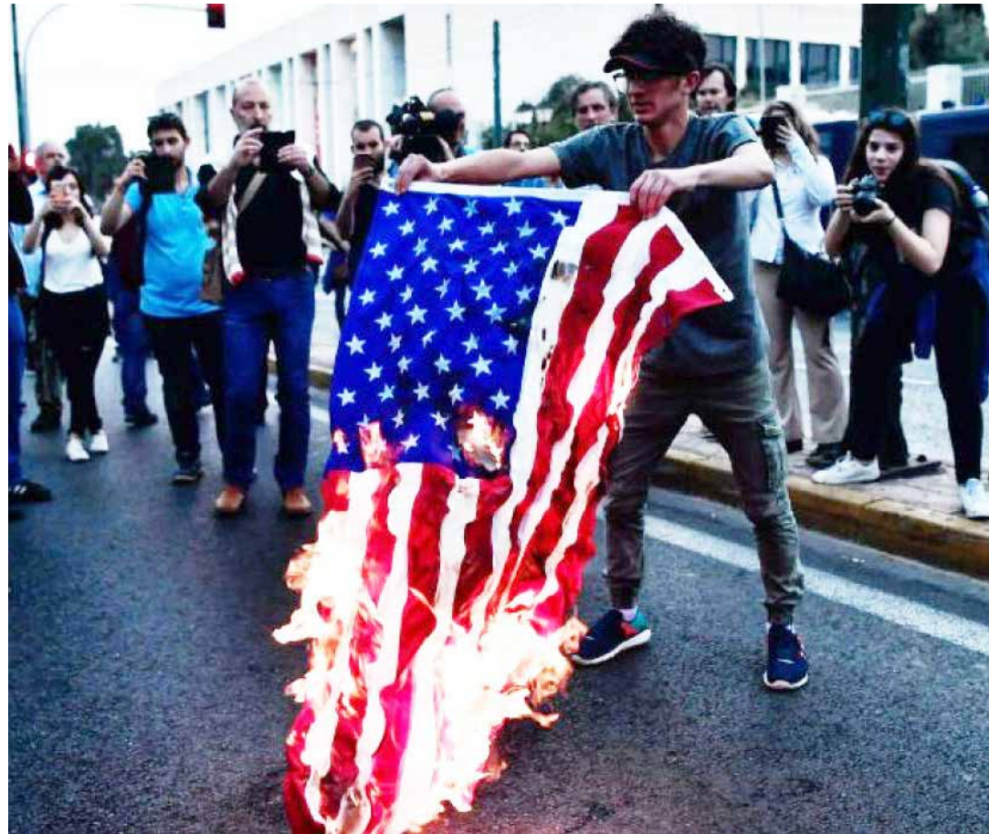
El mundo se ha levantado contra la agresión injustificada a la nación árabe.

cen hoy en Siria, pretenden hacerlo contra Venezuela los agentes de la derecha y el neoliberalismo regional que buscan a toda costa una intervención militar en la Patria de Bolívar y Chávez para derrocar a la Revolución Bolivariana.