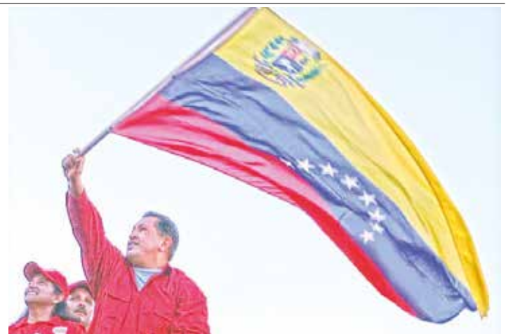
Hay que elevar la conciencia revolucionaria.

Es esa misma conciencia revolucionaria, es ese mismo espíritu democrático -el de la deliberación en todos los espacios, el de la construcción