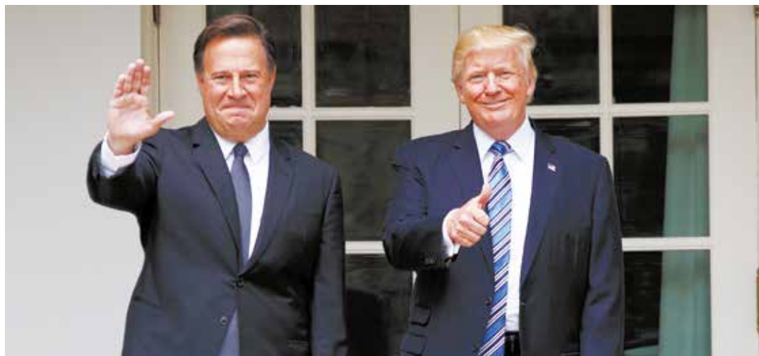
El presidente de Panamá sigue las directrices de Trump.

Protección a la economía El Gobierno de la República Bolivariana de Venezuela suspendió por 90 días las relaciones económicas con otras 50 empresas panameñas, como una medida de protección de la economía nacional. La Gaceta Extraordinaria número 6.372, que circuló este jueves 12 de abril, indica que estas 50 empresas