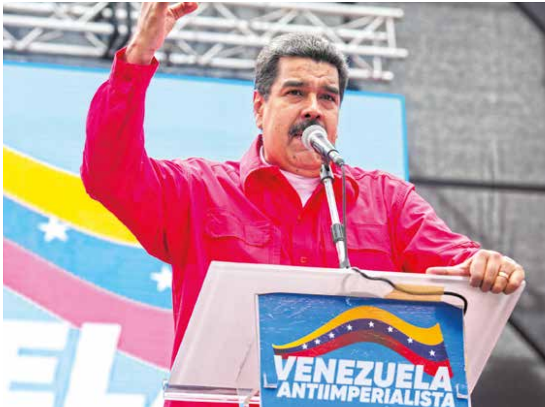
El primer mandatario condenó el ataque contra Siria