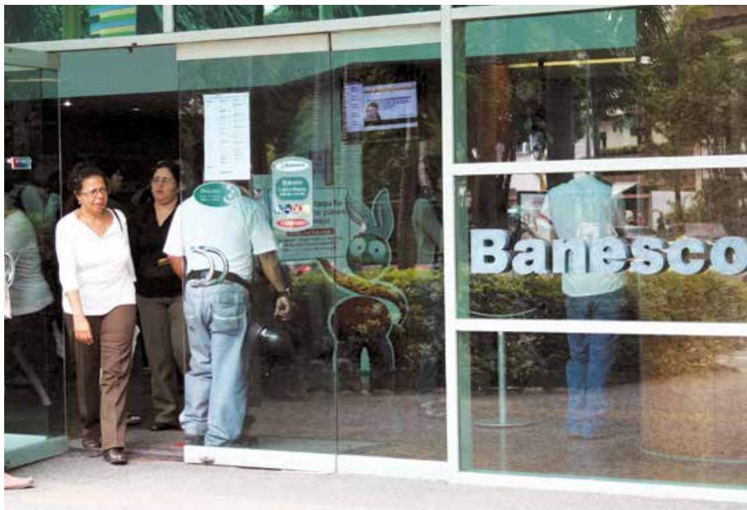
Los clientes de la entidad financiera no se verán afectados.

"Esta es una medida de intervención donde la entidad financiera mantendrá todas sus operaciones sin ningún problema; la idea es preservar y que la institución conserve su actividad bancaria y continúe brindando sus servicios a todo sus usuarios con absoluta normalidad", expresó el sábado 05 de mayo el presidente de la Superintendencia de Bancos, Antonio Morales. El funcionario llamó a la población mantener la calma y no hacer caso a los rumores, y menos a aquellos que difunden por redes digitales. "Los ahorristas tendrán su dinero garantizado ahí, sin ningún problema, no tienen por qué movilizarlo si no lo necesita, la intervención es a puertas abiertas. El banco va seguir operando con toda normalidad", aclaró. Señaló que esta intervención se debe acciones