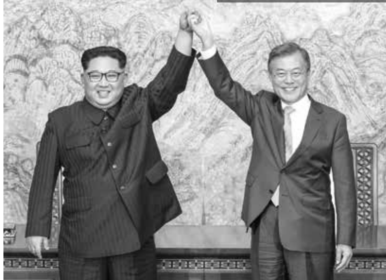
Las partes reanudarán en breve los diálogos y negociaciones a fin de tomar medidas para poner en práctica los acuerdos de la Cumbre, subraya la Declaración Conjunta.

transmitidas en directo al mundo y sin comentaristas o locutores, pura señal digital de video, por la televisión surcoreana, a manera de absoluta, transparencia del encuentro.