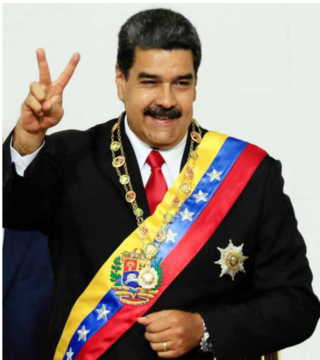
El presidente impulsa una política de reconciliación nacional.

mano "a todos los empresarios del país; pequeños, medianos y grandes convoco a todas las empresas nacionales e internacionales que trabajan en el país. Vamos a hacer de nuevo el sistema de distribución, comercialización y fijación de los precios de todos los productos del Plan 50", apuntó Maduro al tiempo que adelantó la necesidad de fortalecer los Comités Locales de Abastecimiento y Producción (CLAP) para reducir los tiempos de entrega de las cajas de produc-