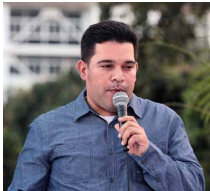
El concejal está de acuerdo con el diálogo franco y sincero.

“En Venezuela hay sujetos como alcaldes que incentivaron a la quema de gente y a destruir edificaciones. Por supuesto, debe estar a la orden de la justicia, tanto esa persona como la que fue Fiscal, Luisa Ortega Díaz, quien actuó impunemente y ahora dice ser perseguida política. Con ese tipo de persona, por supuesto, no hay diálogo, ni nada. Así tampoco con sujetos que creen en la OTAN y esperan un estallido social para alegrarse, por supuesto, no podemos sentarnos con ese tipo de persona de la oposición. Sí hablaría con el ciudadano que se sacó su Carnet de la Patria, y no es chavista pero cree en su país. Te aseguro que ese sujeto defen-