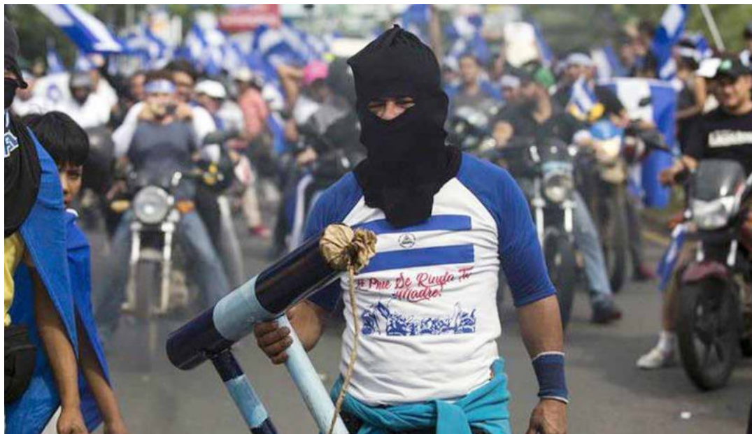
En Nicaragua se repite el guión ejecutado en Venezuela en las guarimbas de 2017.

El enfrentamiento continuó por largos minutos, mientras