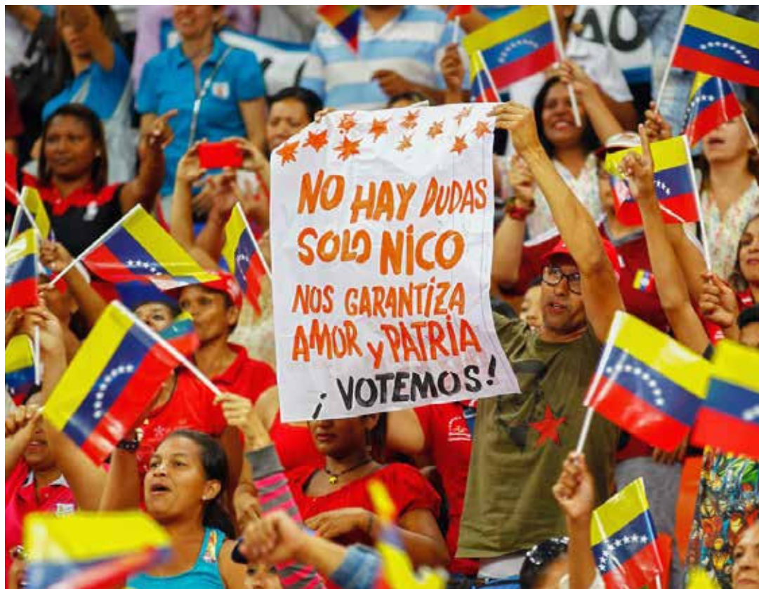
Se impone la tarea de asegurar la continuidad de la Revolución.

dad revolucionaria”, nos sigue exigiendo la gente: los que votaron heroicamente por Maduro, los chavistas que por una u otra razón no votaron, los indiferentes (alrededor del 20% del electorado), e incluso, sectores de los que votaron por la oposición.