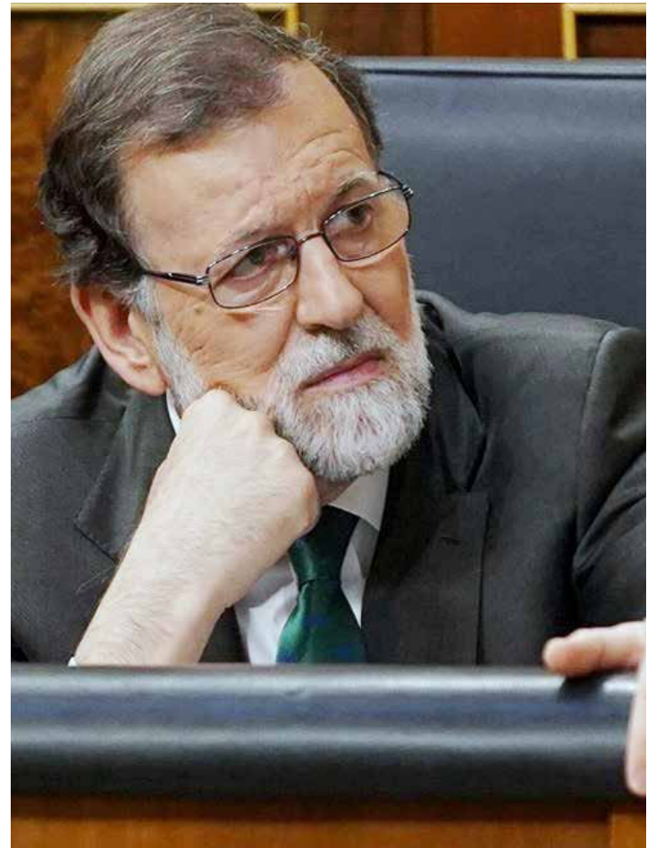
Rajoy cayó en desgracia.

"Todo este panorama, más allá de su devenir en lo inmediato, otorga mayor tiempo político al presidente Nicolás Maduro para administrar el conflicto contra Venezuela y enfrentar a la Casa Blanca en la arena internacional. Lo que no es poco en un contexto en el que los países con fragilidad institucional y política se ubican en su contra, y los de mayor solidez a su favor, como son los casos de China y Rusia, ya que posibilita un espacio para la iniciativa política de Venezuela que pudiera prosperar, tal como lo intenta hacer el Gobierno Bolivariano con la convocatoria a un Gran Acuerdo Nacional. Un escenario que pone al chavismo en condición de aparente ventaja frente a sus enemigos en lo inmediato" analiza Misión Verdad. •