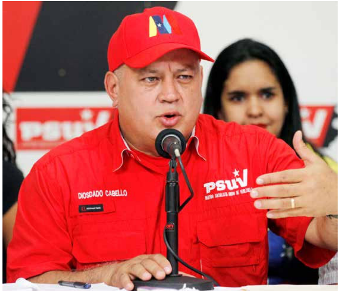
Podrán sancionarnos pero no nos quitarán la dignidad.

Recordó que la OTAN se apropió de la producción de opio en Asia, "¿qué irá a hacer