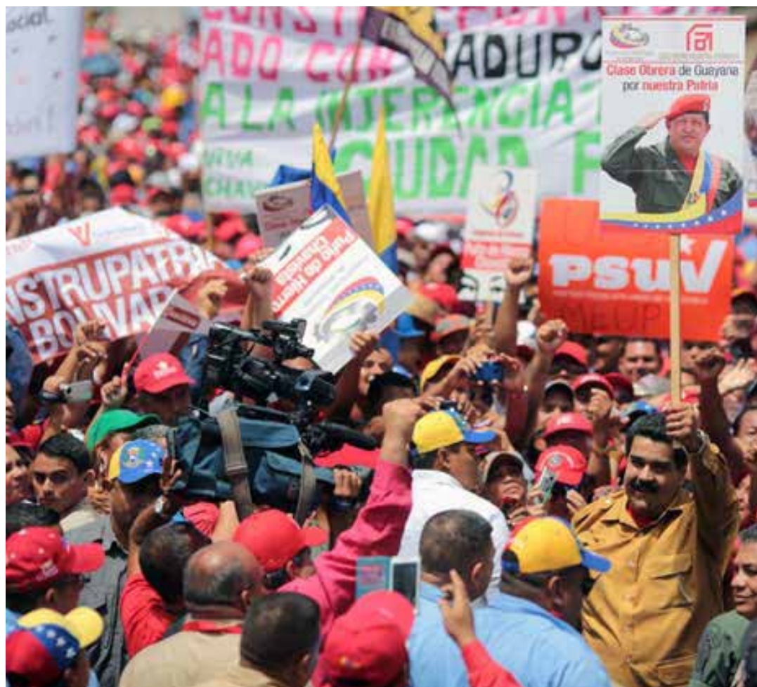
El presidente Maduro impulsa el diálogo y la reconciliación.

ción Bolivariana continuará fortaleciendo la diplomacia de paz y así lo deja claro con gestos como la liberación del ciudadano estadounidense Joshua Holt, cumpliendo la primera línea de acción política de las seis anunciadas por el Presidente Nicolás Maduro.