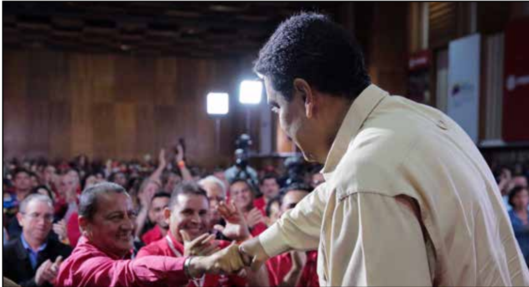
Trabajadores petroleros se comprometieron a recuperar la producción.