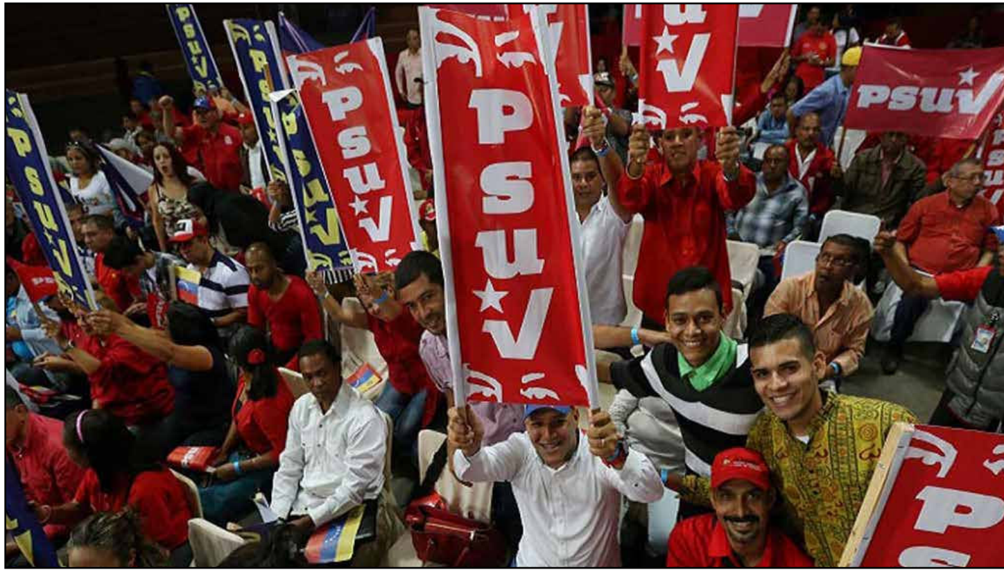
Venezuela emprenderá un nuevo comienzo hacia la superación de trabas que impiden el avance del socialismo.