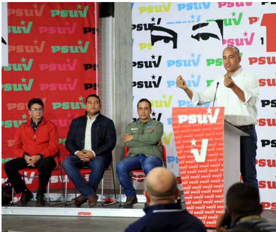
Hay dos economías: la rapaz y la que estamos construyendo con los Clap.

Igualmente se interrogó: ¿Cuántas sanciones se han generado contra venezolanos a petición de la oposición y qué beneficios ha traído al país? ¿Por qué no han mostrado las cuentas bancarias de los sancionados? "No es