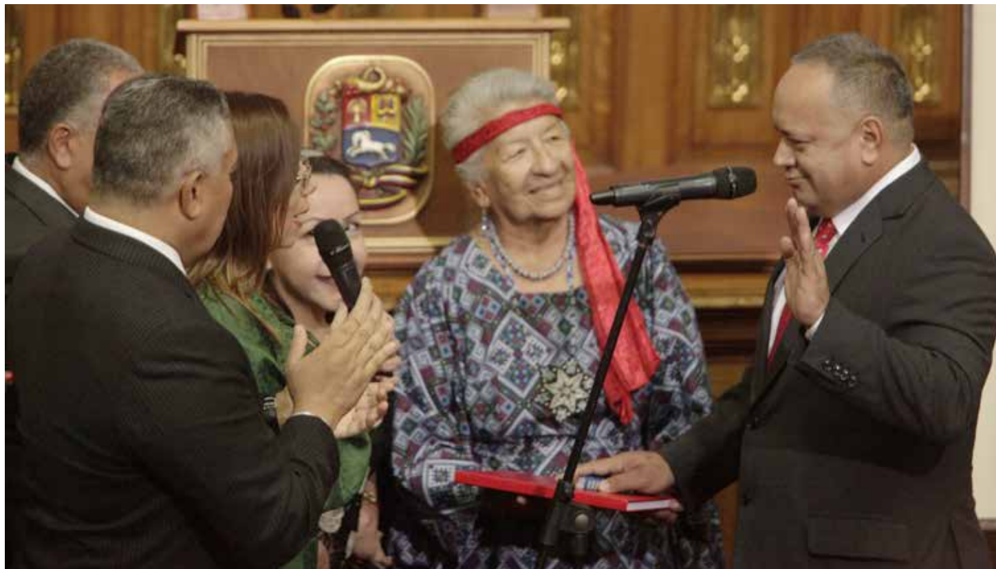
El presidente de la ANC llamó a los diputados a contribuir a edificar el nuevo comienzo.

Advirtió sobre las consecuencias que tendría un nuevo gobierno de derecha en Venezuela. "Cada vez que a la derecha se le da una oportunidad y llega al poder termina en el fascismo tratando de sembrar el caos en esta Tierra. Pero nosotros vamos a seguir y vamos a vencer". •