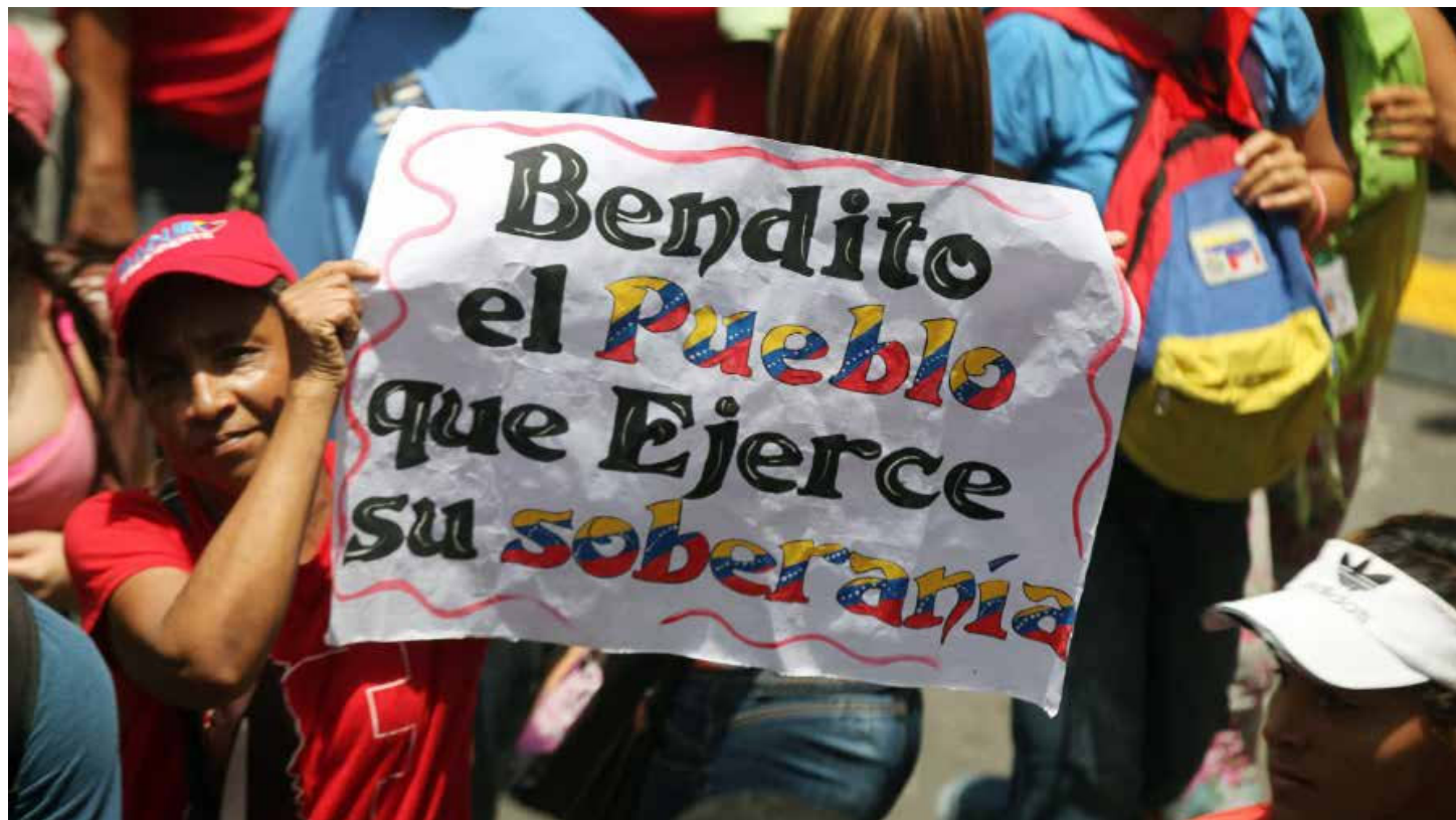
Solo unidos seremos invencibles.