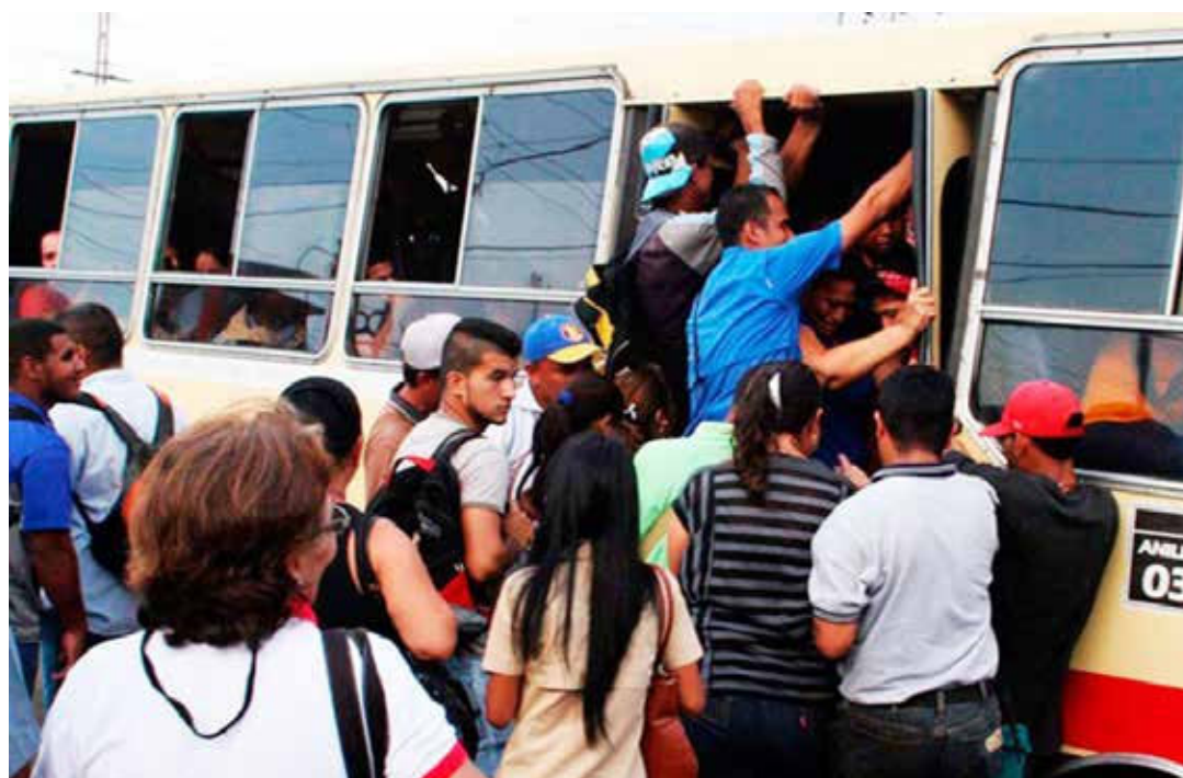
Se está tratando de imponer un paro de transporte no declarado.

Pero el sabotaje no fue ese día o los posteriores, ya meses atrás se venía desarrollando. Muchas veces se argüía la carencia de repuestos, cauchos, baterías, etc. lo cual era y es cierto, pero el gobierno ha