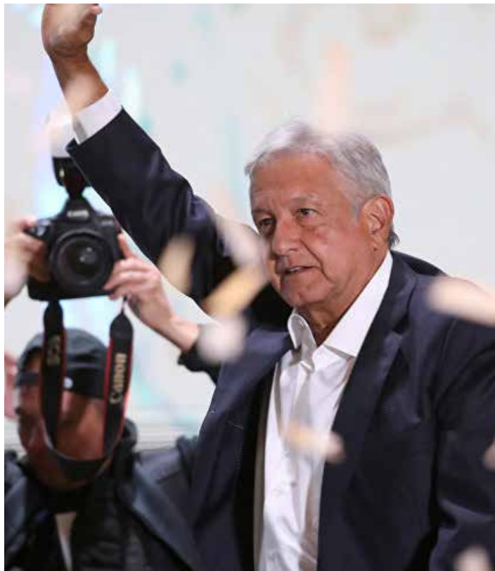
López Obrador tendrá mayoría parlamentaria.

La obligación de López Obrador será demostrar que no es una continuidad de la mentira política. Esto deberá manifestarse en revertir con la mayor rapidez posible