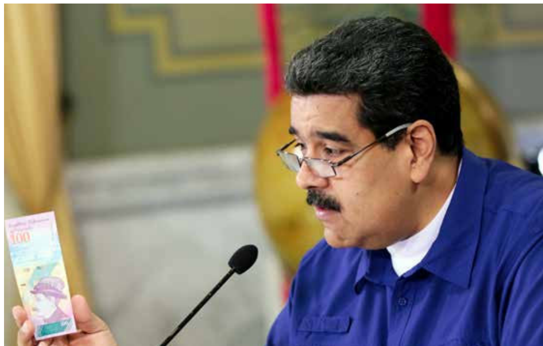
Nicolás Maduro: Hemos dado un paso histórico.

sufriró un duro golpe con la depresión de los precios del petróleo y con la infiltración de PDVSA por sectores mafiosos y corruptos dirigidos desde el exterior. "Le hicieron daño a la industria y la dejaron en un estado de postración que ya vamos superando y sacando adelante gracias a la Clase Trabajadora. Vamos hacia una PDVSA nueva, sana y honesta, nacionalista y patriota, y sobretodo muy productiva, ya la estamos viendo en el horizonte inmediato".