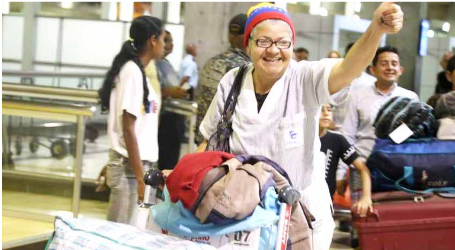
Una venezolana celebra su vuelta a la Patria.