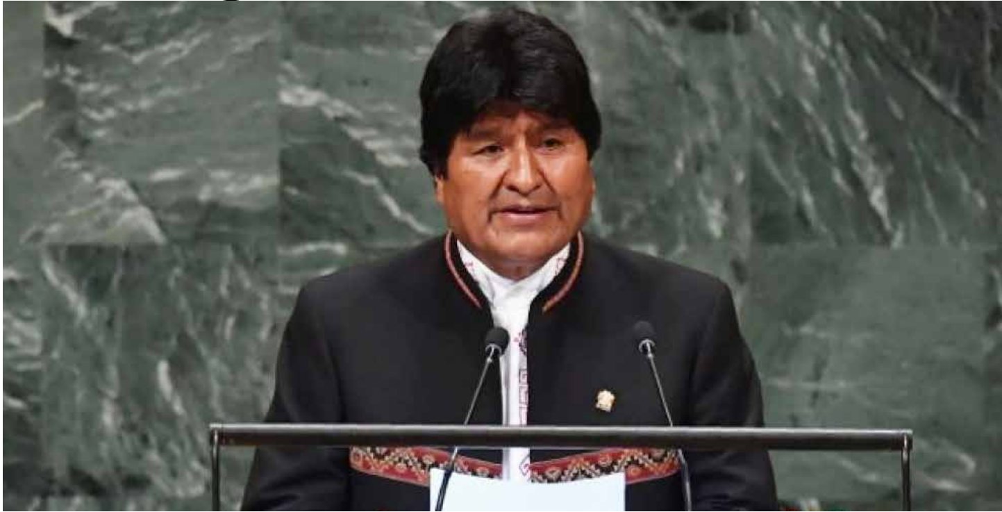
Presidente Evo Morales.

la primera combatiente, Cilia Flores; el ministro para la Defensa, Vladimir Padrino López; la vicepresidenta Ejecutiva, Delcy Rodríguez, y el ministro de Comunicación e Información, Jorge Rodríguez.