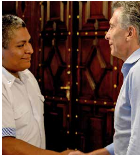
Macri calificó de "héroe" al policía que disparó por la espalda a un joven de 18 años.

Hace muy poco salgo a la calle más o menos temprano, no recuerdo para qué. De repente, un gentío que brama. ¡Dale, reventale la cabeza, matalo a ese hijo de puta! Eran varios los que se ensañaban contra el pibe caído que apenas si atinaba a cubrir su cabeza. Había intentando robar un kiosco de cigarrillos y