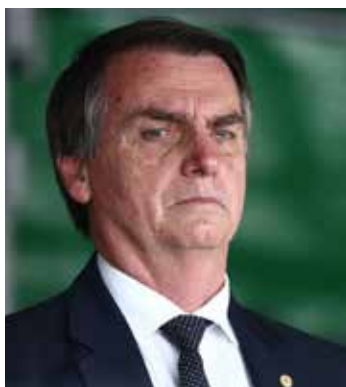
La posible elección del ultraderechista Jair Bolsonaro despierta inquietudes.