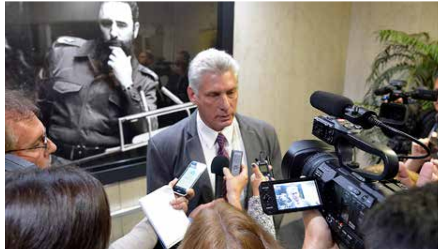
El presidente cubano cumplió un intenso programa durante su primera visita a Estados Unidos.

Como se ha dicho durante tantos años en este mismo escenario, el bloqueo daña