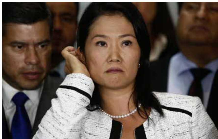
Las modificaciones son impuestas por el partido de Keiko Fujimori, investigada por lavado de activos.