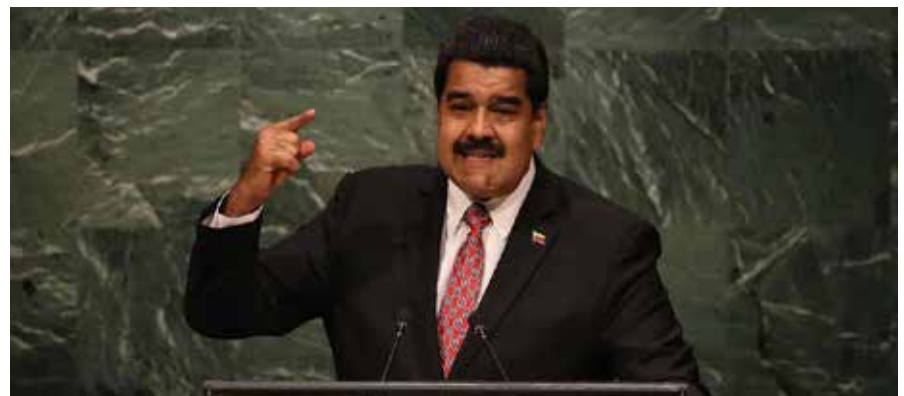
El mandatario Nicolás Maduro precisó que Venezuela es víctima de medidas coercitivas unilaterales.

la soberanía y los intereses de otros países por su agresiva aplicación extraterritorial, expresó el gobernante, quien en nombre del pueblo cubano agradeció el apoyo casi unánime de la Asamblea General a la exigencia de su levantamiento.