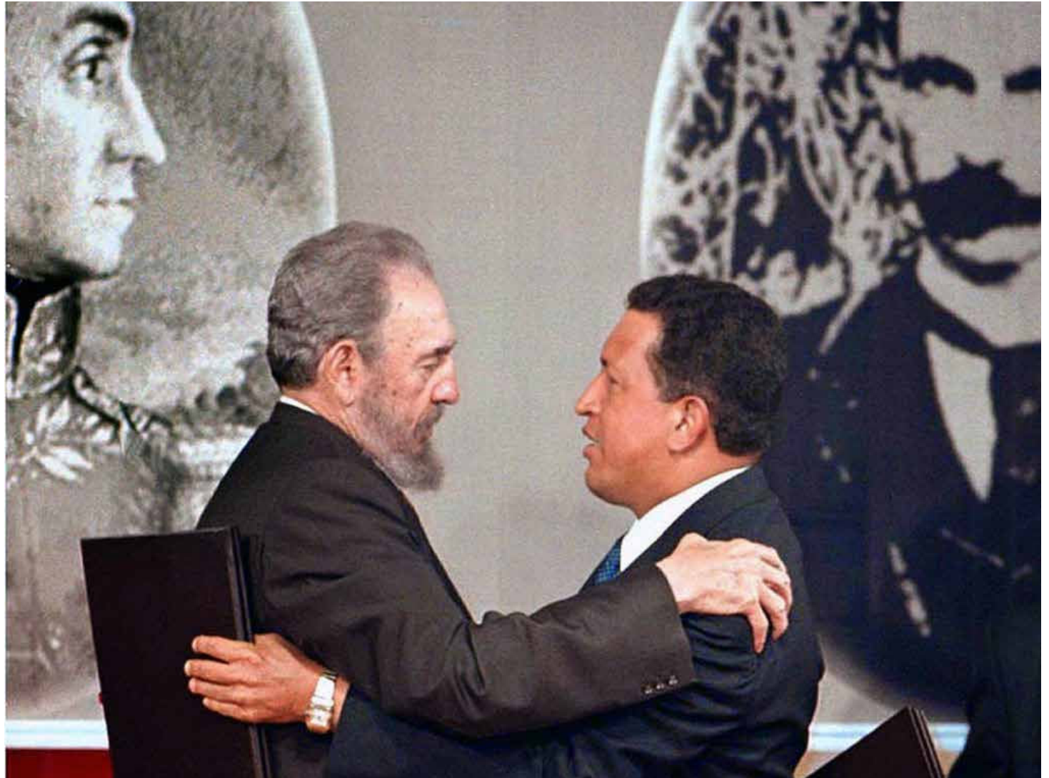
Chávez y Fidel, comandantes eternos.

se plantea la salud como un tema de Derechos Humanos.